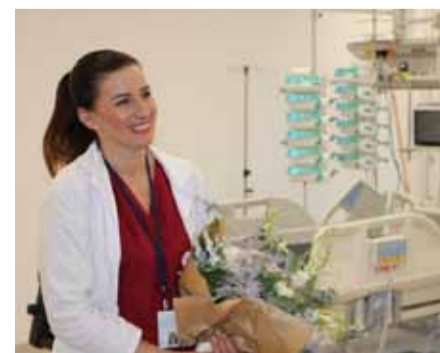
...představila další novinky pro své pacienty.