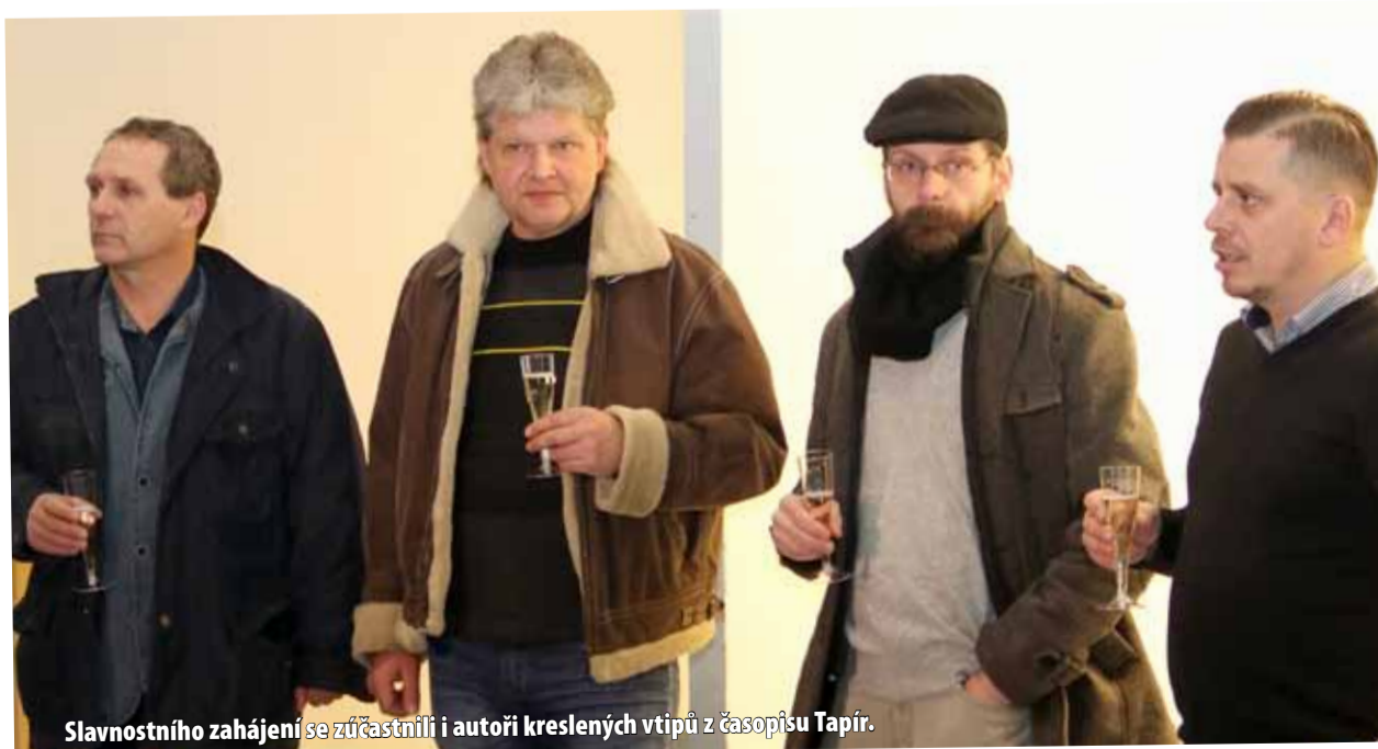
Slavnostního zahájení se zúčastnili i autoři kreslených vtipů z časopisu Tapír.