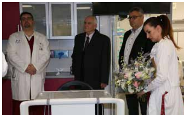
Krajská zdravotní má další důvod k chlubení...

plnohodnotně usilovat o získání statusu centra komplexní vysoce specializované kardiologické péče. Sluší se poděkovat vedení Ústeckého kraje a zastupitelstvu za podporu kardiologického pracoviště, která je od začátku kardiocentra KZ v ústecké Masarykově nemocnici souvisí zcela nově nemocniční pavilon. Na přípravě této významné investiční akce představenstvo a management společnosti usilovně pracuje,“ uvedl Petr Fiala. (nov)