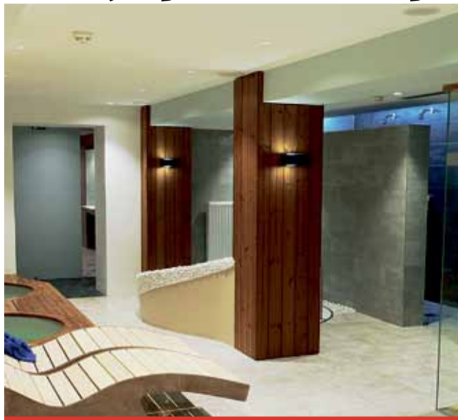
Díky investicím mládežnického klubu se stadion v majetku města Litvínov zmodernizoval. Rehabilitační centrum, stejně jako předchozí posilovna a rozcvičovna jsou primárně určeny mládeži. Do vybudování zázemí pro mládežnický sport investoval HC Litvínov, s.s. bezmála 20 mil. Kč.