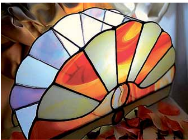
V muzeu si můžete vyrobit vlastní vitráž.