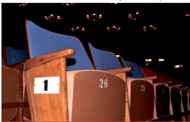
Sedačky prošly nedávno renovací, už se ale znovu začínají ozývat závady.

■ Transparentní účet 123-0334500267/0100 již funguje. Sem jsou směřovány veškeré finanční dary a jsou viditelná jména dárců. Jména dárců budou zveřejněna i na webových stránkách Citadely a vždy před promítáním filmů. U vstupu do kina bude vytvořena „zeď díků“, kde budou uvedena jména všech dárců bez ohledu na výši daru. „Zeď díků odhalíme při slavnostním otevření sálu po výměně sedaček,“ dodává jednatel.