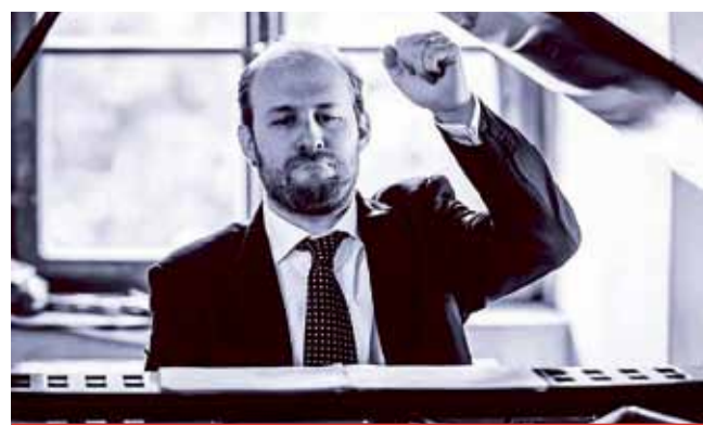
V Mostě zahrane klavírní virtuos.

to, Adagio, ma no troppo, Fuga. Allegro, ma non troppo. L. van Beethoven - Sonáta F dur op. 54, In Tempo d'un Menuetto, Allegretto. L. van Beethoven - Sonáta c moll op. 13 "Patetická", Grave. Allegro di molto e con brio, Adagio cantabile, Rondo. Allegro. Předprodej vstupenek v kanceláři ZUŠ F. L. Gasmanna. Vstupné: 100Kč/ děti, senioři a vojsko 50 Kč. (nov)