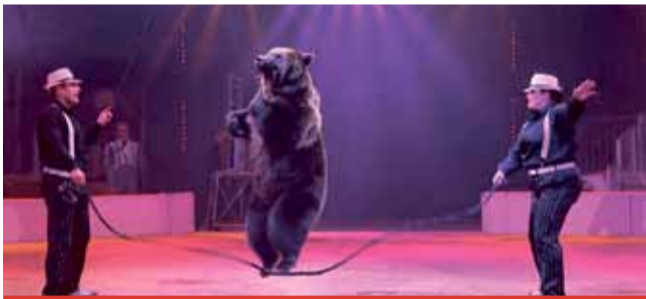
O zvířatech v cirkusech se vedou polemiky.

V poslední době se diskutuje o využívání zvířat v cirkusech. Přibývají názory, že zvířatům se v cirkusech nejlépe a že by si zasloužila větší ochranu. Proto se objevují i zákazy cirkusů, které zvířata ve svém programu využívají. Město Most zajímá názor jeho občanů. Ti proto mají možnost formou ankety vyjádřit svůj názor až do konce ledna 2020. Anketní otázka zní: Souhlasíte, aby se městské pozemky nadále pronajímaly cirkusům se zvířaty? Hlasujte na: www.mobilnirozhlas.cz (sol)