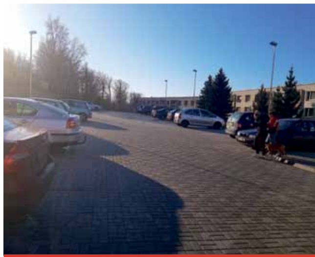
Vloni většina investic plynula do komunikací, chodníků a parkovišť.

Významnou investiční akcí, díky které se rozšířil počet parkovacích míst, byla výstavba parkoviště v ulici Nad Parkem. Za 3,4 mil. Kč u vzniklo 38 míst. Letos připravuje město další dvě parkoviště v ulici Okružní a jedno v ulici Májová. Nejvyšší částku vloni investovalo město do II. etapy výstavby chodníku mezi Mezibořím a Litvínovem. Chodník včetně přechodu vyšel na téměř 14 mil. Kč. Meziboří na tuto akci získalo dotaci 9 mil. Kč. Téměř 1 mil. Kč se investoval do oprav výtlačků na komunikacích. (ink)