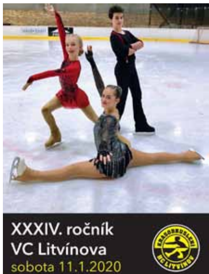
XXXIV. ročník VC Litvínova sobota 11.1.2020

LITVÍNŮV - V sobotu 11. ledna vypukne na Zimním stadionu Ivana Hlinky v Litvínově XXXIV. ročník Velké ceny Litvínova v krasobruslení. Závodit se bude od 8 hodin.