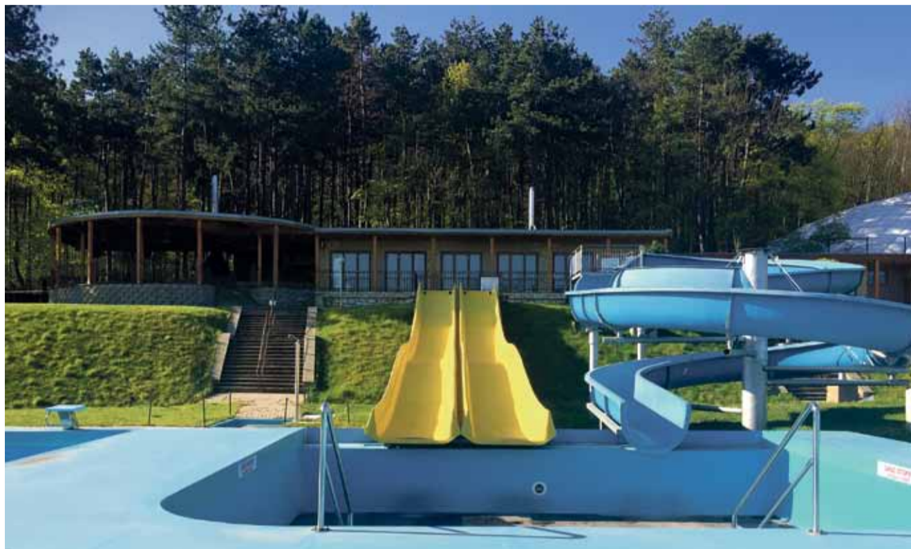
Jedno z nejhezčích míst v Mostě, které sloužilo vodním radovánkám, se zřejmě zavře.

V areálu fungují pouze tenisové kurty a v pronájmu je restaurace. Ta je však s ohledem na vládní opatření v důsledku epidemie dočasně uzavřena. (ina)