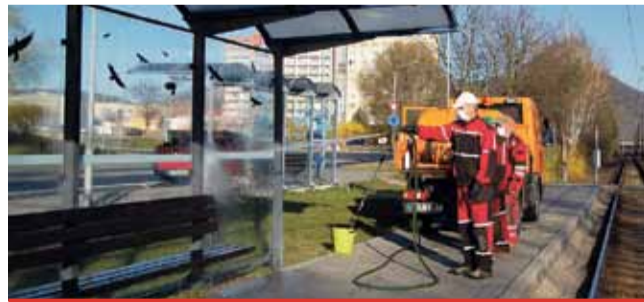
Dopravní podnik dodržuje i nadále zvýšená hygienická opatření.

Cestující si mohou nadále zdarma pořídit přenosnou čipovou kartu s minimálním dobitím elektronického jízdného ve výši 50,- Kč. Karta je vydávána v předprodejních a in-