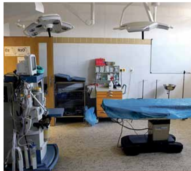
Operační sál je vybaven moderními technologiemi, připraven pro zákroky všech operačních oborů. Náklady na rekonstrukci a vybavení dosáhly 2,5 milionu korun včetně DPH.

byl spojen s rizikem šíření nákazy,“ uvedl primář oddělení Pavel Dlouhý. (nov)