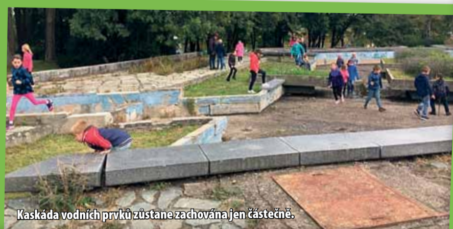
Kaskáda vodních prvků zůstane zachována jen částečně.

„Vítězný koncept jsme ocenili hlavně za čisté krajinářské řešení, které v omezené podobě oživuje původní srdce parku s fontánou a citlivě je doplňuje o nové architektonické prvky. Návrh zároveň nejlépe naplnil zadaná soutěžní kritéria.“