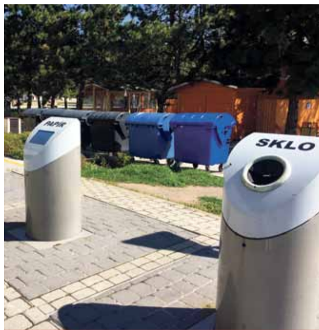
Letos se plánuje rozšíření stanoviště podzemních kontejnerů například u Magistrátu města Mostu o dva kontejnery na komunální odpad.

Koncepcí města k umístování podzemních a polopodzemních kontejnerů vychází z původní projektové dokumentace z let 2009 - 2010. Jednotlivá stanoviště jsou navrhována v daném rozpočtovém období v souladu s požadavky na