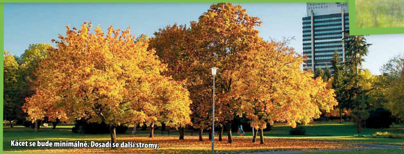
Kácet se bude minimálně. Dosadí se další stromy.