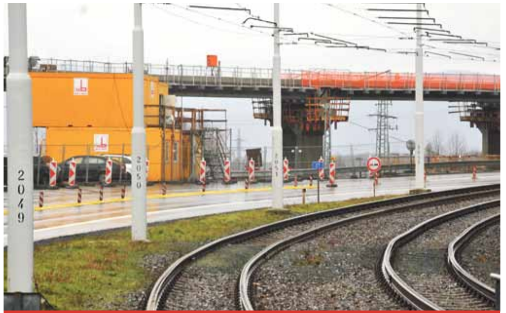
Práce na opravě mostu pod Hněvínem se snad již blíží ke zdárnému konci. Řidiči by si mohli oddechnout od objížďek v červenci.