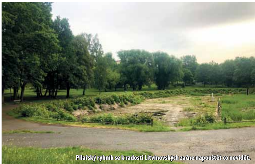
Pilařský rybník se k radosti Litvínovských začne napouštět co nevidět.