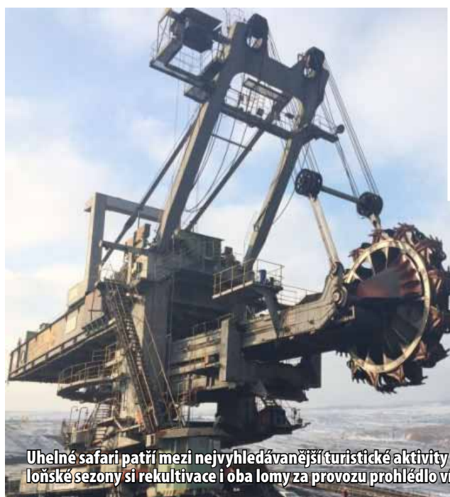
Uhelné safari patří mezi nejvyhledávanější turistické aktivity na Mostecku. Během loňské sezony si rekultivace i oba lomy za provozu prohlédlo více než 3 200 návštěvníků.

mem ČSA. BABY SAFARI povědě zkušená průvodkyně, která dokáže děti zaujmout a formou hry jim těžbu, uhlí a veškerý život kolem hnědouhelných lomů přiblíží. Pro děti máme připravené také pracovní listy, aby si vyzkoušely, co všechno si z návštěvy lomu a následně i Podkrušnohorského technického muzea zapamatovaly,“ představila novinku mluvčí skupiny. Změn dostala také Rekultivační trasa. Ta je nově určena především odborné veřejnosti a té je také přizpůsobena úroveň výkladu. (ink)