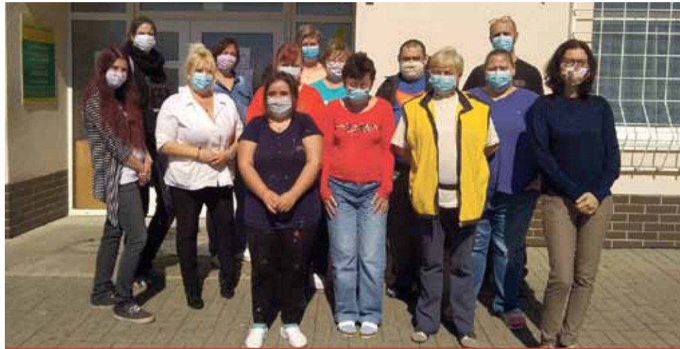
Nejtěžší práce na zaměstnance Energie čekala, když museli uživatelům zařízení celou situaci vysvětlit. Podle ředitelky ale zvládají vše na výbornou.

Řada sociálních zařízení se potýká s nedostatkem ochranných pomůcek. To ale není případ Energie Meziboří. „Jsme zásobováni Ústeckým krajem a na-