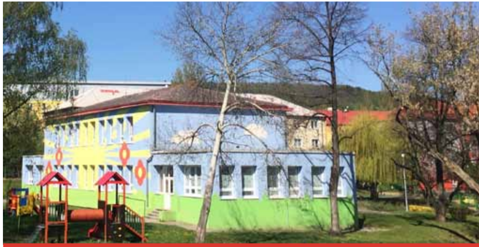
Zápisy do mateřských škol se letos uskuteční v dosud nevídaném režimu.

Povinnost předškolního vzdělávání se vztahuje na děti, které do 31. 8. dosáhly pěti let. Rodiče mohou místo školky zvolit individuální vzdělávání. I tak ale musí přihlásit dítě k zápisu. „Žádost o individuální vzdělávání se předává řediteli školy zároveň s přihláškou k zápisu nebo nejpozději 3 měsíce před počátkem školního roku. Povinné předškolní vzdělávání je možné plnit v posledním roce před zahájením povinné školní docházky i v přípravných třídách základních škol,“ doplni-