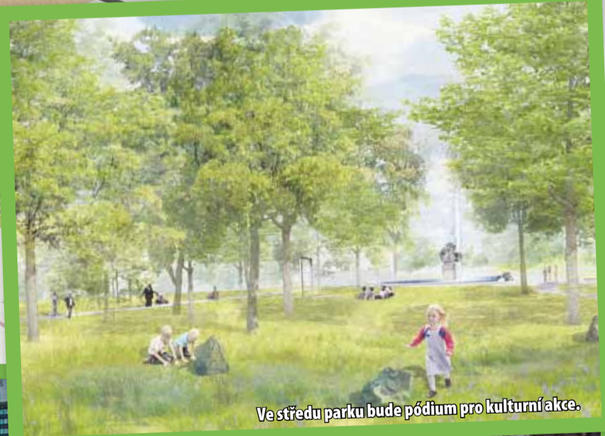
Ve středu parku bude pódium pro kulturní akce.