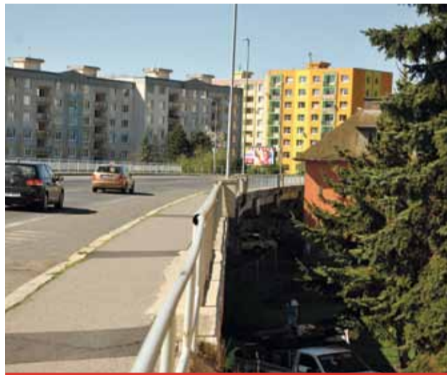
S demolicí mostu na Podkrušnohorské by se mělo začít letos. Čeká se jen na potvrzení dotace a na odhníždění rorýsů a netopýřů.