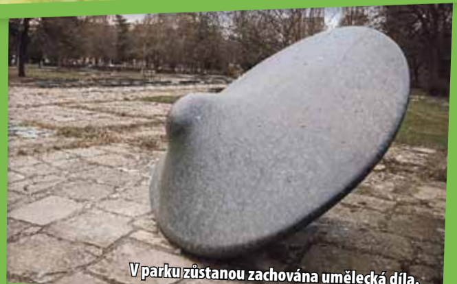
V parku zůstanou zachována umělecká díla.