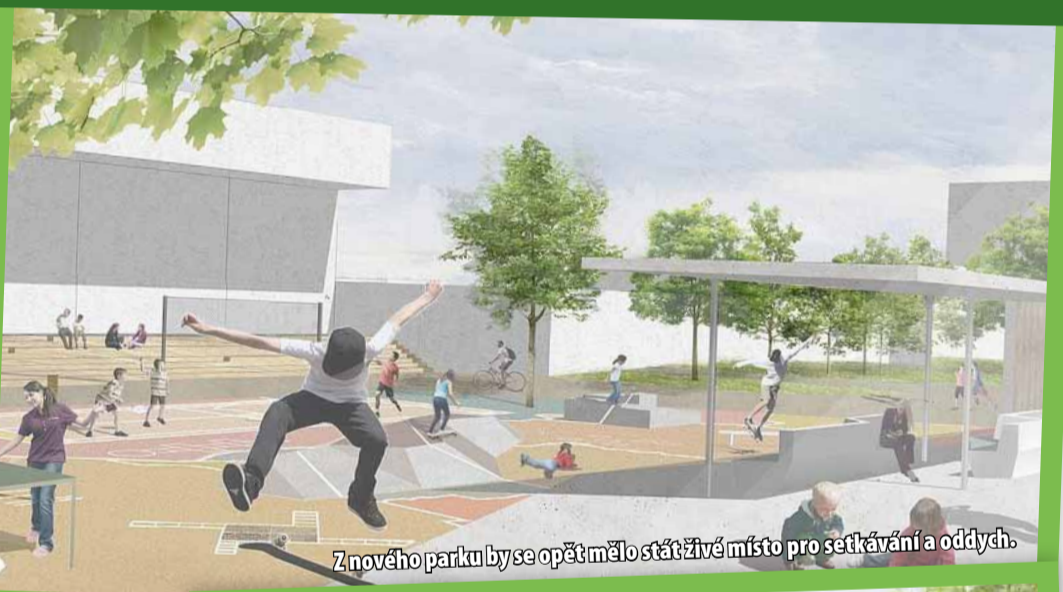
Z nového parku by se opět mělo stát živé místo pro setkávání a oddech.