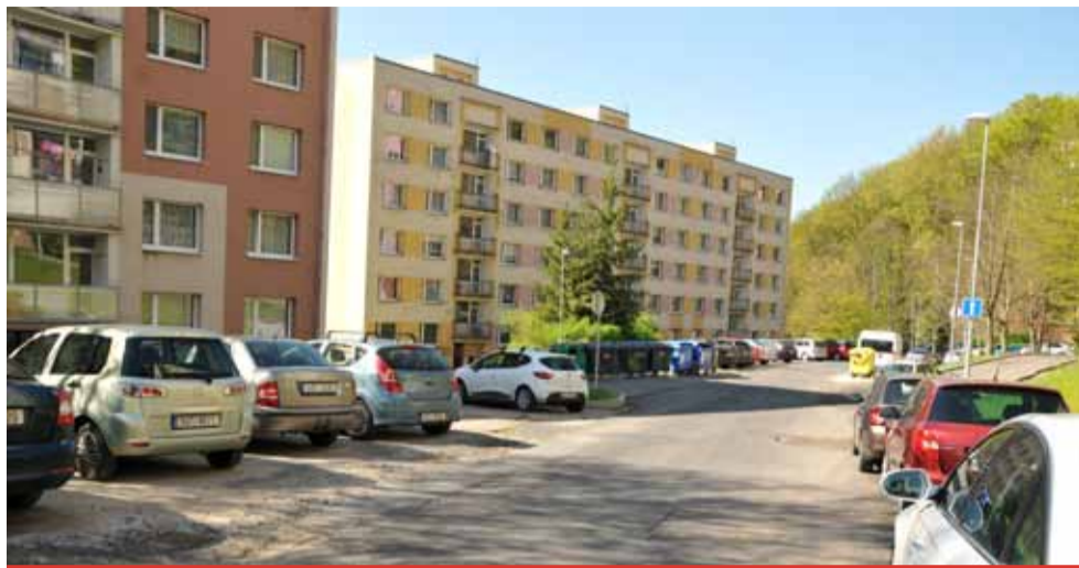
Stavebníci začnou s úpravami Tylovy ulice s největší pravděpodobností v květnu. Řidiči, kteří do sídliště jezdí, by se měli připravit na komplikace v dopravě a na omezení provozu.

Do výběrového řízení o finální dokončení úprav Tylovy ulice se přihlásilo pět firem. Rada města schválila nejvýhodnější cenovou nabídku, bezmála deset milionů korun včetně DPH,