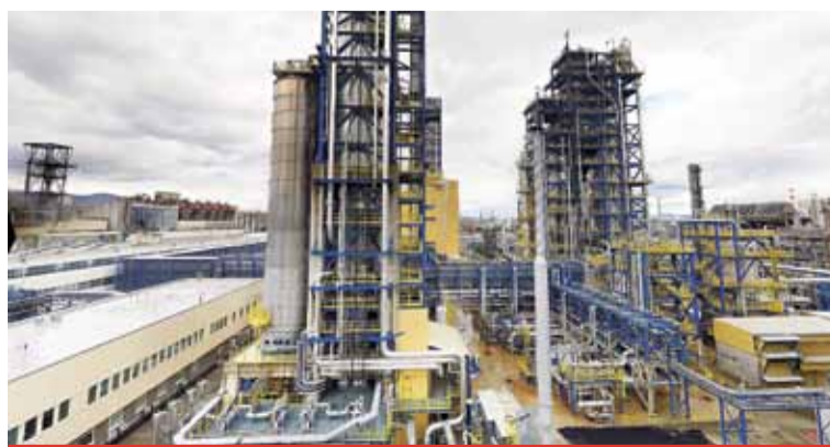
Provozní zkouška a převzetí výrobní části, kde vzniká černý polyetylen, tzv. Black Line, se uskuteční po zrušení omezení týkajících se šíření koronaviru.

Investice umožní hlubší integraci petrochemické a rafinérské výroby nejen v rámci samotné skupiny Unipetrol, ale celé kapitálové skupiny PKN ORLEN. Unipetrol bude moci díky novým technologiím rozšířit své aktivity do nových tržních segmentů a zvýší tak svou konkurenceschopnost v petrochemickém průmyslu na národní i mezinárodní úrovni. (nov)