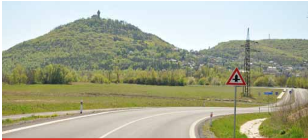
Zda se podaří silnici kolem jezera otevřít alespoň ve druhé polovině roku, zatím není jasné.

Už v roce 2018 se dokončovala výstavba silnice, kterou zajišťuje stát z tzv. vládních ekomiliard, z prostředků pro zahlazování následků těžby uhlí. Tehdy padly první předpoklady o možném otevření silnice, která vede po obvodu mosteckého jezera - první čtvrtletí roku 2019. Od té doby uplynul přesně rok a silnice stále zůstává pro řidiče uzavřena. I přesto, že podle posledních avíz měly být letos na jaře definitivně ukončeny všechny administrativní procesy a komunikace se měla řídit dle ostatní veřejnosti otevřít. „Stavba „Obnovení silnice III/2565 Most - Mariánské Radčice“ je v současné době dokončena a probíhá kolaudační řízení na stavebních úřadech v Mostě a Litvínově, do jejichž správního území stavba náleží,“ zrekapitulovala mluvčí mosteckého magistrátu Klára Vydrová. Tentokrát se věc zadržela na nouzovém stavu a s tím spojenými okolnostmi. „Z dů-