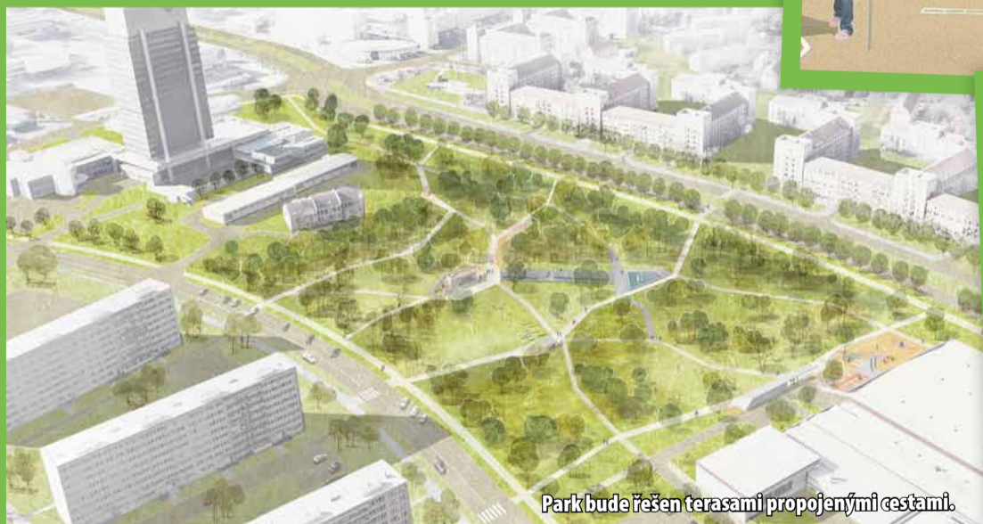
Park bude řešen terasami propojenými cestami.