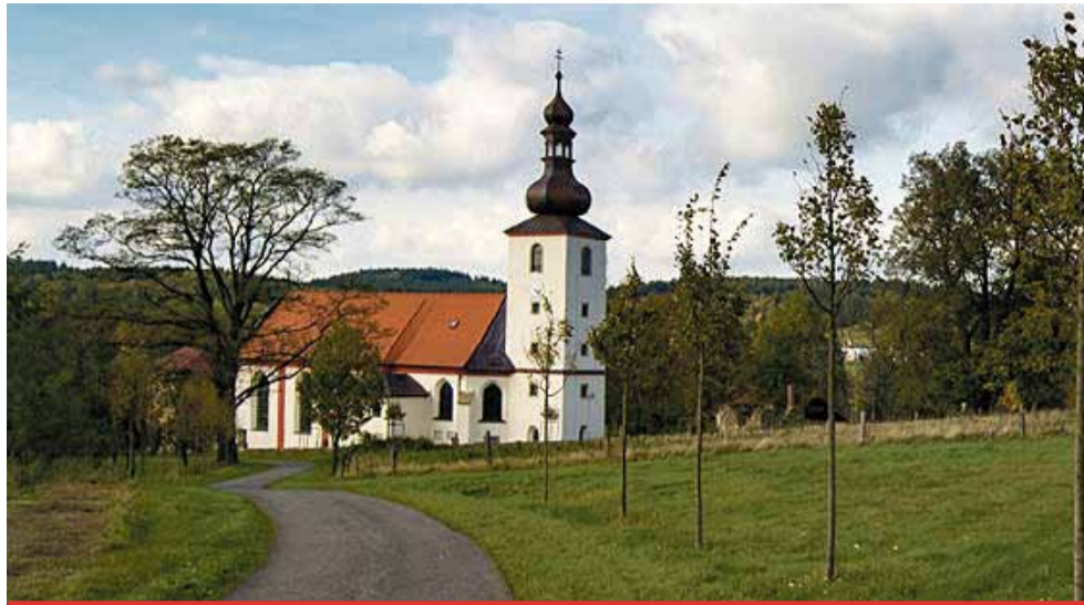
Vítězem a nositelem titulu „Vesnice roku 2019“ se stala obec Lipová z Ústeckého kraje (na snímku). Na druhém místě se umístila obec Ratiboř ze Zlínského kraje a třetí místo obsadila obec Libovice ze Středočeského kraje.

O zrušení aktuálně vyhlášeného ročníku soutěže vyhlášovací rozhodli z důvodu výskytu a šíření koronaviru na území České republiky, ale i mimo toto území. „Než přistoupit k provizoriu, rozhodli jsme se letošní, šestadvacátý ročník soutěže zrušit. Vesnice roku, fenomén našeho venkova, je srdeční záležitostí snad všech soutěžících obcí. Starostové, starostky, zástupci spolků, organizací, občané soutěžících obcí a mnozí další vynakládají spoustu energie a času na přípravu prezentací. Věříme, že toto opatření je ku prospěchu věci. Upřímně nás toto rozhodnutí mrzí, ale zároveň věříme, že je správné a že příští ročník bude o to úspěšnější. Tímto také upřímně děkujeme všem, kte-