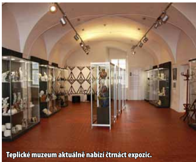
Teplické muzeum aktuálně nabízí čtrnáct expozic.