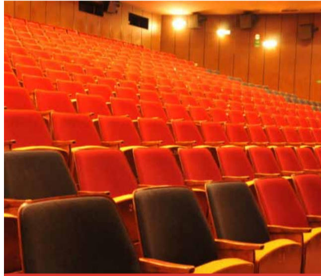
Během doby, kdy se bude v Citadela dělat vzduchotechnika, by se měla také provést výměna sedadel za nová a pohodlnější.

ní pracovní prostředí. Zároveň by mělo dojít k úspoře tepelné energie při větrání, a to díky modernizaci stávajících systémů nuceného větrání s rekuperací odpadního tepla. Práce by se měly realizovat v kinosále, společenském sále, hudebním klubu, zkušebně a cvičebním sále. Jako dodavatel byla vybrána litvínovská společnost NCI.CZ ENGINEERING, s. r. o., s cenou přes 10 mil. Kč bez DPH. Začít by se mělo v nejbližších dnech. Termín pro ukončení je stanoven na konec září. (sol)