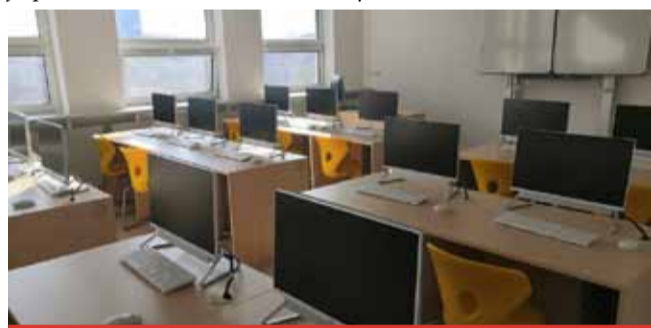
Odborné učebny slouží od ledna už například žákům v ZŠ v ulici Václava Talicha. Náklady na realizaci přesáhly 9,5 mil. Kč. S odbornými učebnami se také může pochlubit 7. ZŠ v ulici J. Arbese, které byly dokončeny letos v březnu.

ní stavby s předpokládanými náklady okolo 45 milionů korun má být do konce roku,“ informovala mluvčí magistrátu Klára Vydrová. Akce je spolufinancována z Operačního programu Životní prostředí, a to pětáctýřiceti procenty z celkových nákladů stavby. „Rekonstrukce se bude realizo-