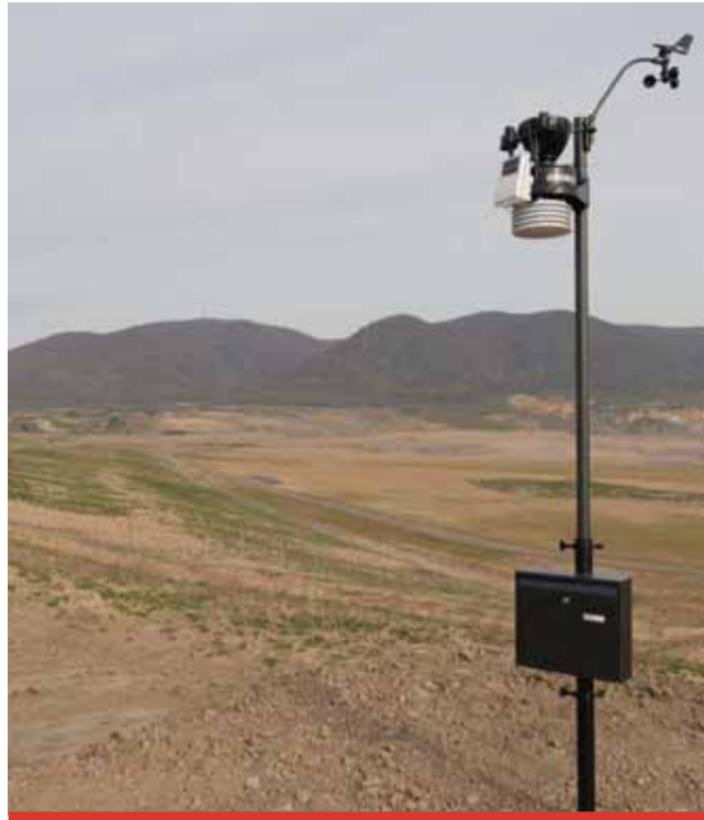
Data z unikátní meteostanice budou také hodně ceněná pro vědce.

ci sledování a vyhodnocování monitoringu lomu ČSA. „Z dat této meteostanice, která je první na území, které bylo změněno těžbou v Mostecké uhelné pánvi, můžeme dlouhodobým měřením a vyhodnocováním sledovat změnu klimatu podle toho, jak se bude rekultivace vyvíjet. Další meteostanice je umístěna u Arboreta tak, aby byly pokryty klimatologicky odlišné oblasti úpatí Krušných hor a srážkového stínu centrální části pánve. U meteostanic je důležité dlouhodobé měření dat. Data z této meteostanice budou také hodně ceněná pro vědce. Jejich jedinečnost je dána právě umístěním na vnitřní výsypce,“ doplnila Ingrid Jarošová, vedoucí oddělení rekultivací ČSA. Součástí meteostanice je i snímač půdní teploty a půdní vlhkosti. (nov)