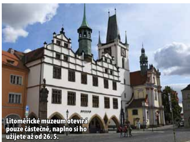
Litoměřické muzeum otevírá pouze částečně, naplno si ho užijete až od 26. 5.