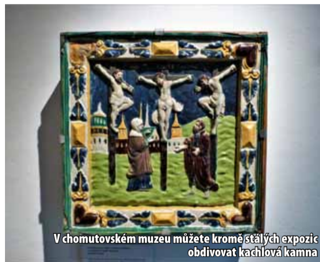
V chomutovském muzeu můžete kromě stálých expozic obdivovat kachlová kamna