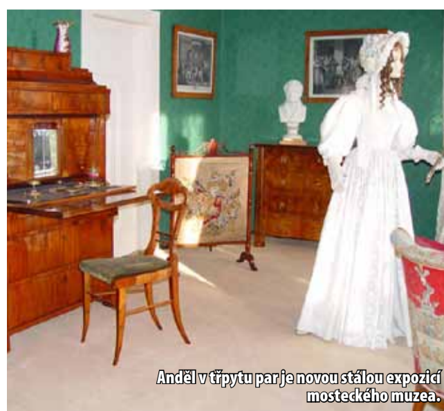
Anděl v třpytu par je novou stálou expozicí mosteckého muzea.