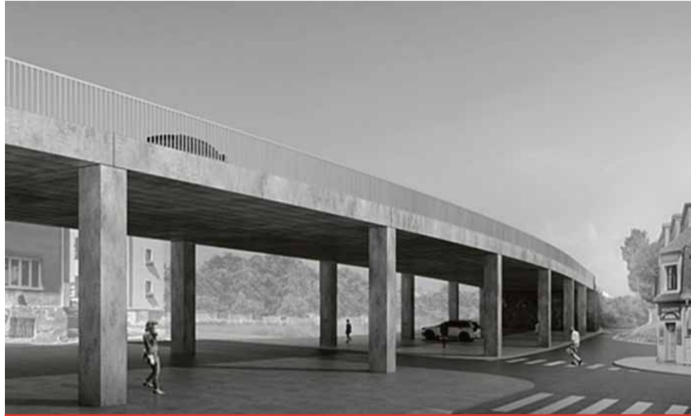
Mimo provoz bude při stavbě mostu frekventovaný úsek na ulici Podkrušnohorská. Litvínovští by měli počítat se zvýšeným provozem v centru města a větší zatížeností na křižovatkách ulic PKH, Valdštejská a křižovatky „u hodin“, ulic PKH a S. K. Neumanna. (foto: vizualizace nového mostu)

Vítězná firma musí zajistit demolici stávajícího mostu a výstavbu nového mostního objektu přes ulici Mezibořská v Litvínově. Nová konstrukce bude oproti té stávající užší. Vychází z požadavků architektonické studie vzešlé z architektonické soutěže o návrh na řešení, která proběhla v roce 2016. V rámci stavebních úprav plochy pod mostem se vybudu-