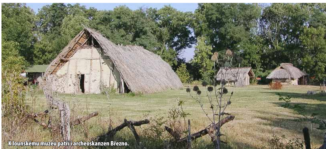
K lounskému muzeu patří i archeoskanzen Březno.