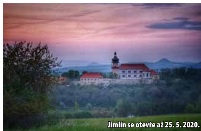
Jimlín se otevře až 25. 5. 2020.