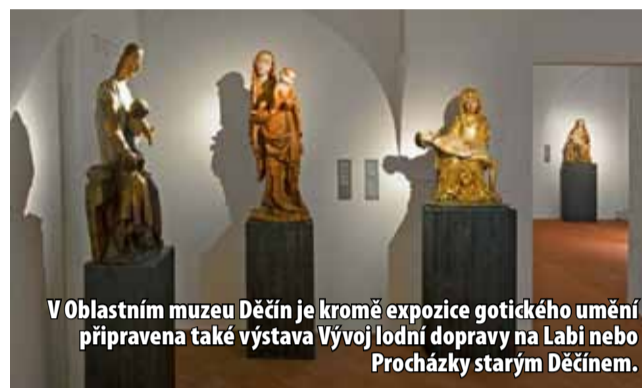
V Oblastním muzeu Děčín je kromě expozice gotického umění připravena také výstava Vývoj lodní dopravy na Labi nebo Procházky starým Děčínem.