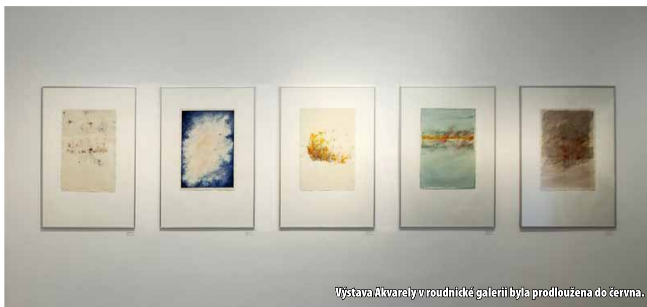
Výstava Akvarely v roudnické galerii byla prodloužena do června.