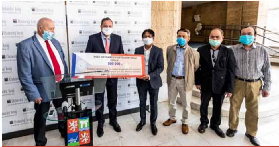
Kromě finančního daru věnovala vietnamská komunita Ústeckému kraji 950 osobních ochranných pomůcek.

Sbírku inicioval a zastřelil Svaz Vietnamců v Ústeckém kraji. Částku 471 450 korun, která byla posbírána v okrese Teplice, Ústí nad Labem a Most, již vietnamská komunita jednotlivým nemocnicím v těchto oblastech předala. Zbylá částka, kterou společnost Krajská zdravotní obdržela, bude využita k nákupu zdravotnických přístrojů. Celkem 120 tisíc korun případně Nemocnici Teplice na nákup plicního ventilátoru. 100 tisíc korun je určeno pro Nemocnici Most na nákup ozonového generátoru a zbylá částka poputuje do Masarykovy nemocnice v Ústí nad Labem, ta za ně nakoupí plicní ventilátory.