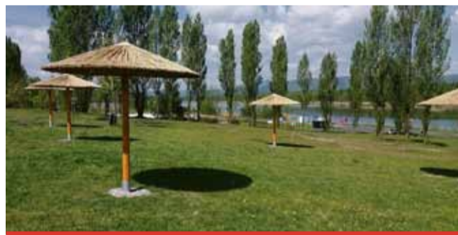
Matylda se stává čím dál víc oblíbeným místem pro rekreaci a odpočinek. Proto jí Technické služby města Mostu opět vylepšují.

Další významnou změnou, která se na Matyldě uskutečňuje, je rekonstrukce sociálního zařízení, kterou nyní dokončují technické služby. „Matylda je pro nás místo s velkým potenciálem, které udržuje pozornost a návštěvnost místních i přespolních. Proto se snažíme loka-