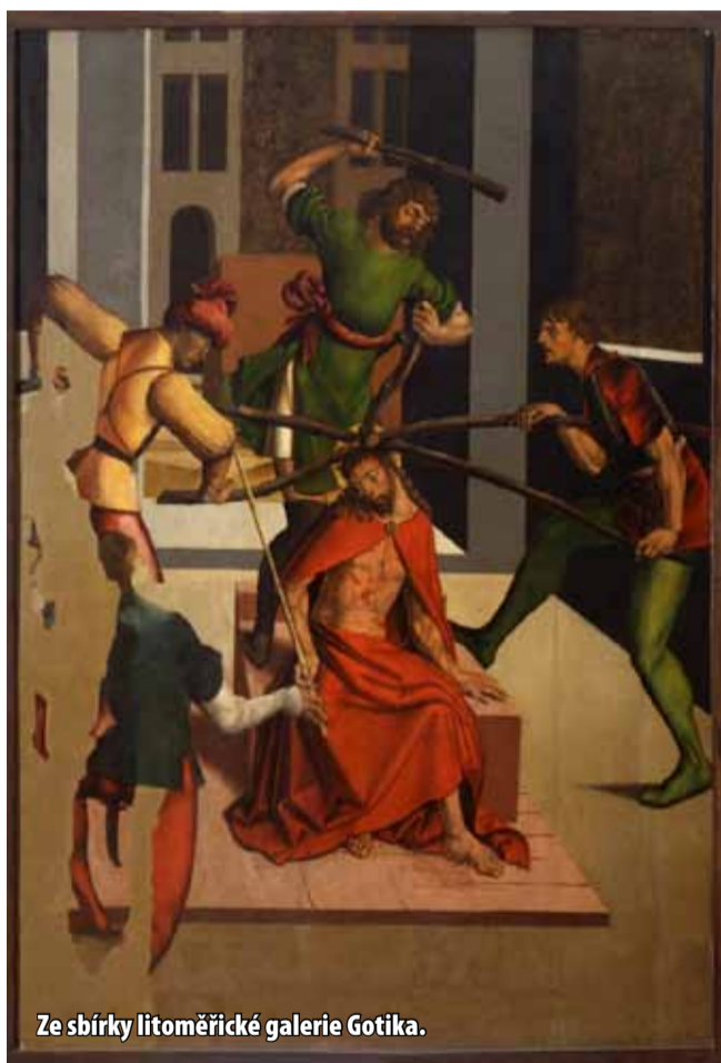
Ze sbírky litoměřické galerie Gotika.

ÚSTECKÝ KRAJ – Mimořádná opatření uzavřela na několik týdnů také všechna muzea a galerie v Ústeckém kraji. Většina z nich nabízí virtuální prohlídky připravených expozic. Už od příštího týdne se ale můžete vydat do muzeí a galerií za památkami a zajímavostmi na živo. Galerie a muzea otevírají 11. května. Severočeská hvězdárna v Teplicích a zámek Nový hrad Jimlín až 25. května.