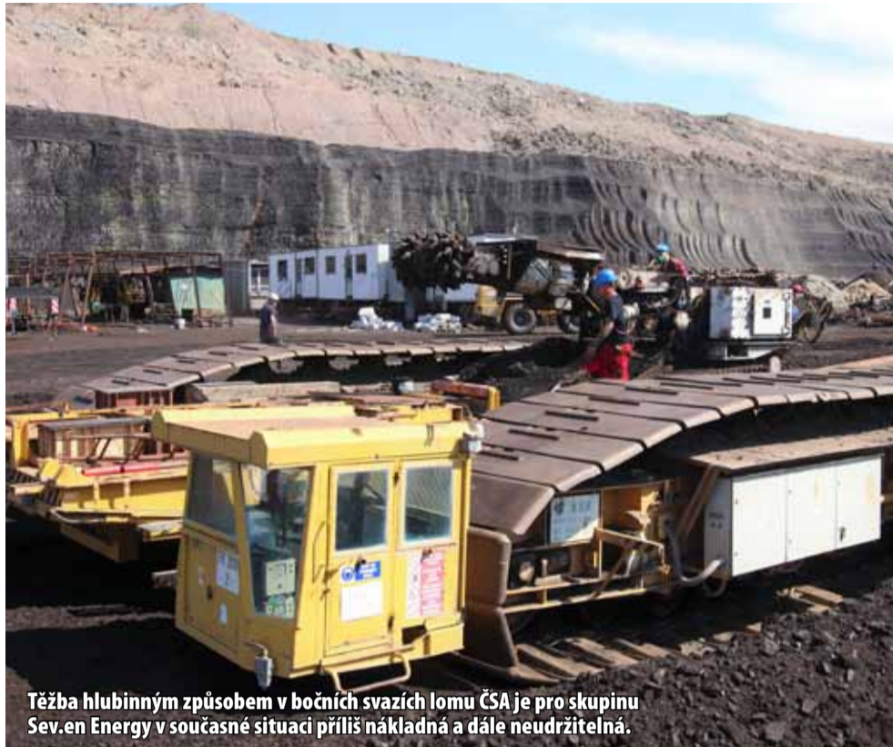
Těžba hlubinným způsobem v bočních svazích lomu ČSA je pro skupinu Sev.en Energy v současné situaci příliš nákladná a dále neudržitelná.

V současné době probíhá ukončování těžby v hlubinném dole. Těžba hlubinným způsobem v bočních svazích lomu ČSA je pro skupinu Sev.en Energy v současné situaci příliš nákladná a dále neudržitelná. „Jednalo se o dočasný projekt, kterým jsme si chtěli zajistit další vysoce kvalitní uhlí především pro výrobu tříděných druhů uhlí pro využití v domácích kotlích. K tomu jsme využili, alespoň na nějaký čas, práci horníků z uzavřeného dolu Centrum. Provoz hlubiny jsme prodlužovali na samotnou hranici únosnosti a ekonomických možností. V současné době je vzhledem k výraznému propadu poptávky po tříděném uhlí její další fungování bez vět-