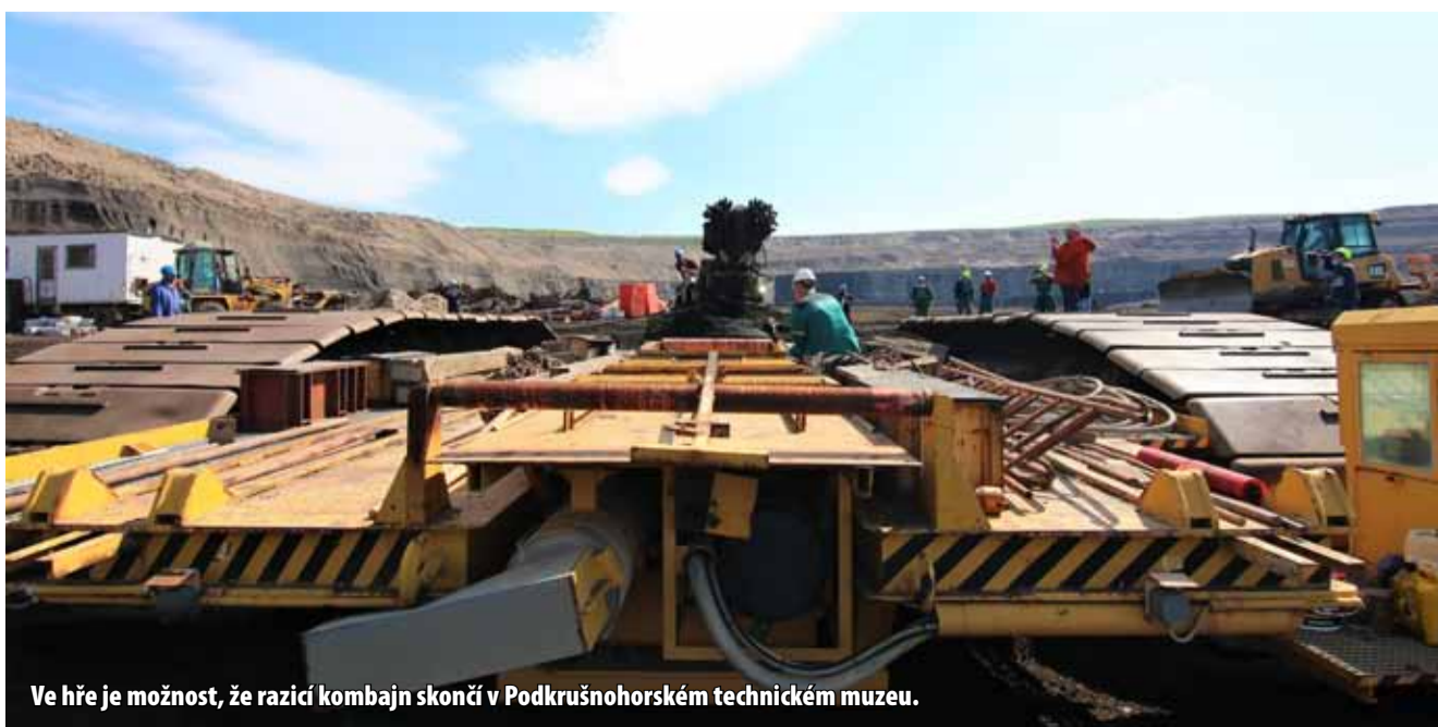
Ve hře je možnost, že razicí kombajn skončí v Podkrušnohorském technickém muzeu.