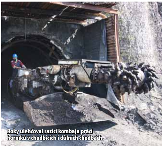
Roky ulehčoval razicí kombajn práci horníků v chodbách i důlních chodbách.

ho jezera. V současné době Severní energetická ve spolupráci s vládou a Palivovým kombinátem Ústí zvažuje také možnost průtočných jezer, která by byla nejen zásobárnou vody, ale také vhodná pro energetické využití. (ink)