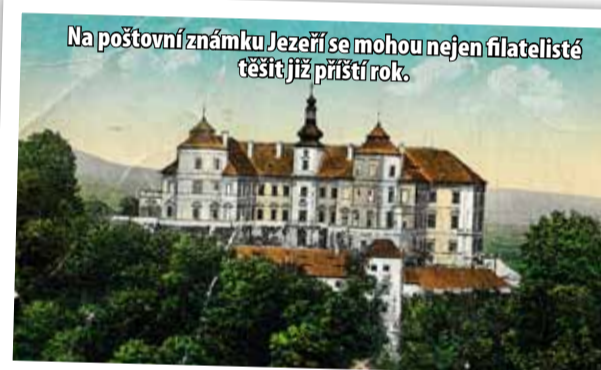
Na poštovní známku Jezeří se mohou nejen filatelisté těšit již příští rok.