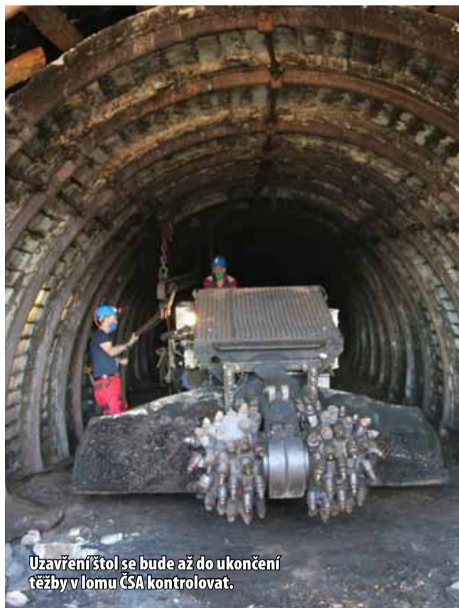
Uzavření štol se bude až do ukončení těžby v lomu ČSA kontrolovat.