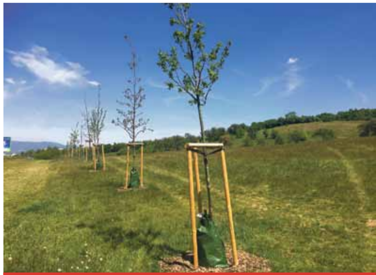
V současné době technické služby instalovaly zelené zavlažovací vaky k padesáti mladým doubkům na kopci Šibeník, vysazeným podél ulice Jiřího z Poděbrad a z ní směrem do vrchu.