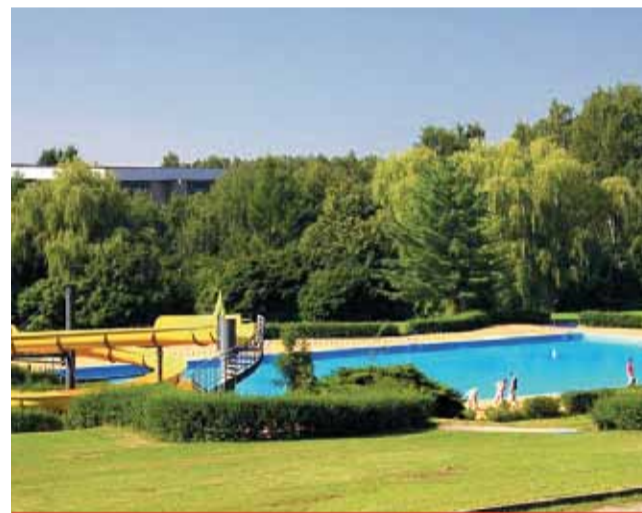
Zkrácený noční klid by měl platit v Litvínově například pro koupaliště Koldům kvůli promítání letního kina.

ky, a to v noci z pátku na sobotu a ze soboty na neděli od 5. června do 29. srpna od 2 do 6 hodin ráno. „Tato výjimka bude platit, pokud zastupitelé nové znění vyhlášky schválí, pouze v takové noci, kdy se pořádá veřejnosti přístupná společenská akce s doprovodným hudebním programem určená nejméně pro 50 osob,“ informovala mluvčí litvínovské radnice Jitka Pavlíková. Termín konání akcí se zveřejňuje na úřední desce Městského úřadu Litvínov nejméně 15 dnů předem dnem konání takové akce. (sol)