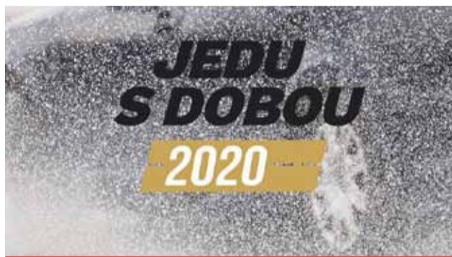
Senioři se mohou zaregistrovat na webových stránkách projektu Jedu s dobou nebo na webových stránkách mosteckého autodromu.

demie koronaviru si ale vyžádala nucenou pauzu. Omezený pohyb obyvatel nám neumožnil od února prakticky žádné akce pro veřejnost uspořádat. Letošní premiéru tak máme až 24. května, v dopoledním i odpoledním kurzu zbyvají poslední volná místa. Zájemci by tak s přihlášením neměli váhat,“ vysvětlila ředitelka polygonu společnosti AUTODROM MOST Veronika Raková. (nov)