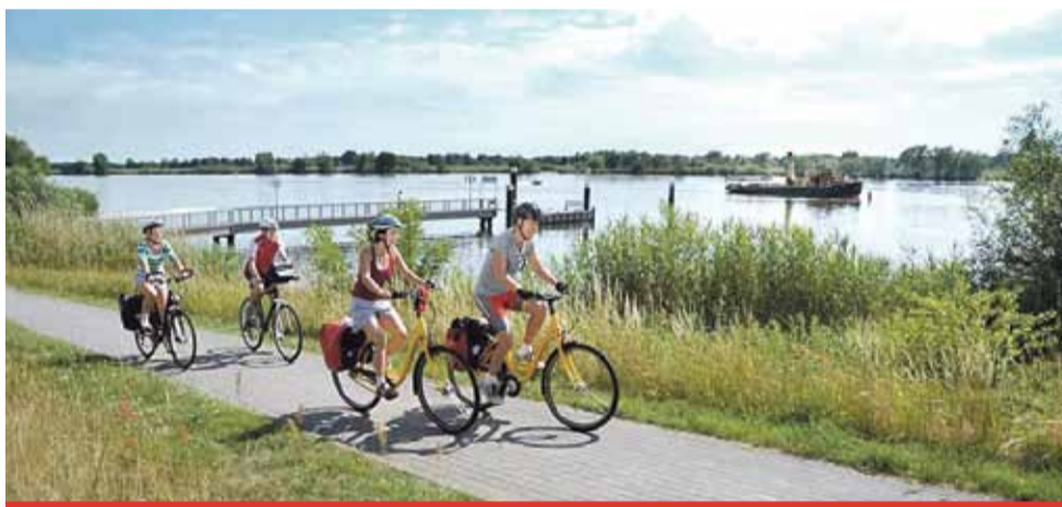
Labská stezka je pro turisty jedna z nejoblíbenějších dálkových tras.

Ústecký kraj je realizátorem a investorem cyklostezky Labská stezka. Letos se pracuje v trase Třeboutice – Křešice – Nučnice a Račice – Hněvice. Vysoutěžená cena 45, 2 milionu a 28, 4 milionu se může zvýšit o vícepráce v souvislosti s nestabilním terénem, jiné úseky by naopak mohly být pro cyklisty sjízdné již v letních měsících. „Labská stezka je jedním z nejlepších turistických produktů v Ústeckém kraji, o čemž svědčí i řada místních i zahraničních ocenění. V současné době může být ideálním lákadlem pro ná-