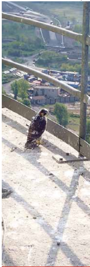
Hnízdění sokolů na komíně je výsledkem dlouhodobé spolupráce firmy s ornitology ze společnosti Alka Wildlife, kteří se snaží o návrat sokolů do přírody.