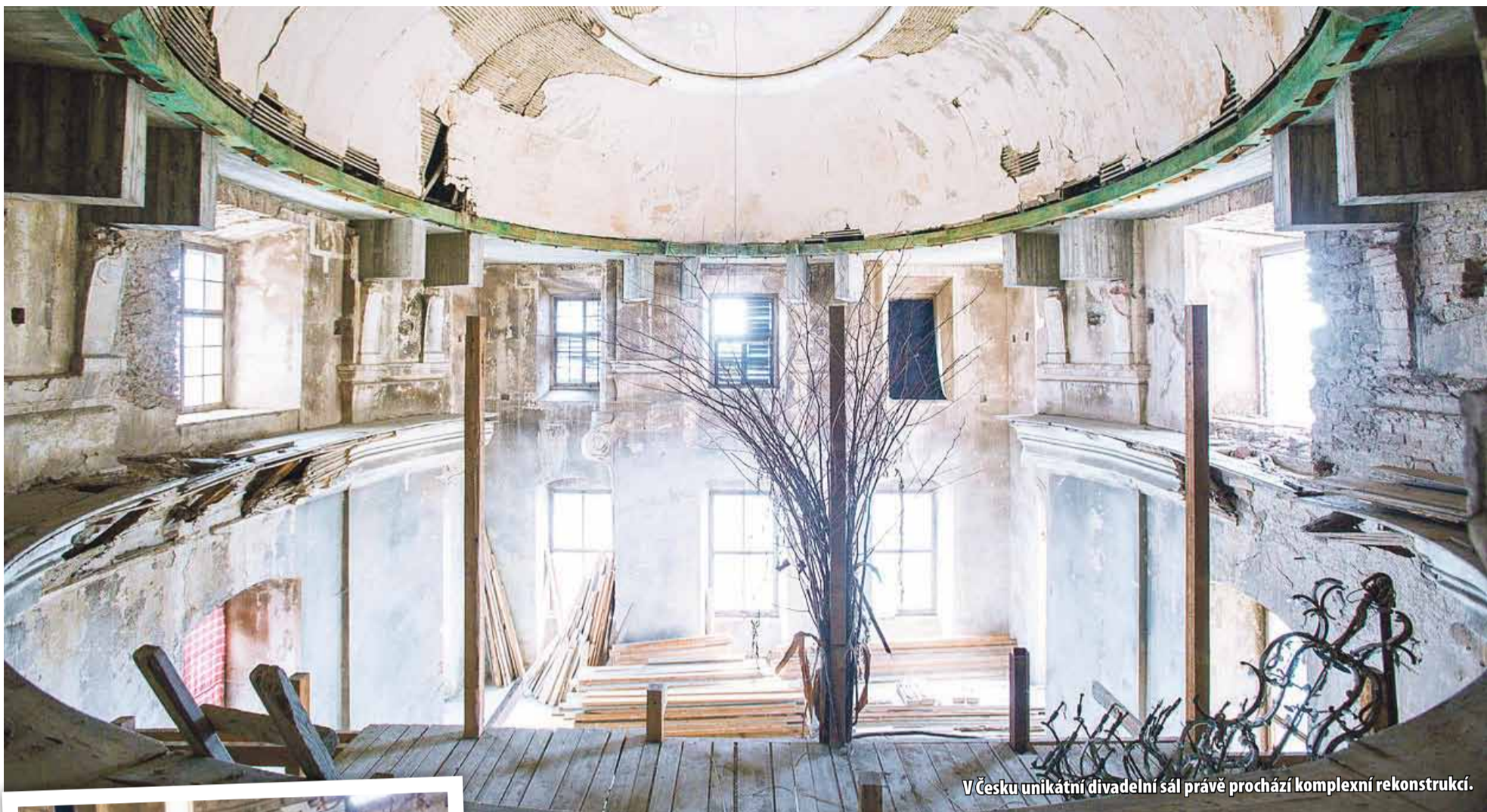
V Česku unikátní divadelní sál právě prochází komplexní rekonstrukcí.