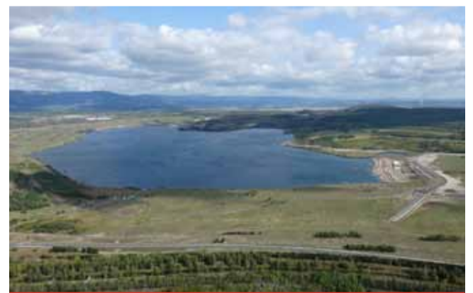
Po přednášce v knihovně, kterou o jezeře Most zorganizoval Palivový kombinát, bude následovat exkurze kolem samotného jezera.

Na zmíněnou přednášku bude navazovat exkurze kolem samotného jezera Most s Ing. Ja-