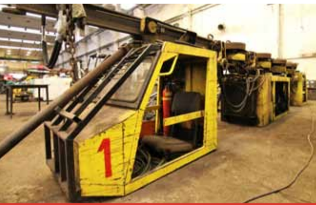
Návštěvníci muzea se mají příští rok opravdu na co těšit.