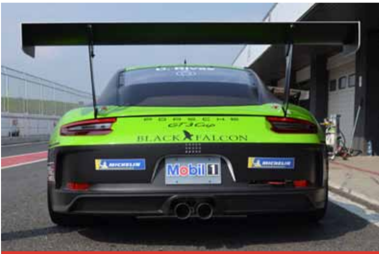
Zájemci mohou vybírat už ze čtyř modifikací kurzu sportovní jízdy. Vedle novinky pro vlastníky vozů Porsche jde také o klasický kurz sportovní jízdy, kurz sportovní jízdy Intensive a kurz sportovní jízdy Intensive OCR.