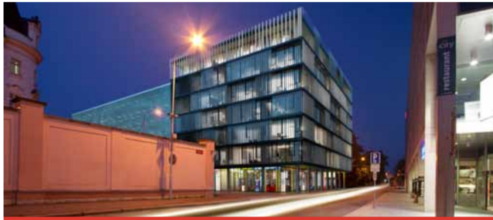
Takto například vypadá parkovací dům v Českých Budějovicích.

Na místě zdemolované školy by měl následně vyrůst parkovací dům. Radní již schválili záměr výstavby parkovacího objektu a pořízení architektonicko-dopravní studie. „Území, které