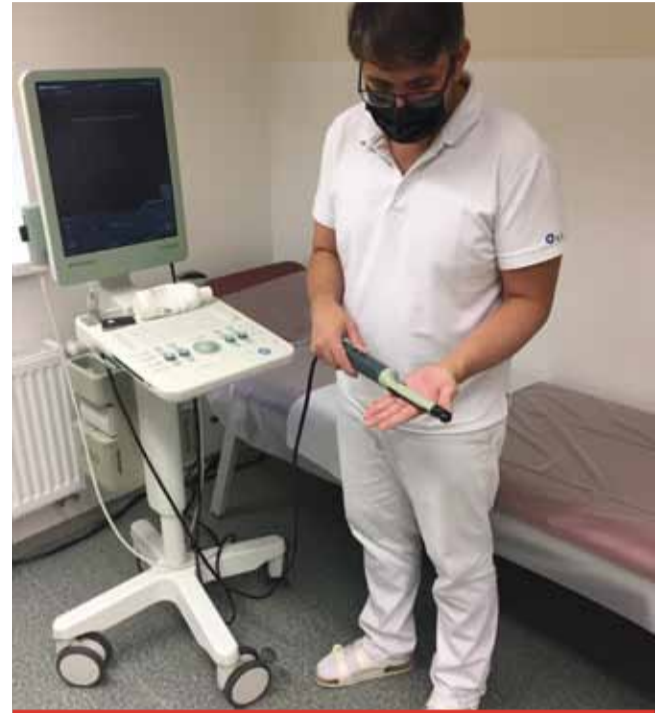
Speciální přístroj v rukou zkušeného urologa výrazně přispívá k odhalení časného stadia nádoru, kdy je možné jeho úplné vyléčení.

Do nové urologické ambulance je možné se objednat telefonicky nebo e-mailem, přičemž ošetření je možné u všech pacientů i samoplátců. „Máme