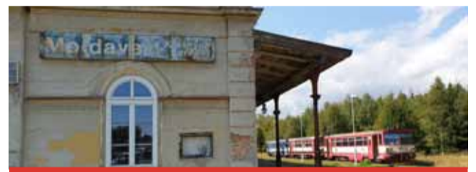
Moldavské nádraží má opět naději na obnovu.

Obec Moldava požádala minulý týden ministerstvo průmyslu a obchodu prostřednictvím státní agentury CzechInvest o pokračování v procesu žádosti o zajištění prostředků na rekonstrukci historické nádražní budovy. Tento krok je výsledkem jednání obce s MPO ČR a Stevem Ittershagenem, kte-