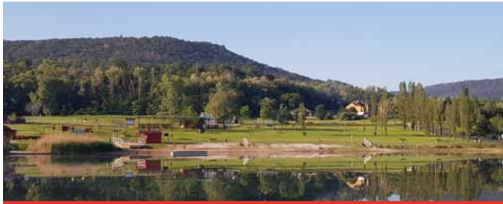
Na Matyldě chybí stín a klima, které poskytují pouze stromy. Technické služby města Mostu zde proto začaly s výsadbou.

Výsadba těchto stromů reaguje na situaci, kdy plocha byla částečně v minulosti osázena především topolovitými dřevinami, ale většina lokality je bez vyšší zeleně, pouze travnatá. „Chybí zde stín a klima, které poskytují pouze stromy. Z hlediska estetického je tento záměr vhodný a lze jej provést vzhledem k dlouhodobé perspektivě lokality