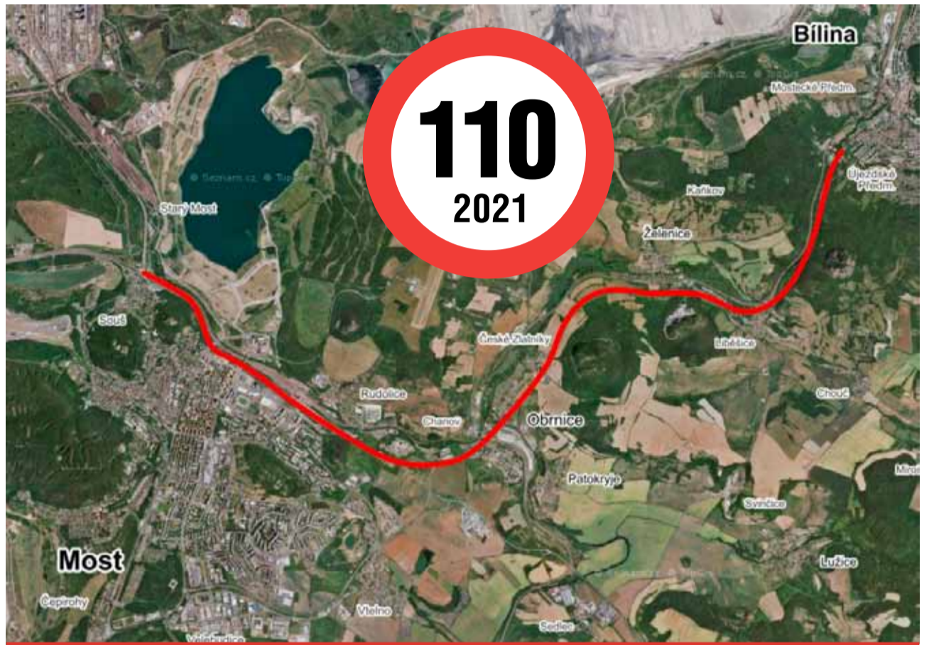
Než se bude moci jezdit mezi Mostem a Bílinou vyšší rychlostí, musí se udělat řada stavebních a bezpečnostních opatření.

Ke zrychlení silnice I/13 by v případě, že bude úspěšně vysoutěžena zhotovitel úpravy dopravního značení, mělo dojít zhruba v polovině příštího roku. Se zrychlením silnice se počítá v úseku od Bíliny Kyselky po křížení silnice I/13 se silnicí I/27 (pod Hněvínem). Celý tento úsek by měl být ve třech místech, tam kde dochází ke křížení silnic, přerušen sníženou rychlostí 90 km/h. (nov)