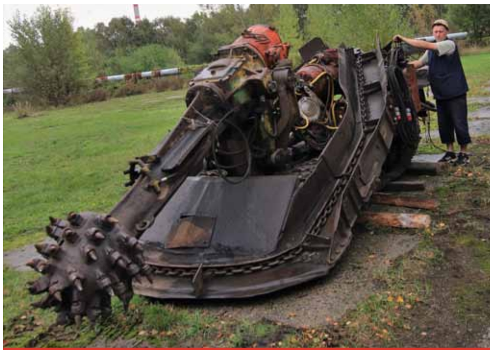
Podkrušnohorské technické muzeum bude mít ve své sbírce v nové sezoně exponáty, které jinde nemají.

Do muzea ze Severní energetické kromě důlního vlaku s drážkovými kolejnicemi a závěsnými vozíky, razicího kombajnu a náhradních dílů, ze kterých se dá sestavit dobývací kombajn, poputuje také další důlní vybavení, jako jsou důlní telefony, sebezáchranné přístroje, důlní lampy, důlní osvětlení a další nezbytnosti, bez kterých by expozice nebyla autentická. „Podkrušnohorské technické muzeum