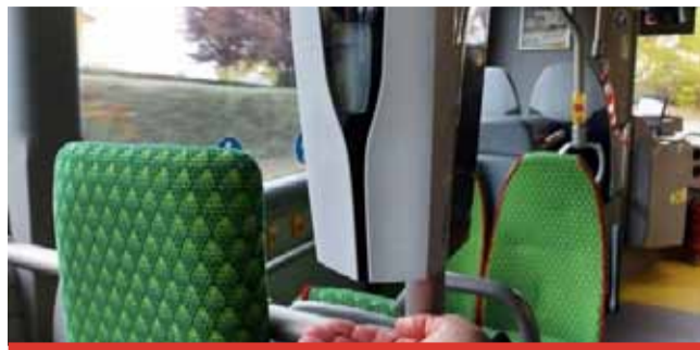
Bezdotykový infra dávkovač na desinfekci mají všechny krajské autobusy.