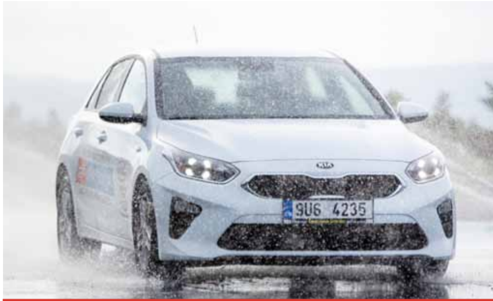
Pokud to epidemiologická situace dovolí, Kurz bezpečné jízdy – úroveň 2 bude mít premiéru v sobotu 12. prosince.

Kurz bezpečné jízdy vyšší úrovně dává více prostoru nácviku zvládání krizových situ-