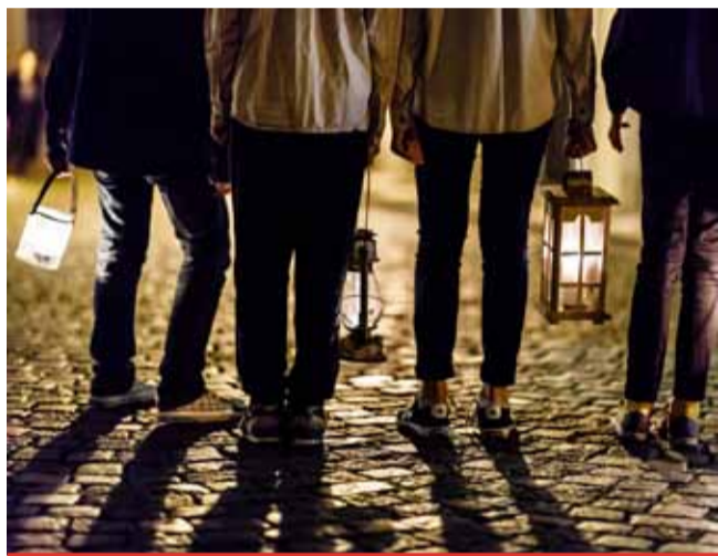
Do Mostu přijede Betlémské světlo v sobotu 19. prosince.

19. 12. - rozvoz skautskými kurýry po celé České republice