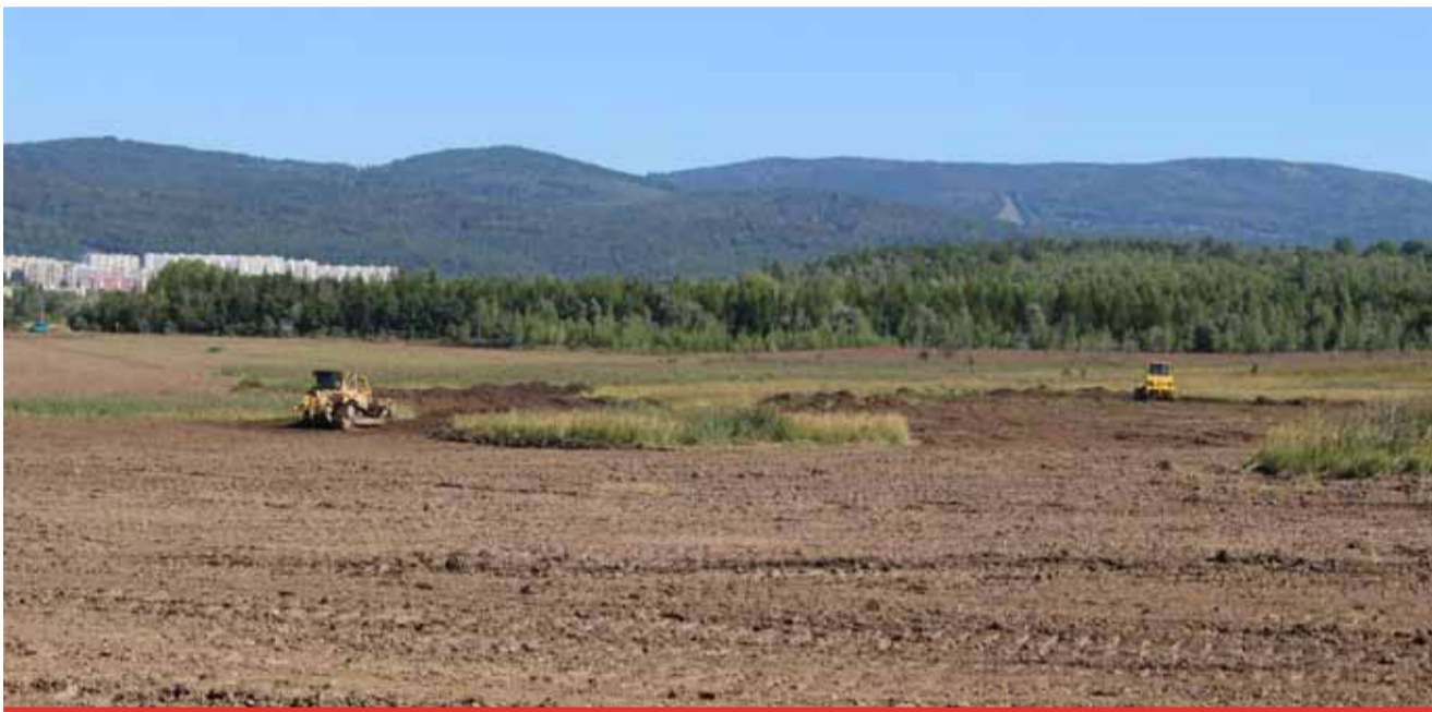
Moderní rekultivace, která do nejmenších detailů souzní s přírodou, v současné době vzniká na obráběcké výspě u Horního Jiřetína. Plocha o výměře bezmála 168 ha se začala měnit v srpnu.