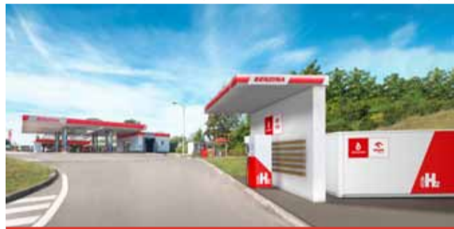
Vozy na vodíkový pohon na rozdíl od klasických elektromobilů nepotřebují k provozu baterie a jejich tankování tak zabere stejně času jako u benzinových či naftových automobilů.