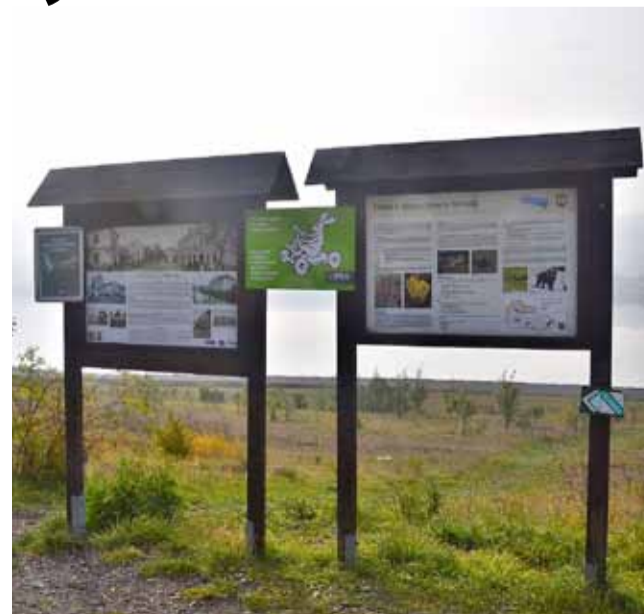
Palivový kombinát Ústí zve k jezeru Milada na nevšední podívanou

Historie informačních cedulí na Miladě se datuje od roku 2016, kdy vznikl projekt Milada – bezpečně a bez bloudění, na kterém se společně s městem podílel Palivový kombinát Ústí a Dobrovolný svazek obcí Jezero Milada. Do této spolupráce se připojilo i Muzeum města Ústí nad Labem, které zpracovalo texty o zaniklých obcích a doplnilo je o dobové fotografie. Na stránkách muzea mohou také turisté najít doplňující informace o zatopených obcích, a to jednoduše pomocí QR kódů nacházejících se na všech informačních tabulích. (nov)