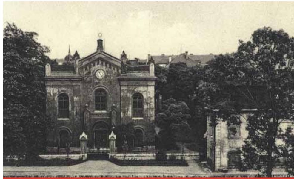
Dramatické události křišťálové noci se odehrály před 82 lety i v Mostě.

Letošní připomenutí křišťálové noci se bude muset vzhledem k epidemiologické situaci obejít bez veřejné piety. Tu v minulých letech organizovala například Židovská obec Teplice „Ačkoliv