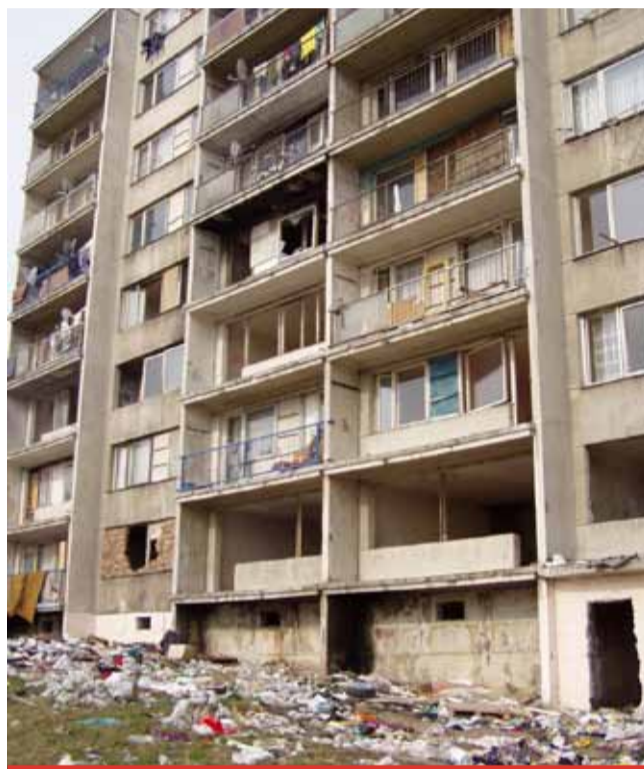
Dotace je určena pro obce, města a kraje, kteří bojují s objekty dříve využívanými k bydlení a které nyní ohrožují okolí.

Žádosti se přijímají od 30. 10. 2020 do 15. 1. 2021 do 12 hod. Nově pouze prostřednictvím datové schránky ministerstva. Celková administrace bude poprvé kompletně elektronická.