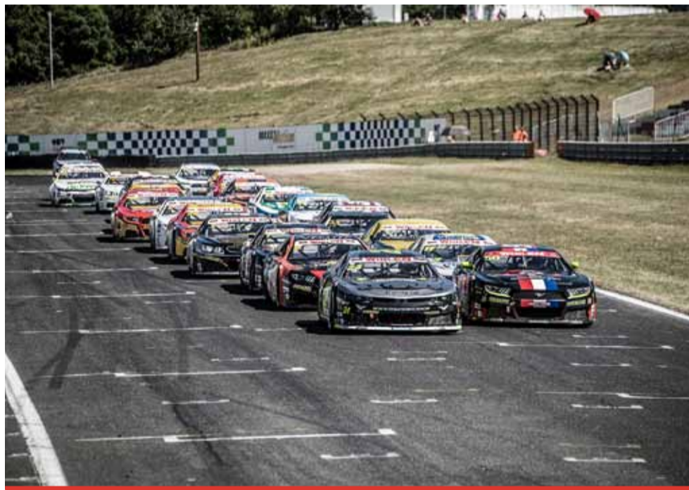
Všechny dosud prodané vstupenky na listopadový závodní víkend v Mostě zůstávají v platnosti pro příští rok, přesný termín pořadatelé zveřejní s dostatečným předstihem.

Ze stejných důvodů už pořadatelé museli zrušit původní červnový termín mosteckého závodu evropské série NASCAR. O soubor je na dráze o víkendu 14. a 15. listopa-