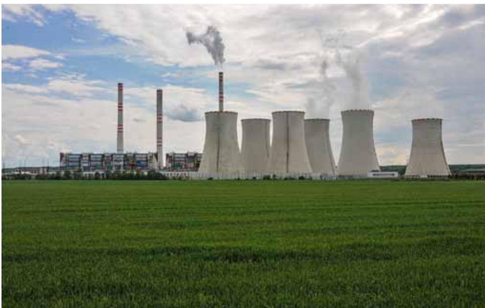
Naposledy byla elektrárna modernizována a zbavována emisí oxidů síry v letech 1994 až 2000, emisí oxidu dusíku v letech 2014 až 2015. Díky odsířovací lince produkuje elektrárna mimo jiné surovinu, ze které se vyrábí stavební hmoty a sádkokartonové desky.