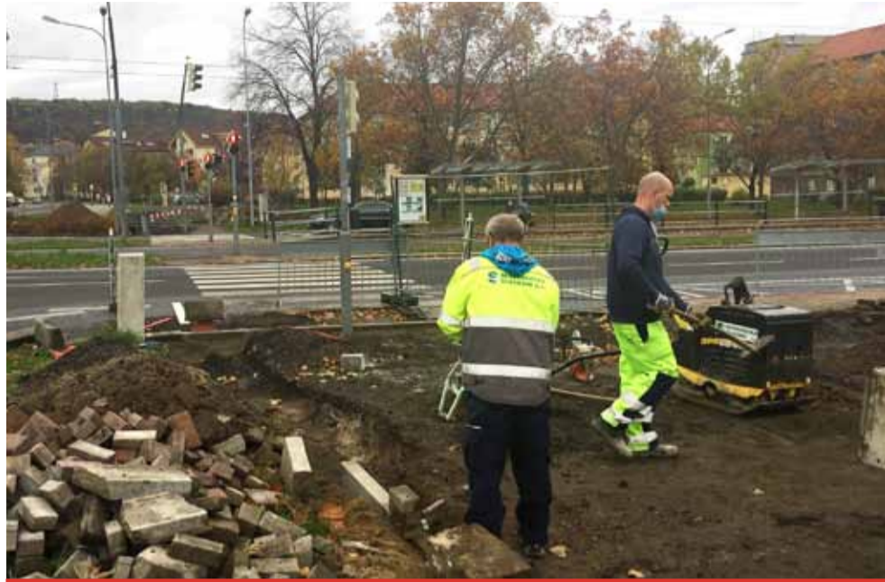
Za nefunkčnost světelné křižovatky nemohl zhotovitel, ale zloději, kteří v noci ukradli kompletní kabeláž k semaforům.

Vypnutí semaforů na zmiňované křižovatce trvalo dlouhé týdny. „Důvodem byly výkopové práce, které se tu provádějí,“ uvedla mluvčí mosteckého magistrátu Klára Vydrová. Severočeská vodárenská společnost v této lokalitě provádí rekonstrukci vodovodních řadů pro zhruba pět set napojených obyvatel. Vodovodní řady jsou z různého materiálu a různě staré. Jednak se tudy vede ocelový vodovod z roku 1968 a jedná se o páteřní řad, který pokračuje směrem na Bílinu. V dalších úsecích je potrubí z litiny, které je v provozu od roku 1952 a 1971. Vodovodní řady byly už značně poruchové, a proto se rozhodla Severočeská vodárenská společnost, že je zrekonstruuje. „Práce na rekonstrukci páteřního vodovodního přivaděče probíhají od dubna bez jediného přerušení, a to i v souvislosti s nouzovým stavem, ať již jarním nebo současným. Zhotovitel se předzásobil materiálem potrubí a po celou dobu výstavby bylo pokládáno plynule,“ odmítl prodlevy při rekonstrukčních pracích mluvčí Severočeské vodárenské společnosti Jiří Hladík. Připomněl, že vzhledem k to-