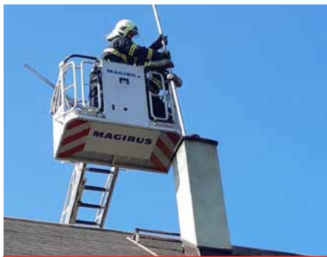
Pro revizi spalínové cesty si ověřte, že si domů zvine odborník – pomůže vám aplikace: www.aplikace.hzscr.cz/revizni-technik-spalinovych-cest/ .