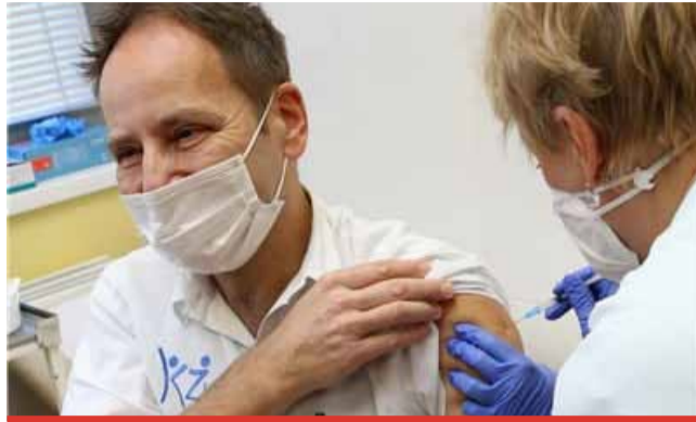
Zdravotníci, kteří se do očkovaní zapojili, byli již naočkováni druhou dávkou. Pokračuje se v očkování seniorů v kategorii 80+ a také obyvatel a zaměstnanců domovů pro seniory v kraji.

Vedení Ústeckého kraje a Krajské zdravotní také posiluje mobilní očkovací týmy. Aktuálně jsou k dispozici čtyři – dva v rámci Masarykovy nemocnice v Ústí nad Labem a po jednom v nemocnicích v Mostě a v Kadani. Mobilní očkovací týmy se nyní využívají primárně pro potřeby očkovaní v domovech seniorů. „Právě očkování stále vnímáme jako tu správnou cestu, jak se vrátit k normálnímu životu. Ze stra-