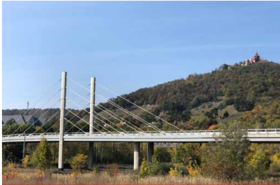
Most k jezeru se uchází o titul „Mostní dílo roku v kategorii Novostavba“. Nominace budou slavnostně vyhlášeny na začátku září v Dopravní hale Národního technického muzea v Praze. Slavnostní vyhlášení proběhne v říjnu v Betlémské kapli v Praze, včetně prezentace a představení oceněných netradiční formou, prostřednictvím unikátních filmových dokumentů.

Porota uděluje zpravidla podle počtu přihlášených 15 nominací na titul Stavba roku