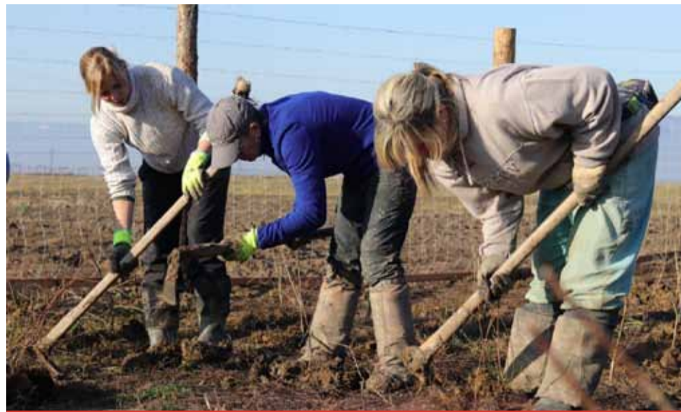
Těžební společnosti skupiny Sev.en Energy v loňském roce společně vysadily bezmála třístatisový nový les.