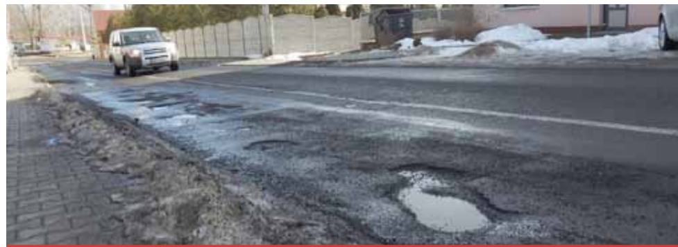
Některé objízdné trasy jsou pro řidiče doslova noční můrou. Zejména „dřevá“ ulice Ruská v části ke křižovatce „na východě“.

Na provizorní opravu muselo město sehnat firmu se speciální strojovou technikou, kterou