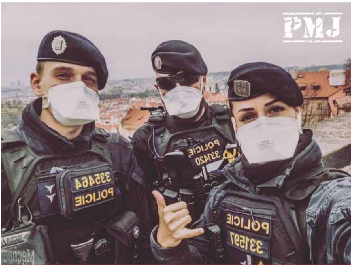
Policie v Ústeckém kraji se potýká s nedostatkem policistů. Spustila proto náborovou kampaň, kde nabízí i vysoký nástupní příspěvek.

PRO AKTUÁLNÍ ZPRAVODAJSTVÍ SLEDUJTE WWW.HOMERLIVE.CZ