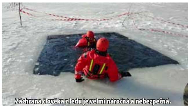
Záchrana člověka z ledu je velmi náročná a nebezpečná.

Sotva z vodních nádrží zmizeli kvůli oteplení a hrozícímu nebezpečí bruslaři, vystřídali je dobrovolní hasiči. Jednotka z Litvínova trénovala na Novém Záluží. Hasiči procvičovali hlavně záchranu osoby z ledu. Na zamrzlé vodní ploše Nové vody v Novém Záluží si vyzkoušeli několik základních postupů jak zachránit osobu, která se propadla ledem do chladné vody. Mezi ně patří například záchrana za pomoci žebříku nebo páteřové desky. (nov)