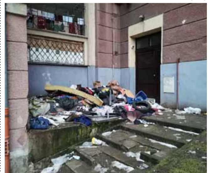
Že vám snímek číslo 1 cosi připomíná? Pak vězte, že skutečně nebyl pořízen v Chanově, ale u bloku 92 v Mostě.

MOST - Nepořádek všeho druhu včetně výkalů. Taková je častá realita kolem pověstných stavek na třídě Budovatelů. O situaci na snímku číslo 1 se postarali svérázní obyvatelé, o stav na snímku číslo 2 se na žádost lidí, kteří chtějí jen to jediné, a to ve svých domovech slušně žít, promptně postarali zaměstnanci Technických služeb města Mostu. (nov)