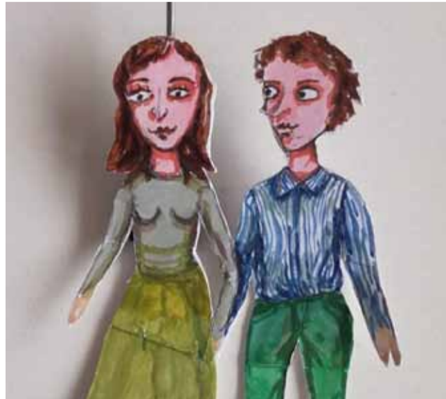
Kromě divadelní inscenace pohádky Takt a Tón se chystá i její interaktivní filmová verze, která bude dostupná online.

Kromě nových inscenací připravuje „Rozmáňo“ sérii „Rozmanitých kabaretů“, které se budou od půlky února vysílat každou sobotu na Facebooku a Instagramu. „Společně s herci si děti připomenou písničky a pohádky z představení, trochu si zacvičí a možná se podívají i do divadelního zákulisí. To vše v zábavně kabaretní podobě!“ dodala Lenka Krestová. (nov)