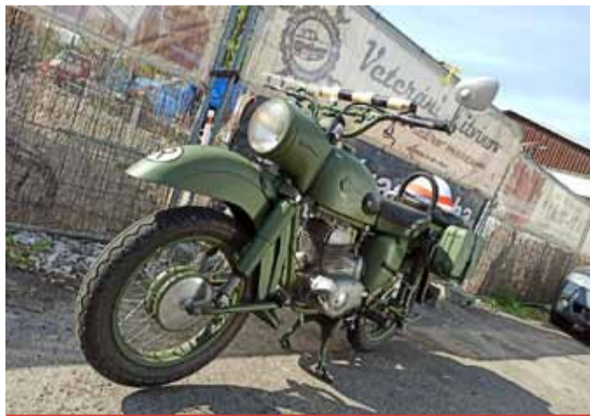
Litvínovští veteráni jsou připraveni otevřít. Zbývá jen rozvolnit!

Bohužel nejen covid, ale i zima brzdí dodělaní úprav muzea a selského dvorku v letošním roce. Bohužel, i ptačí chřipka, která se objevila v Čechách, brání návštěvám a také rekonstrukci nádraží. Veškeré ptactvo musí být totiž do odvolání uzavřeno. (nov)