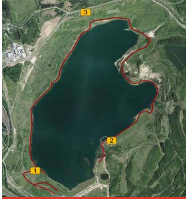
V letošní sezóně se pro návštěvníky jezera Most chystají novinky. Do sezóny se mohou zapojit i poskytovatelé služeb, které nyní vyzývá správce jezera, Palivový kombinát, k podání nabídek.

Písemné nabídky můžete posílat do 12. 3. 2021 do 23.59 hodin. Veškeré informace najdete na www.pku.cz . Hodnotit se bude především rozsah, zaměření, kvalita a atraktivita nabízených služeb, popř. doplňkových služeb a dalších doprovodných akcí, a rovněž i to, zda půjde o službu na celou sezónu, či jen o víkendech (pevná otevírací doba apod.). Větší šanci mají nabídky ohleduplnější k životnímu prostředí (například využívání vratných obalů na nápoje). (nov)