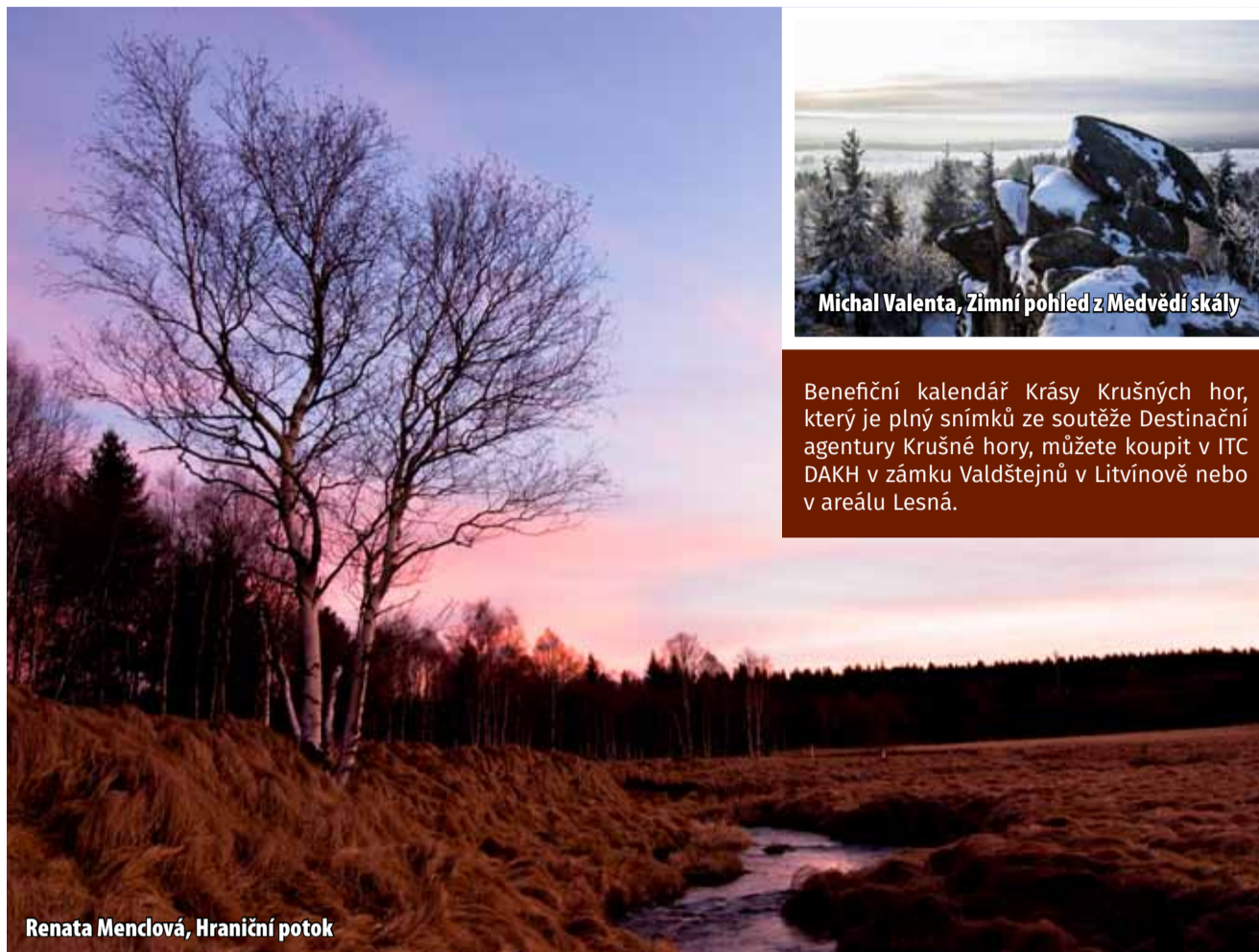
Renata Mendová, Hraniční potok

Podmínky účasti v soutěži: Zasláním fotografie či videa do soutěže účastník potvrzuje, že je autorem dodané fotografie či videa, že tento materiál je původní a nejedná se o fotomontáž (povolena je pouze minimální úprava barevnosti a jemné doostření); Zasláním fotografií či videí do soutěže se autor fotografií vzdává svých autorských práv a Destinační agentura Krušné hory o.p.s. s nimi může dále nakládat a používat je pro prezentaci Krušných hor v elektronické i tištěné podobě (ink)