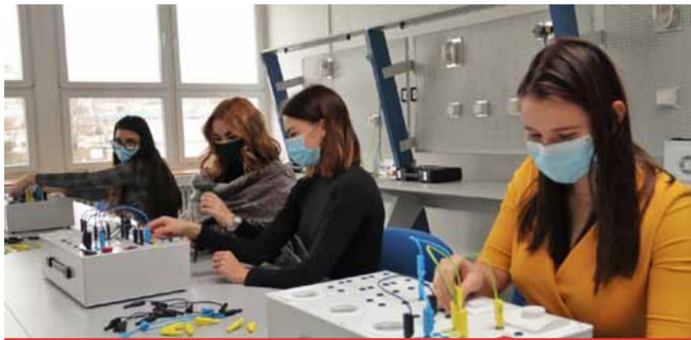
Za vybudováním nové učebny od Vršanské uhelné stojí čtvrt roku intenzivní práce, kdy pomáhali i žáci a studenti školy pod dohledem mistrů odborného výcviku.

Za vybudováním nové učebny stojí čtvrt roku intenzivní práce, kdy pomáhali i žáci a studenti školy pod dohledem mistrů odborného výcviku.