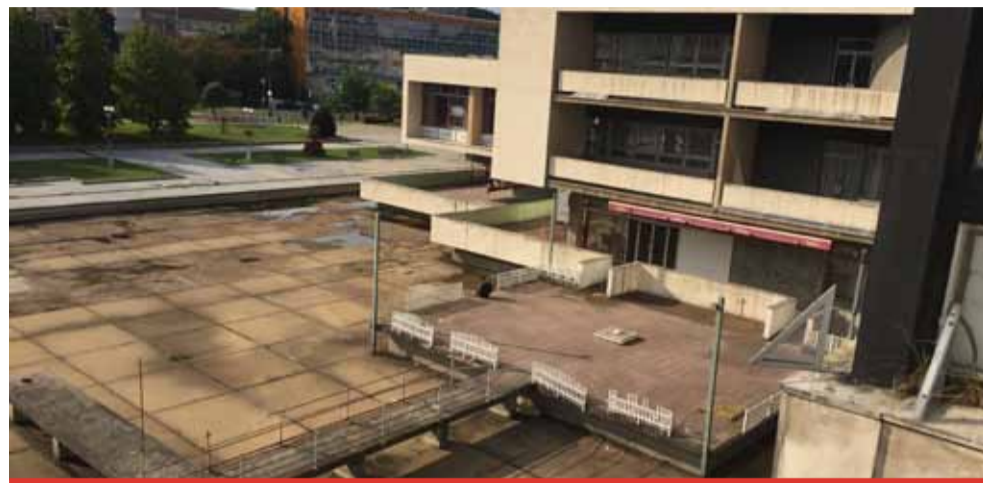
Mezi TOP investicemi roku 2021 je rekonstrukce kulturního domu Repre.