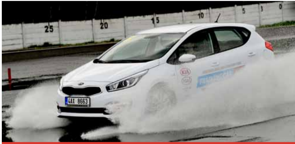
Kurzy bezpečné jízdy se na autodromu mohou nadále konat. Autodrom je totiž zorganizuje tak, aby vyhovovaly vládnímu nařízení.