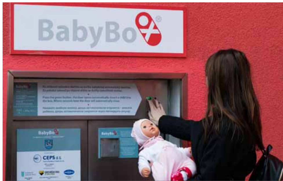
Krajská zdravotní má babyboxy ve všech svých nemocnicích

Po celé republice je rozmístěno celkem 78 babyboxů. Do nich bylo během 15 let jejich existence odloženo 212 dětí. Krajská zdravotní má babyboxy ve všech svých nemocnicích. V Mostě schránka zachránila čtyři děvčátka a jednoho