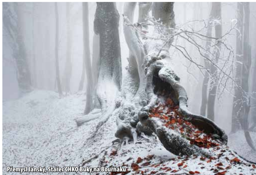
Přemysl Jánský, Stařec CHKO Buky na Bouřňáku