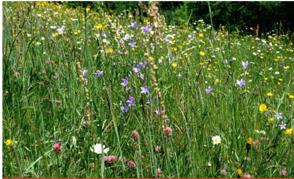
Pro letošní rok se skupina Sev.en Energy spojila s Mezibořím, jehož obyvatelé dostali motýlí louku od těžařů darem jako první.

Lučním květům trvá i dvě sezóny, než se spojí v dokonalou louku. Chce to velkou dávku trpělivosti. „Nově zakláda-