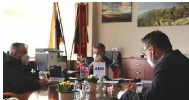
Hejtman s lesáky probral řadu témat.