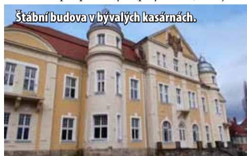
Štábní budova v bývalých kasárnách.

Město Most navrhuje z pěti žadatelů podpořit čtyři (pátý si nezajistil včas všechna povolení). Svůj návrh nyní odeslalo ministerstvu, které o přidělení dotace rozhodne. Mezi žadatele by mělo být letos rozděleno 460 tisíc korun. „Město navrhlo ministerstvu k podpoře re-