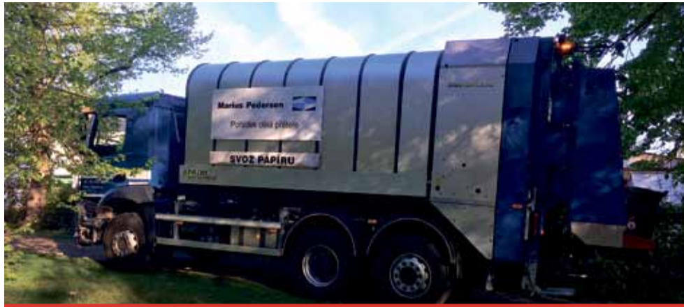
Město odpady nezdraží ani přesto, že za svoz doplácí mnohem více v přepočtu na obyvatele.

Za sběr a svoz netříděného komunálního odpadu město zaplatilo za uplynulý rok přes 13,6 mil. Kč. Jedná se o skutečně vynaložené náklady, které v přepočtu na jednoho poplatníka za svoz tohoto odpadu činily 553 Kč. Poplatek byl stanoven stejně jako vloni na 250 Kč pro každého obyvatele Litvínova. Město tedy doplácelo za každého občana částku přesahující samotný poplatek. Náklady jsou ve skutečnosti mnohem větší, protože se nepočítá se svozem tříděného odpadu