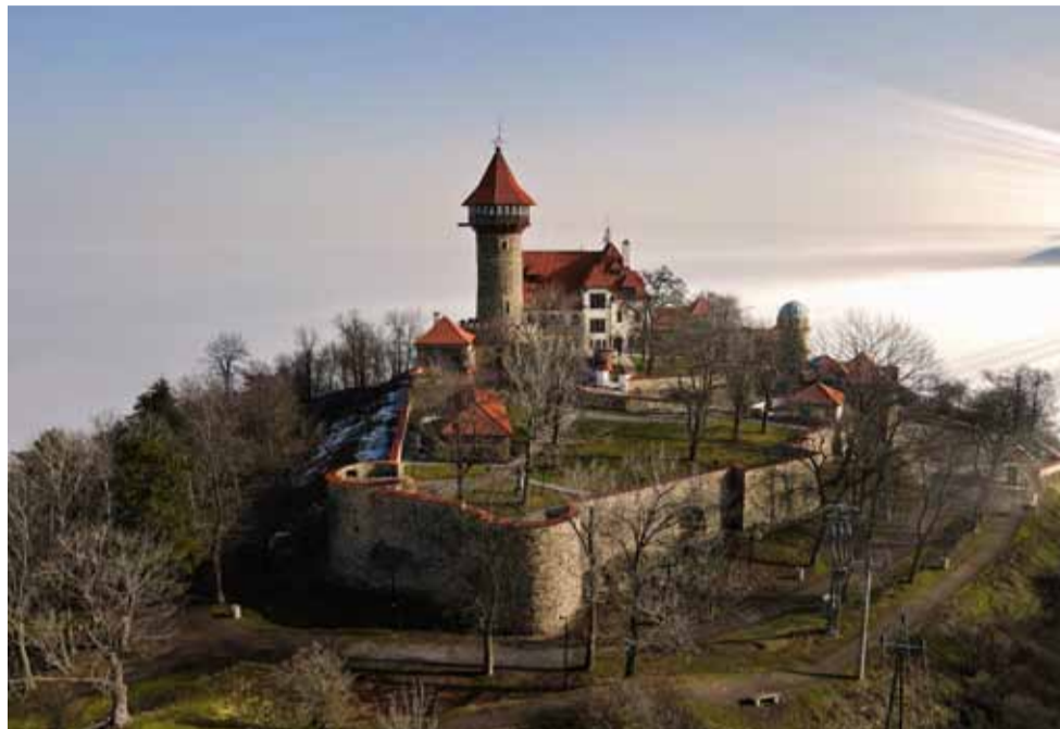
Ačkoliv na hradě Hněvín se stále pracuje, veřejnosti je přístupný. Nefunguje pouze restaurace a hotel. Možné se bude občerstvit pouze ve zdejších stánku.

V letošní sezoně se budou muset návštěvníci smířit i s tím, že si na hradě jídlo a posezení nevyčutají. Město totiž pro zdejší restauraci a hotel hledá nové nájemce. „V plánu máme zrekonstruovat prostory restaurace a kuchyně hradu, aby v příštím roce mohly restaurace a hotel fungovat,“ prozradil Marek Hrvol. Zároveň ujistil, že návštěvníci hradu se budou moci občerstvit. Stánek včetně toalet budou funkční. „Návštěvníci budou mít možnost se občerstvit. Chceme provozovat kiosk, který je v areálu hradu Hněvín a který