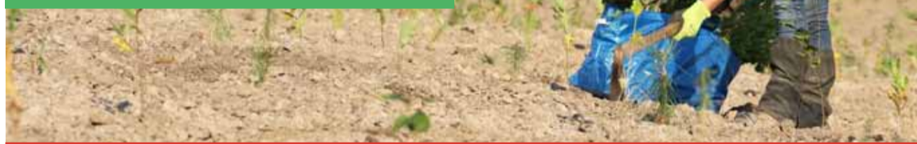
Rozsáhlý biotop Triangl, který vytvořila kladenská teplárna, je oceňovaný nejen veřejností, ale i odborníky. Pozemek o rozloze přesahující 4 hektary, který byl dříve využíván jako sklad sutí a stavebního odpadu, se nyní se stal domovem pro řadu vzácných živočichů a rostlin.

Společnost investuje miliardy korun do modernizace uhelných elektráren, a realizuje tak největší současně ekologické investice v ČR. Sev.en Energy dále spolupracuje s vědeckými institucemi a odborníky, připravuje inovativní řešení pro českou energetiku a také financuje řadu významných projektů v oblasti ochrany životního prostředí.