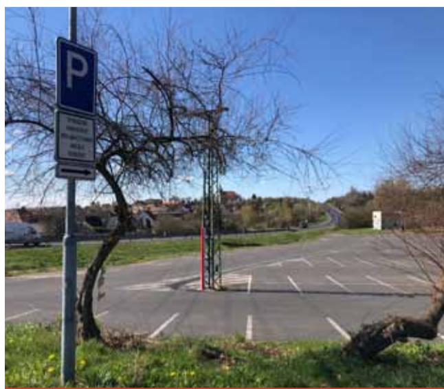
Autobazar uvolnil místo motorizovaným návštěvníkům Benediktu. Velkokapacitní parkování je zdarma, uvnitř areálu už parkovat nebude možné.