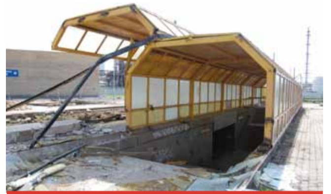
Téměř historické zastávky nahradí nové.