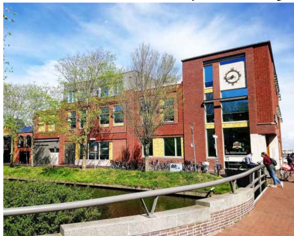
Knihovna v Ústí nad Labem se postupně proměňuje v moderní kulturně-vzdělávací a komunitní centrum pro všechny skupiny obyvatelstva.

Na úpravě místností knihovna po konzultaci se zřizovatelem pracovala v době, kdy musela být z důvodu nepříznivé pandemické situace uzavřena. „Vzhledem k faktu, že jsme spoustu potřebného technického vybavení pro vybudování dílen a studia již měli v inventáři dí-