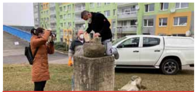
Socha Dary přírody rovněž utrpěla rukou vandala.

sloužil umělec Václav Kyselka. „Sochu v sídlišti v sedmistovkách, konkrétně u bloku 705, pravděpodobně poničili vandalové. Trup sochy se ulomil a po pádu se k rozlomil na další části,“ popsala Alena Sedláčková. Sám sochař, který bude pracovat na opravě, se přiklání k tomu, že na sochu musel někdo vylézt, a tím došlo k jejímu zřícení. „Socha byla sice v plánu oprav pro letošní rok, ale klidně tam mohla stát ještě další měsíce,“ podotkla Alena Sedláčková. (sol)