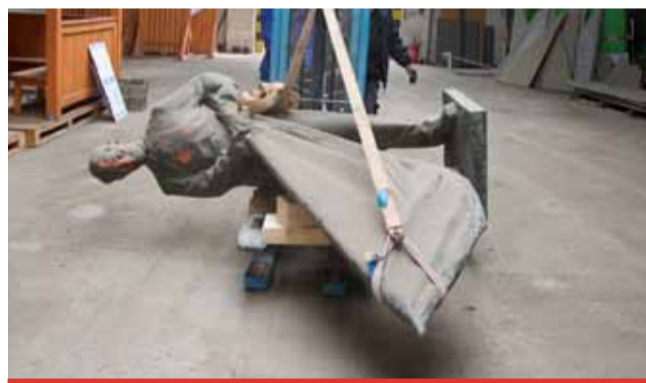
Socha horníka z památníku obětem 2. světové války, kterou se kdosi pokusil ukrást, byla schovaná od roku 1996 v depu Technických služeb města Mostu.