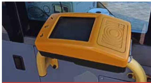
Stávající odbavovací systém na čipové karty je sedmáct let starý. Most byl tehdy mezi prvními městy, která cestování v MHD s „čipovkou“ zavedla.

Největším úskalím bude přechod ze starého na nový odbavovací systém. Souběžně bude