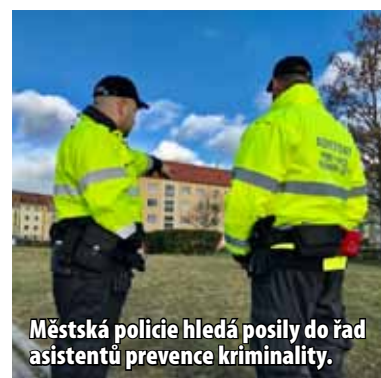
Městská policie hledá posily do řad asistentů prevence kriminality.