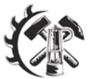
PODKRUŠNOHORSKÉ TECHNICKÉ MUZEUM

Muzeum již ale přijímá rezervace pro návštěvy skupin nejen na letní měsíce. V případě zájmu volejte na telefonní číslo 601 338 197 (pondělí-pátek 8-15 hodin) nebo pište na e-mail dernerovahanka@gmail.com . Kalendář se muzeu již plní, tak neváhejte! Muzeum se zabývá historií hlubinného i povrchového dobývání a zpracování uhlí. K vidění je simulovaná hlubinná uhelná štola, expozice rudného dobývání, mechanické stroje, ale také jeden z nejstarších parních strojů. (nov)