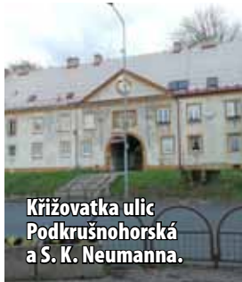
Křižovatka ulic Podkrušnohorská a S. K. Neumanna.