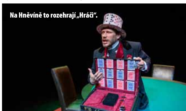
Na Hněvině to rozehrají „Hráči“.

Vstupenky na Divadelní léto na Hněvině je možné rezervovat online. Platba je možná poukázáním v hotovosti v divadelní pokladně. K návštěvě představení je nutné dodržet jedno z následujících opatření: 14 dní od ukončení očkování, do 90 dní od proděláním onemocnění COVID 19, Negativní POC antigen test ne starší než 72 hod nebo negativní PCR test ne starší 7 dní, u dětí do 6 let není testování požadováno. K ochraně dýchacích cest respirátor. V případě jakýchkoli dotazů kontaktujte obchodní oddělení MDM: 777 313 298, propagace@divadlo-most.cz . (nov)