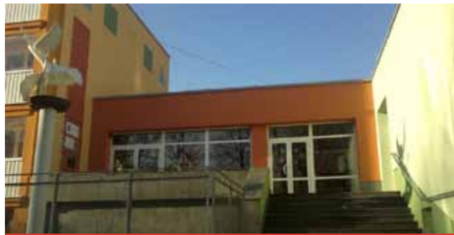
Mostáček sídlí v Dětském domově v ulici K. H. Borovského.