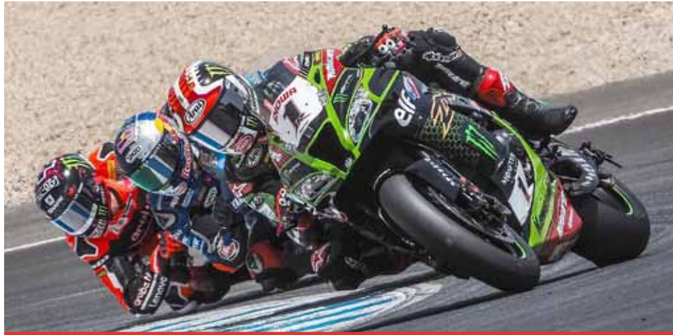
Fanoušci se mohou těšit na souboje elitních jezdců jedné z nejsledovanějších událostí světového motorsportu na mosteckém autodromu až do roku 2025.