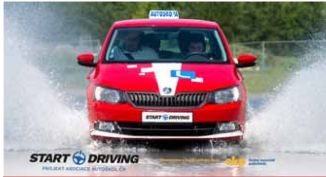
Polygon v Mostě nabízí do konce října pro mladé začínající řidiče ještě sedm dalších termínů. Teoretická výuka i praktický výcvik podléhá přísnému režimu v souladu s vládními opatřeními proti šíření nemoci covid-19.

Projekt se inspiroval rakouským systémem vzdělávání řidičů, finanční podporu poskytu-