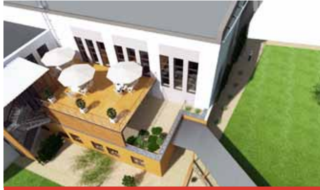
Předpokládaný termín dokončení přístavby Sokolovny je prosinec 2021.

Studenti se mohou těšit nejen na příjemné posezení v nové jí-