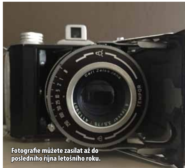
Fotografie můžete zasílat až do posledního října letošního roku.

Fotky musí pocházet z území města Meziboří a blízkého okolí. Cílem je zvětšit Meziboří a blízké okolí v těch nejzajímavějších, ale třeba i naprosto běžných podobách v každém měsíci roku. Každý fotograf tedy zašle 12 fotografií zachycujících