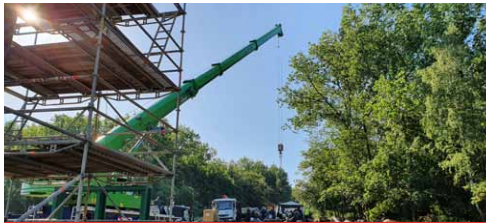
Dlouhé odstávky teplé vody se letos Litvínovští nemusejí obávat.

V Litvínově je v plánu druhá část obnovy hlavního napáječe. Pro obyvatele Litvínova a Janova to znamená dvě kratší, maximálně 3-4denní celoplošné odstávky. Nejzásadnější akcí bude letos pokračování rekonstrukce části tepelného napáječe dlouhého 2 216 metrů do Litvínova. Začne samotným zásahem do potrubí napáječe v červnu. „Abychom nemuseli po dobu prací na tomto horkovodu přerušit dodávky tepla pro odběratele v Litvínově dlouhodobě, bylo vybudováno, stejně jako loni, po celé délce trasy provizorní propojení,“ říká vedoucí útvaru ČZT, společnosti