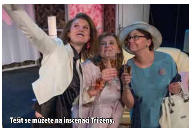
Těšit se můžete na inscenaci Tři ženy .