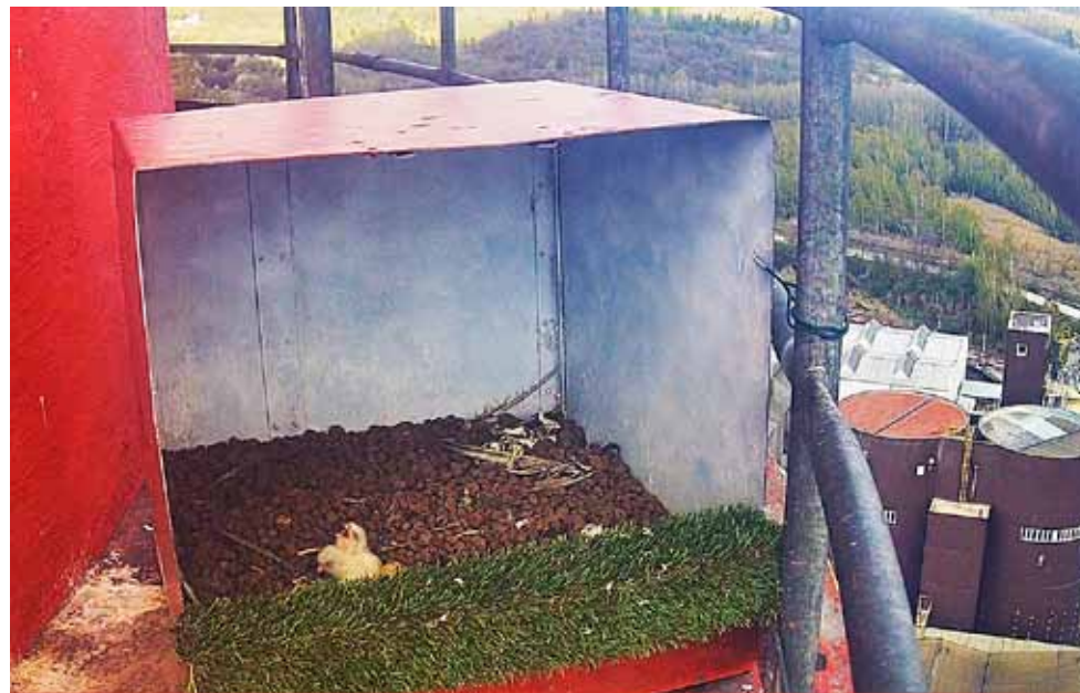
Na komíně v chemickém závodu v Záluží u Litvínova se vylíhla tři mláďata sokola stěhovavého. Zájemci mohou jejich hnízdění sledovat online ze tří kamer na webu www.starameseosokoly.cz . ORLEN Unipetrol spolupracuje na projektu hnízdění sokolů se sdružením ALKA Wildlife již desátým rokem.

„Sokolí jsou součástí litvínovské chemické areálu již od roku 2011. Kromě tohoto závodu si oblíbili také komíny rafinerie v Kralupích nad Vltavou a neratovické Spolany. Právě rozlehlé průmyslové areály jim po-