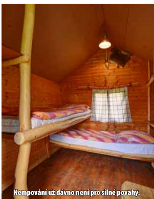
Kempování už dávno není pro silné povahy.