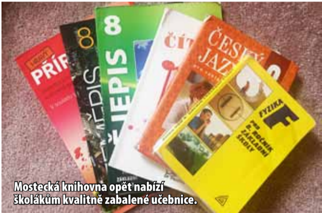
Mostecká knihovna opět nabízí školákům kvalitně zabalené učebnice.

MOST - Městská knihovna Most nabízí školákům balení sešitů a učebnic jen za cenu obalu. Pracovníci knihovny zabalí učebnice i sešity do pevné fólie, na míru a kvalitně. Takový obal žákovi často vydrží celý rok. Školáci můžou přijít kdykoli (nejpozději však hodinu před zavírací dobou). Tato profi služba je na počkání, případně do druhého dne, kdy má knihovna otevřeno. Cena je stejná jako v obchodě za samotný obal. Formát A5 vyjde na 6 korun, obalení A4 stojí 8 korun. Služba se netýká jen učebnic, ale i všech ostatních knížek a sešitů. Obal vydrží dlouho a je kvalitní. Pracovnice knihovny zabalí knihy a sešity všech formátů, včetně atypických. (nov)