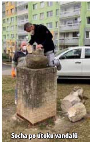
Socha po útoku vandalů