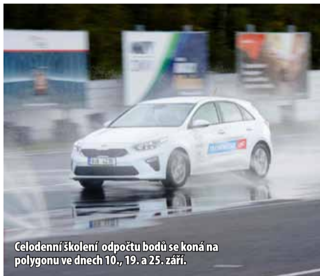
Celodenní školení odpočtu bodů se koná na polygonu ve dnech 10., 19. a 25. září.

Řidiči se školí pod dohledem instruktora bezpečné jízdy vždy od 8 do 15 hodin, absolvují teoretickou výuku a praktický výcvik. Školení zahrnuje teorii řízení, výčet nejčastějších příčin dopravních nehod a způsob jejich předcházení, důsledky protiprávního jednání řidičů motorových vozidel či prevenci řešení mimořádných událostí v silničním provozu. Celodenní školení se koná na polygonu ve dnech 10., 19. a 25. září. (nov)