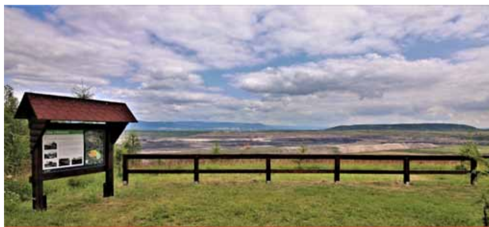
Nová vyhlídka je doplněna informační tabulí s informacemi o lomu Vršany, novými informacemi byly doplněny i tabule vedle rozhledny, kde návštěvníci najdou například zajímavosti o flóře a fauně, která se v okolí Vršan vyskytuje.

Nová vyhlídka na lom Vršany vybudovala společnost Rekultivace ze skupiny Sev.en Energy v bezprostřední blízkosti turisticky oblíbené a vyhledávané rozhledny Maják ve Strupčicích. Vidět je odtud jak aktivní lom, tak probíhající i již dokončené rekultivace v okolí. „Novou vyhlídku jsme na tomto místě nechali ve spolupráci s obcí vybudovat zcela záměrně. Jednak nahrazuje vyhlídku, která byla ještě donedávna umístěna u silnice mezi Bylany a Komořany. Silnice ale byla s ohledem na plánované pokračování těžby v lomu Vršany uzavřena a veřejnosti je tak už nyní nepřístupná i vyhlíd-