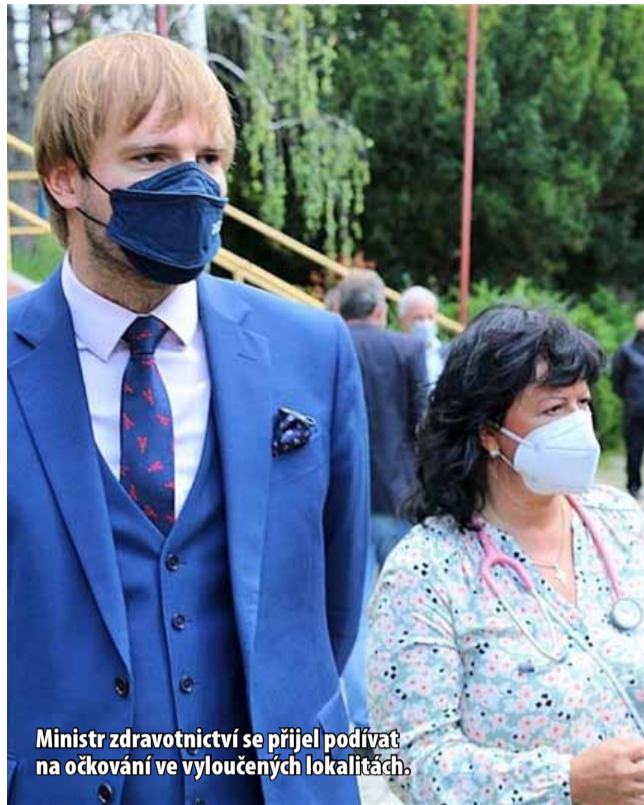
Ministr zdravotnictví se přijel podívat na očkování ve vyloučených lokalitách.

nově před hlavní vchod zdejší základní školy. Očkování měly možnost podstoupit za přítomnosti pediatra i děti starší 12 let. Další mobilní tým Krajské zdravotní očkoval zájemce starší 16 let v Děčíně - Boleticích nad Labem. Mobilní očkovací tým Krajské zdravotní se základnou v Masarykově nemocnici v Ústí nad Labem vyjel už dvakrát do vyloučené lokality sídliště Mojžíř v ústeckém obvodu Neštěmice a mobilní očkovací tým mostecké nemocnice rovněž dvakrát, a to na sídlišťě Chanov u Mostu. Celkem při dosavadních čtyřech výjezdech jednodávkovou vakcínu přijalo 275 osob. (nov)