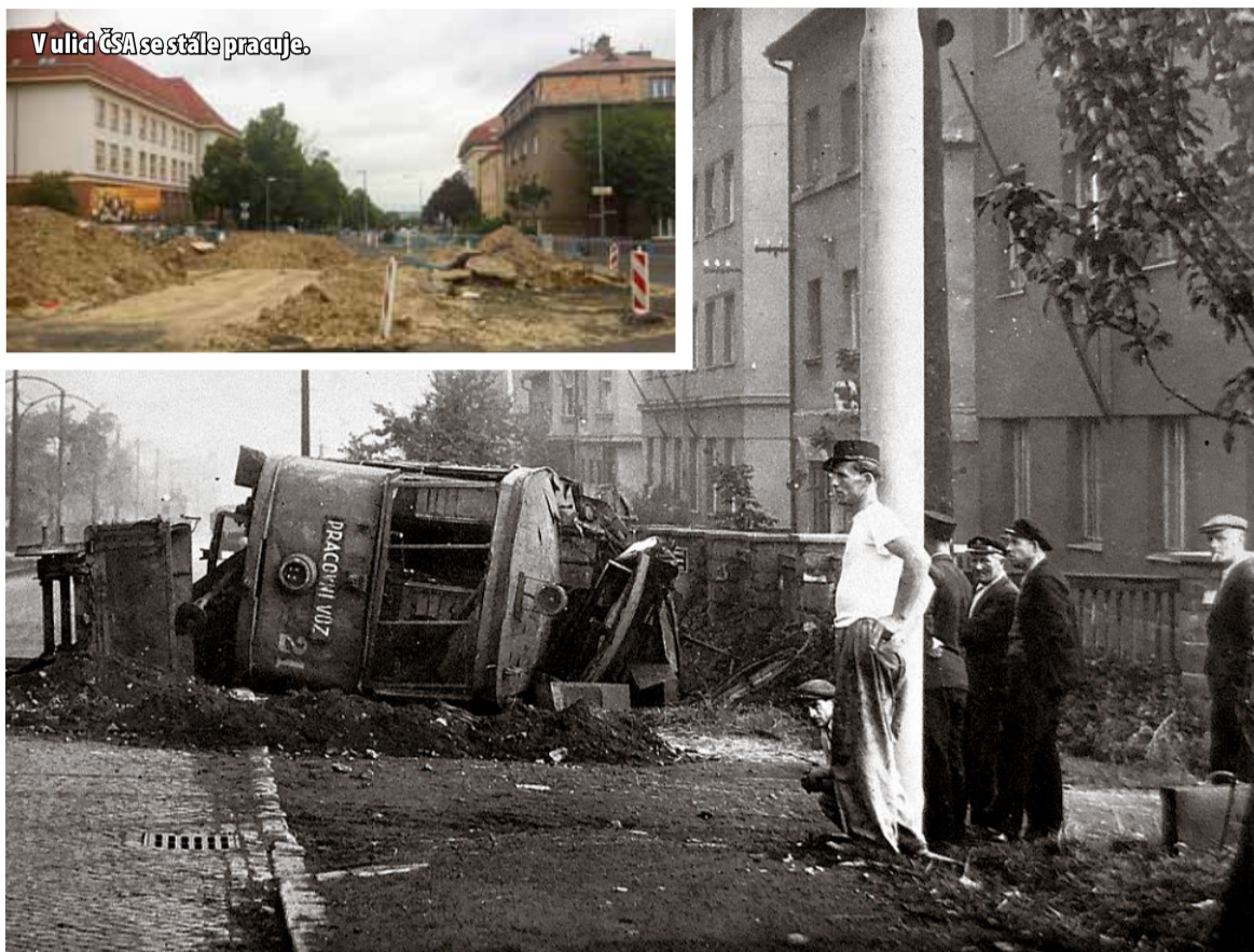
Tramvajová trať, na jejíž pozůstatky pracovníci při opravě ulice ČSA narazili, vedla ze Zahrazen a odbočovala úzkokolejkou právě do ulice u gymnázia. Trať se ale ukázala být nebezpečná. V roce 1949 zde došlo k havárii pracovního vozu. Později, v roce 1960, tramvaj vykolejila znovu a převrátila ve stejném místě. Tentokrát ovšem s tragickými následky. Vezla totiž cestující.

PRO AKTUÁLNÍ ZPRAVODAJSTVÍ SLEDUJTE WWW.HOMERLIVE.CZ