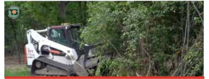
Poslední větší úpravy v parku se prováděly zhruba před osmi lety, kdy se prořezávaly stromy, likvidovaly nálety a kácely se staré a nemocné dřeviny, například topoly. Za téměř deset let ale park znovu zarostl. Technické služby začaly s jeho intenzivní úpravou a revitalizací již v minulém roce.

Hrabák je rozlohou velký, a proto se musely práce rozdělit do několika etap. Většina se prováděla ručně a byla fyzicky náročná. Pracovníci technických služeb si na pomoc vzali křovinořezy, motorové pily a multifunkční robogreen, dálkově řízený stroj, který dokáže pracovat až s 23 druhy nářadí. Po úpravách je park více vzdušný. V budoucnu bude nabízet místo pro odpočinek a například i pro sportovní vyžití. „Letos jsme měli v plánu upravit plochu 30 000