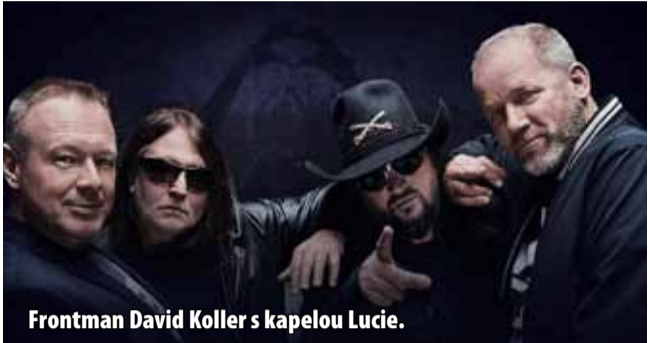
Frontman David Koller s kapelou Lucie.

Nespočet hudebních cen Anděl včetně ocenění za skupinu dvacetiletí, čtyři sošky Českého slavíka a přes milion prodaných desek. To je stručný souhrn úspěchů lemujících dnes již více než třicetiletou kariéru skupiny Lucie, která vystoupí v Třebívlicích v podmanivých kulisách Zámeckého vinařství Johann W. Výjimečná atmosféra vinného hradu, prvotřídní víno a v neposlední řadě koncert skupiny Lucie plný jejích hitů – to je silná trojkombinace. Vstupenky jsou v prodeji na www.xticket.cz a kapacita je omezená! (nov)