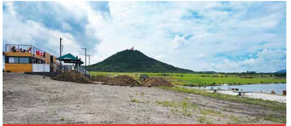
Navezená zemina, smíchaná s pískem bude sloužit jako podklad pro nové travní koberce. Ty budou technické služby pokládat v následujících čtrnácti dnech. Plocha pro relaxaci a opalování se tak zase o pěkný kus rozšíří.