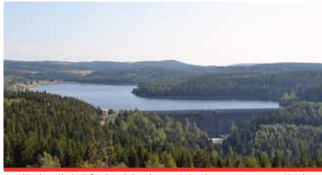
Vidět do „zákulisi“ flájské přehrady se stává jednou za čas. Je to zážitek.

Přehrada byla postavena v letech 1951–1964. Stavbu vyprojektoval Hydroprojekt Praha, dodavatelem stavby byly Vodní stavby Sezimovo Ústí. Do provozu byla uvedena v roce 1960. K dopravě materiálu byla využita Moldavská horská dráha, od