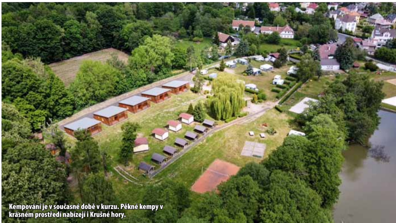
Kempování je v současné době v kurzu. Pěkné kempy v krásném prostředí nabízejí i Krušné hory.