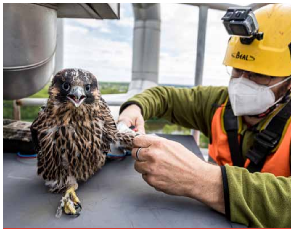
Mláďata, která se vylíhla v Unipetrolu, poslali rodiče v červenci na zkušenou do světa, kde po třech letech začnou sama s hnízděním. Na snímku probíhá kroužkování.

Výrobní areál Chempark v Záluží u Litvínova se mohl letos pochlubit rovnou pěti mláďaty sokolů stěhovavých. Na tamních komínkách hnízdily dva páry, což řadí chemičku k unikátním místům v Česku na ornitologické mapě, protože tak blízko vedle sebe sokolí většínou nehnízdí. Na komíně tepelnárny T700 se vylíhli ve stometrové výšce dvě samičky a jeden sameček a uživatelé Facebooku jim v soutěži nadělili jména Mía, Žofinka a Falco. Sledovat je bylo možné v živém přenosu na webu www.starameosokolky.cz . To hnízdění sokolů v druhé části litvínovského areálu – na etylenové jednotce – bylo dlouhou dobu tajemstvím. Mláďata se vylíhla jako poslední v celé skupině ORLEN Unipetrol. Sokolí rodiče i tady zamýšleli tříčlennou rodinu, protože ornitologové našli v hnízdě budce třetí, neoplozené vejce, ale příroda se zařídila po svém. V červenci rodiče poslali mláďata na zkušenou do světa, kde po třech letech začnou sama s hnízděním.