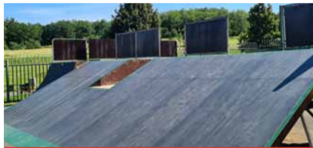
Skatepark na Šibeníku už je opravený a ke spokojenosti jeho návštěvníků v něm přibýly nové atrakce.