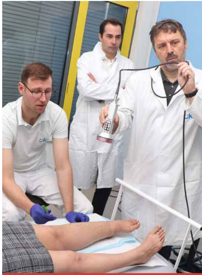
Nový přístup, který zavedla Krajská zdravotní, znamená významný posun v péči o pacienty s lymfédémem a přináší naději na zlepšení kvality života.