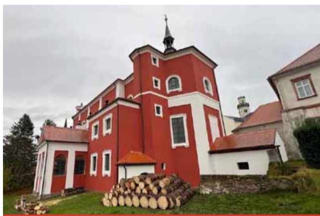
Nová fasáda na kostele Nejsvětější Trojice v Klášterci nad Ohří. Celková cena činila 2,9 mil. Kč včetně DPH. Ústecký kraj přispěl neinvestiční dotací ve výši 1,5 mil. Kč.