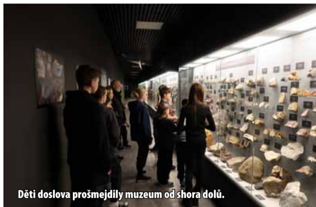
Děti doslova prošmejdily muzeem od shora dolů.

zea, po kterém děti ve skupinách objevovaly muzeum, jeho sbírky a záhady. Kromě prohlídky expozic na ně čekala i dobrodružná stezka plná úkolů, které je dovedly až ke ztracené mostecké mumii. Zlatým hřebem večera byla soutěž o nejlepší mumifikovaného kamaráda. „Naši strážníci se podíleli na organizaci této skvěle vydařené akce. Kolegyně napekly domá-