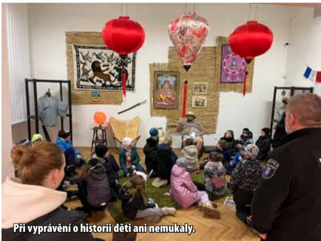
Při vyprávění o historii děti ani nemukaly.

pomenutelnou noc plnou dobrodružství, zábavy i zajímavých informací z útrob muzea. Večer odstartoval krátkým filmem o tajemstvích mosteckého mu-