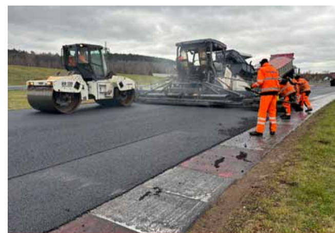
Podstatným vylepšením prochází samotná dráha.

Nové časoměřičské smyčky V průběhu února budou nainstalovány další tři časoměřičské smyčky, které zefektivní kontro-