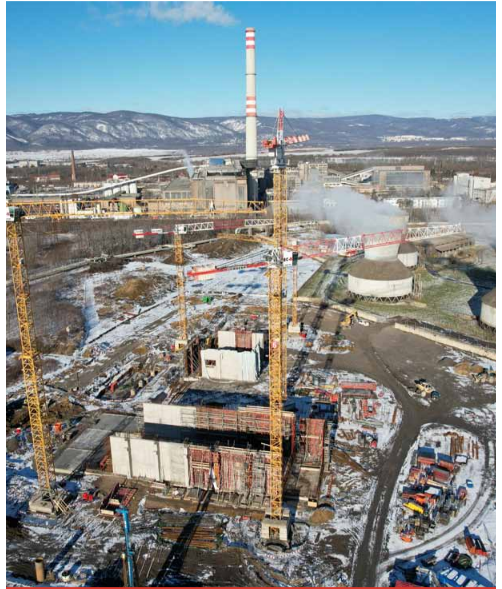
Stavba nového zařízení pro energetické využití odpadu začala vloni v srpnu.

„Odpad je surovina se značným energetickým potenciálem, což v dnešní turbulentní době může znamenat velkou výhodu. Zároveň se jedná o do-