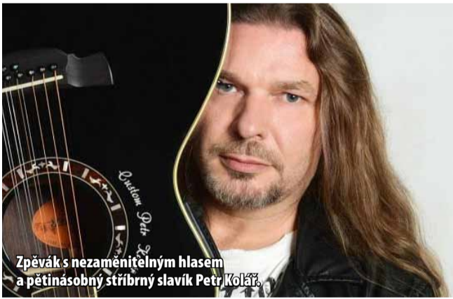
Zpěvák s nezaměnitelným hlasem a pětinasobný stříbrný slavík Petr Kolář

Petr Kolář zazpívá ve vinárně hotelu Cascade v rámci Saturday Nighs od 21 hodin jako hlavní host. Samotný program společenského večera začíná ve 20 hodin a končí v jednu hodinu ráno. Vstupné je 200 Kč k sezení a 150 Kč k stání. Vstupenky jsou k zakoupení v hotelu Cascade. O dostupnosti se můžete informovat na tel. 773 689 056. Společenský oděv je nutný. (nov)