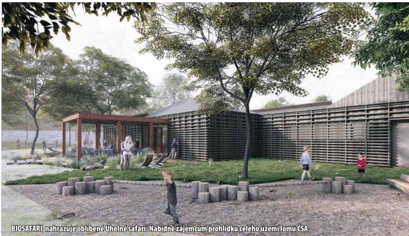
BIOSAFARI nahrazuje oblíbené Uhelné safari. Nabídne zájemcům prohlídku celého území lomu ČSA.

Krajina Krušných hor a podkrušnohorské pánve prošla v posledních 150 letech dramatickou změnou, která ovlivnila životy mnoha lidí a změnila přírodní i kulturní podobu regionu. Dnes je územím ojedinelých přírodních hodnot a obnovující se přírody, obnovovaných kulturních památek a rozvíjejícího se společenského života v obcích. „Základní myšlenkou návrhu stavby Domu přírody je připomínka zaniklé obce Albrechtice. Celý objekt by měl vesnici připomínat. Návrh vychází z důmyslného rozmístění jednotlivých funkčních částí – domů, propojených ulicemi v jeden kompaktní celek,“ uvádí se ve studii, která Dům přírody v Horním Jiřetíně přibližuje. Expozice je rozdělena na vnitřní expozici, vnitřní expozici pro nejmenší a venkovní prvky expozice. Popisovat bude mimo jiné, jak vznikalo hnědé uhlí a co bylo po tom, přírodu Krušných hor, regeneraci krajiny či historii osidlování. Chybět nebudou herní prvky. (ink)