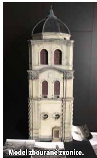
Model zbourané zvonice.

se centrum chystá nyní projekt více zatraktivnit pro mladé lidi. „V rámci expozice si budou moci na dotykové obrazovce zahrát vzdělávací hru s úkoly a dozvědět se o zaniklém městě zajímavosti,“ doplnil Milan Koznar. (nov)