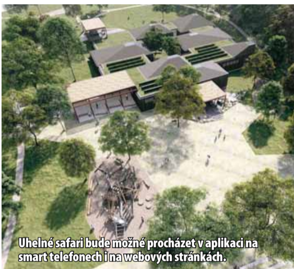
Uhelné safari bude možné procházet v aplikaci na smart telefonech i na webových stránkách.