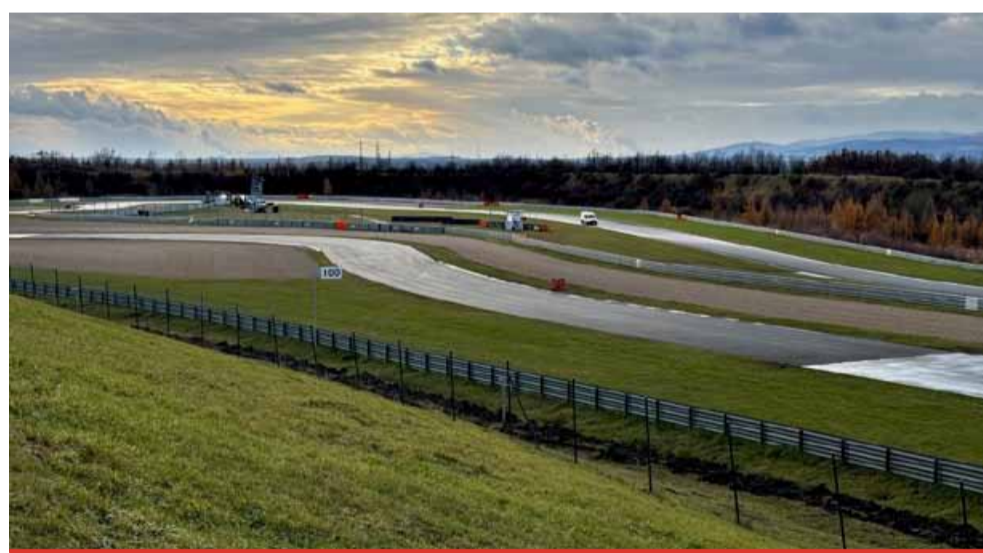
Než odstartuje na mosteckém okruhu první závod, musí se dokončit řada úprav.

Bezpečnostní bariéry - Instalace nových bariér mezi zatáčkami T8 a T12 zlepší bezpečnost a umožní novinářům bezpečný přístup do dosud nepřístupných oblastí. První část od T8 do T11 je již dokončena, montáž druhé části pokračuje. LED panely a modernizace optické sítě - Brzy budou nainstalovány nové LED panely včetně startovacího zařízení a light control system, který umožní informování v reálném čase. Součástí prací byla i rozsáhlá revize a rozšíření optické sítě, která nyní bude sloužit nejen televizním štábům, ale i časomíře a dalším zákazníkům. Systém je on-line připojený ke špa-