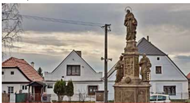
Celková cena za restaurování Mariánského sousoší činilo 840 950 Kč včetně DPH. Dotace z Programu na záchranu a obnovu kulturních památek Ústeckého kraje byla ve výši 174 850 Kč.