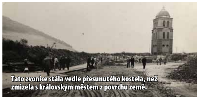
Tato zvonice stála vedle přesunutého kostela, než zmizela s královským městem z povrchu země.