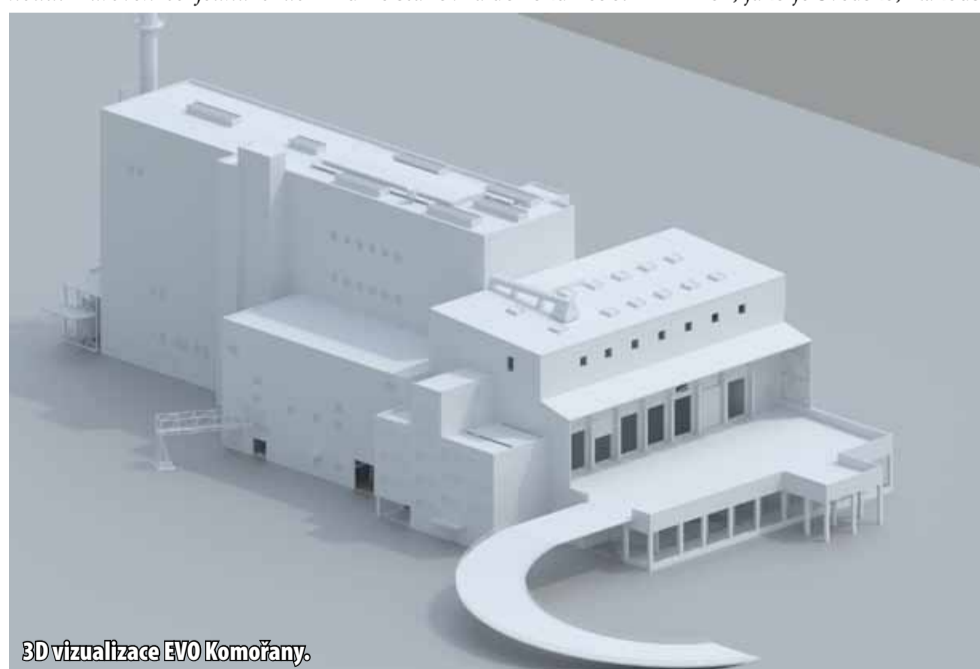
3D vizualizace ZEVO Komořany.

Projekt výstavby nového ZEVO v Komořanech není jen technickou inovací, ale především krokem k lepší budoucnosti pro nás všechny. Jako nedílnou součástí svého dekarbonizačního plánu United Energy tímto projektem dává najevo svůj závazek přispět k čistému životnímu prostředí a poskytnout obyvatelům Ústeckého kraje i celé ČR moderní a udržitelné řešení energetických potřeb. (nov)