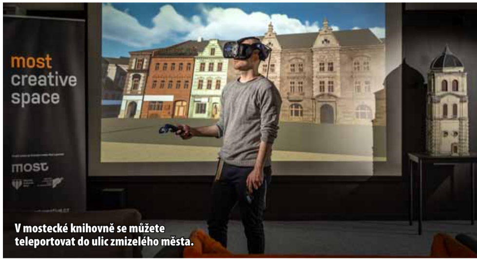
V mostecké knihovně se můžete teleportovat do ulic zmizelého města.

Projekt, který získává na dokonalosti, vzniká za finanční pod-