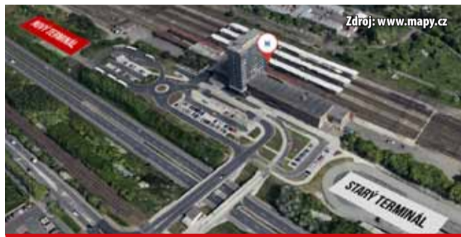
Autobusové nádraží má vyrůst za současnou otočkou autobusů MHD.

Nádraží vznikne v opačné části přednádražních prostor, než je bývalý autobusový terminál. Nádraží původně město chtělo vybudovat zde. „Preferovali jsme variantu vpravo, protože se jednalo o bývalé autobusové nádraží. Bohužel BUSCOM měl nepřiměřené požadavky,“ uvedl primátor. BUSCOM požadoval zhruba 30 mil. Kč. Podle znaleckých posudků byla hodnota pozemků kolem 7 mil. Kč. Nový