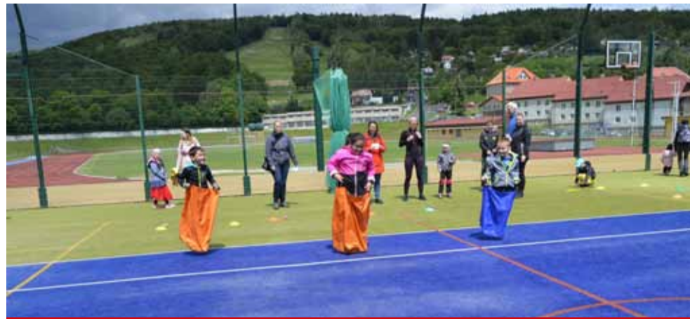
Atletický stadion je zdarma pro veřejnost po celý rok.

V zimním období je hala využita z 90 procent. Po zbytek ro-