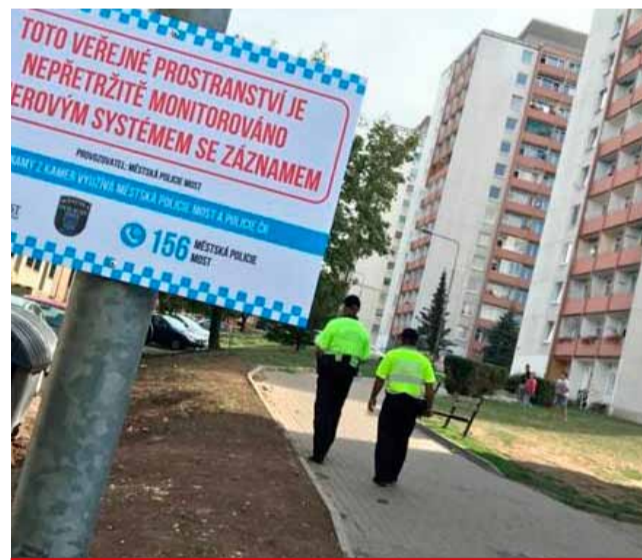
Město budou hlídat další kamery.

mí zejména v sociálně vyloučených lokalitách, vyhledávat protiprávní jednání a informovat o nich operačního pracovníka, potažmo strážníky v terénu. Kamerový systém disponuje v současné době stovkou hlavních kamerových bodů. Operátoři zajišťují nepřetržitý monitoring situace ve městě prostřednictvím městského kamerového dohledového systému. Také reagují na oznámení na linku 156, kdy provádějí monitoring oblasti a informují zasahující strážníky případně další složky IZS o situaci na místě. (nov)