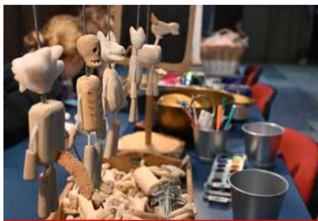
Děti si mohou užít netradiční dílny.

Dílny se konají v předšálí Divadla rozmanitost. Vstupné je 100 Kč za dítě, platí se na místě a v hotovosti. Všechny součástky a potřebnou výbavu budou mít děti k dispozici. Občerstvit se můžete v našem divadelním baru. Pozor, kapacita je omezená! Vstupenky můžete rezervovat na: rozmano@divadlo-most.cz , nebo na tel. čísle 737 270 058. (nov)