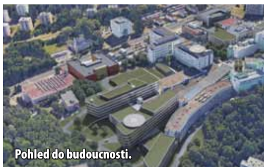
Pohled do budoucnosti.