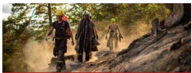
S mohutným požárem bojovali hasiči a záchranáři dlouhých dvacet dní.

Do 12. srpna 2022, kdy byl požár likvidován, se na místě zásahů vystřídalo více jak 6 300 hasičů z řad profesionálních i dobrovolných jednotek a více jak 400 kusů techniky. Plocha, na které proběhl hasební zásah, byla přes 1 100 hektarů. (nov)