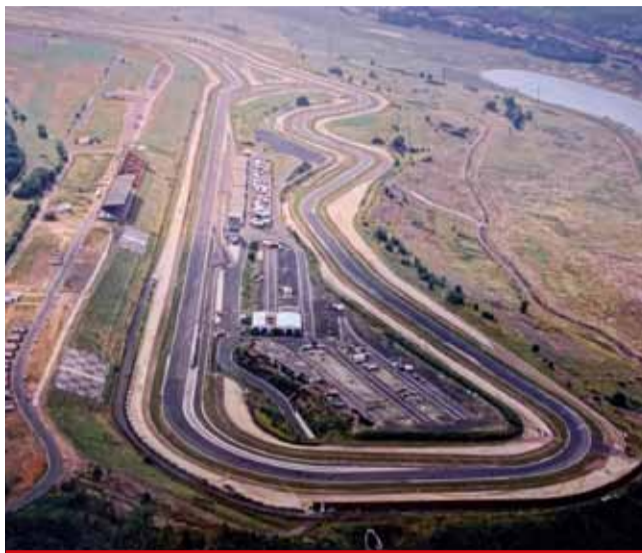
Do Okruhové školy se mohou hlásit zájemci z řad veřejnosti.