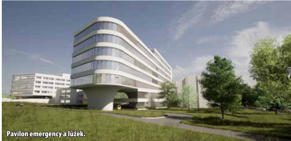
Pavilon emergency a lůžek.

Zpracovatelem generelu Masarykovy nemocnice v Ústí nad Labem je architektonický a projektový ateliér Domy architects. Generel řeší členění areálu, jeho dopravní a technickou infrastrukturu, hlavní vazby na okolí a možnosti expanze. Cílem je zajistit účinnost, hospodárnost a trvalou udržitelnost zdravotního systému. „Jednou z nejdůležitějších částí generelu ústecké nemocnice je návrh nového pavilonu urgentního příjmu. Pavilon nebude obsahovat pouze emergency, ale vytváří prostor také pro jiné obory. Nachází se ve střední