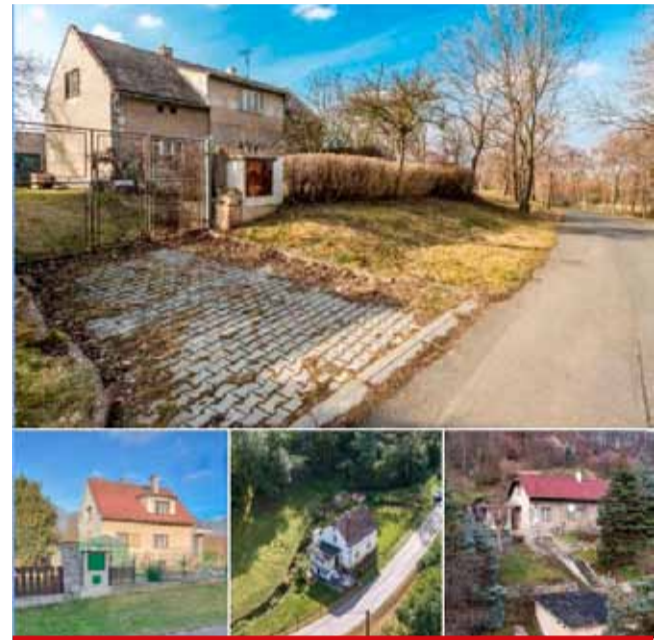
Pro bližší představu jak má dům vypadat.

Mělo by se jednat o dům před rekonstrukcí, postavený v 70. až 90. letech, ne o novostavbu. Dům by měl stát ideálně na kraji vesnice či na samotě, nedaleko lesa. V domě bydlí hlavní hrdinka, s manželem a dítětem obývá horní nedodělané patro, dolní patro obývají tchán s tchýní. Pokud vlastníte/obýváte podobný dům a jste ochotni ho za honorář pronajmout na natáčení, pošlete své tipy na: zapisnikalkoholickyfilm@gmail.com . Poloha: v okrese Louny, okresu Litoměřice, blízko dálnice na Prahu, nebo u hranice se Středočeským krajem výhodou. (nov)