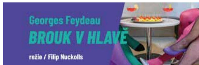
režie / Filip Nuckolls

cí. Jenže v poslední době hodně pracuje, nosí speciální kosmodisk, aby se nehrbil a intimní život mu kazí imaginární celník... Zkrátka co se týká milostných záležitostí, neprožívá právě „zuřivé“ období. Tím však probudí žárlivost ve své manželce Marcelce. Z čeho její podezření vyplývá? To je tak – Viktor, protože poctivě nosí svůj speciální nápravný kosmodisk, daruje starý kosmodisk svému brat-