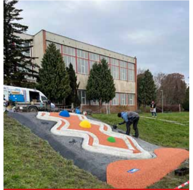
Z participativního rozpočtu se zrealizovala například venkovní kuličková dráha u janovské základní školy.