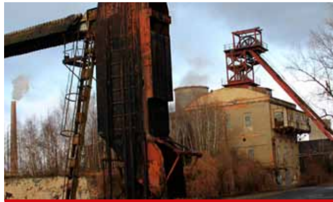
V plánu je i nová zastávka u Podkrušnohorského muzea