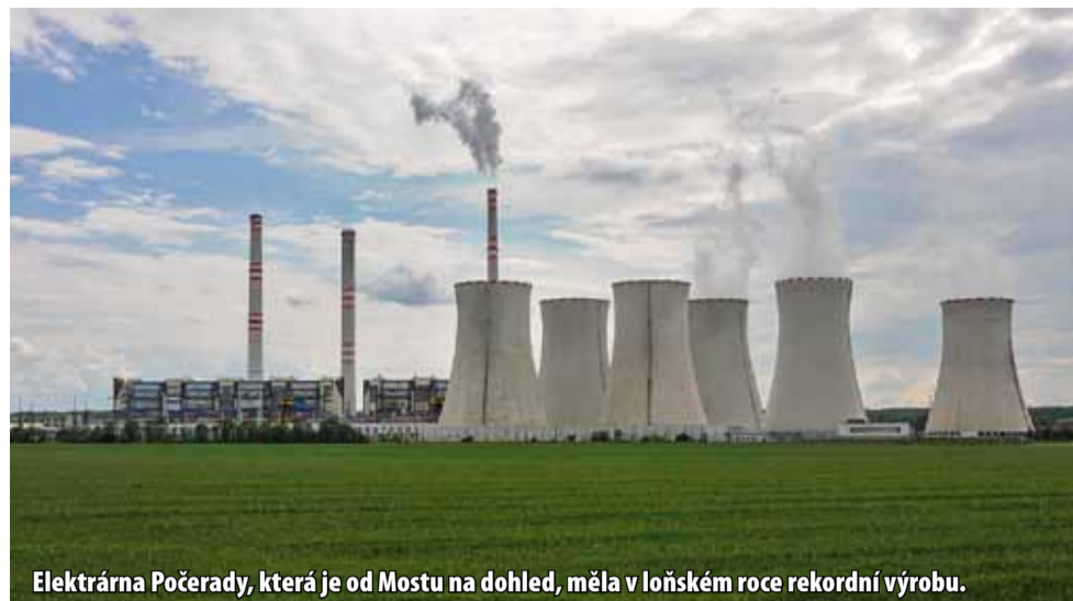
Elektrárna Počeraďy, která je od Mostu na dohled, měla v loňském roce rekordní výrobu.

Výroba i spotřeba elektřiny musí být naprosto vyvážená, musí se spotřebovat takové množství elektřiny, jaké je vy-