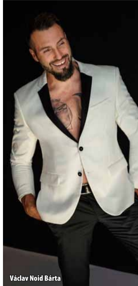
Václav Noid Bárta