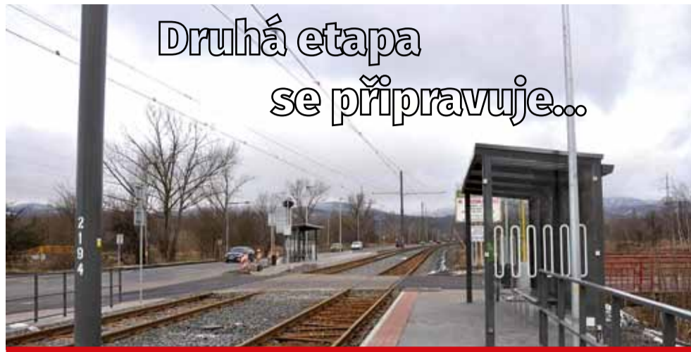
Na první etapu naváže rekonstrukce úseku ze Záluží do Mostu. V současné chvíli se dělá projekt na mostní konstrukce.

Rekonstrukce tramvajové trati zahrnuje i modernizaci přejezdů, výhybek a zastávek, které jsou bezbariérové. „V klíčových stanicích bude nový informační systém. Trať bude nyní možné projíždět vyšší rychlostí, zkrátí