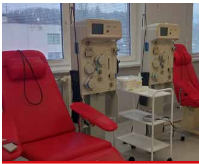
Odběry dárců krve se obvykle provádí v Po a St 7-10 hodin.