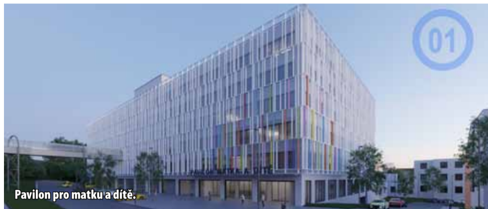
Pavilon pro matku a dítě.