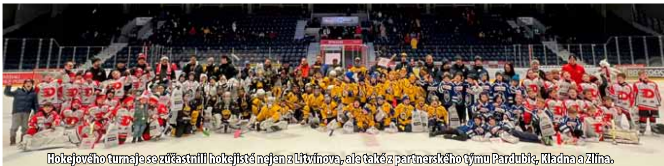
Hokejového turnaje se zúčastnili hokejisté nejen z Litvínova, ale také z partnerského týmu Pardubic, Kladna a Zlína.

ky. Základní cíl se vydařil. Děti ze sportu těší, turnaj je baví a každý rok je o kousek lepší. V příštím roce je v plánu i zapojení dalších týmů,“ uvedla mluvčí skupiny Sev.en Gabriela Sáríčková Benešová. První ze série turnajů z aktuální sezony se odehrál už v listopadu na litvínovském zimním stadionu Ivana Hlinky. V něm se nejlépe dařilo pardubickým hokejistům, kteří ovládli průběžnou tabulku. Zvítězili také na domácím ledě. Třetí část turnaje se odehrává v neděli 19. února na Zimním stadionu Ludka Čajky ve Zlíně. O konečném vítězi se rozhodne na jaře v Kladně. (ink)