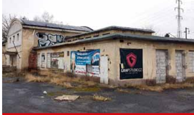
K rozvojovým projektům Litvínova patří například přesun spodního nádraží ke stávajícímu.

Město momentálně nemá souhrn rozvojových projektů.