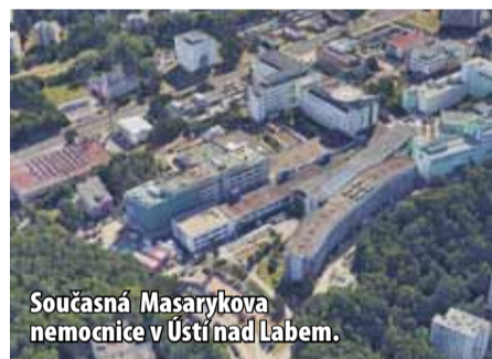
Současná Masarykova nemocnice v Ústí nad Labem.