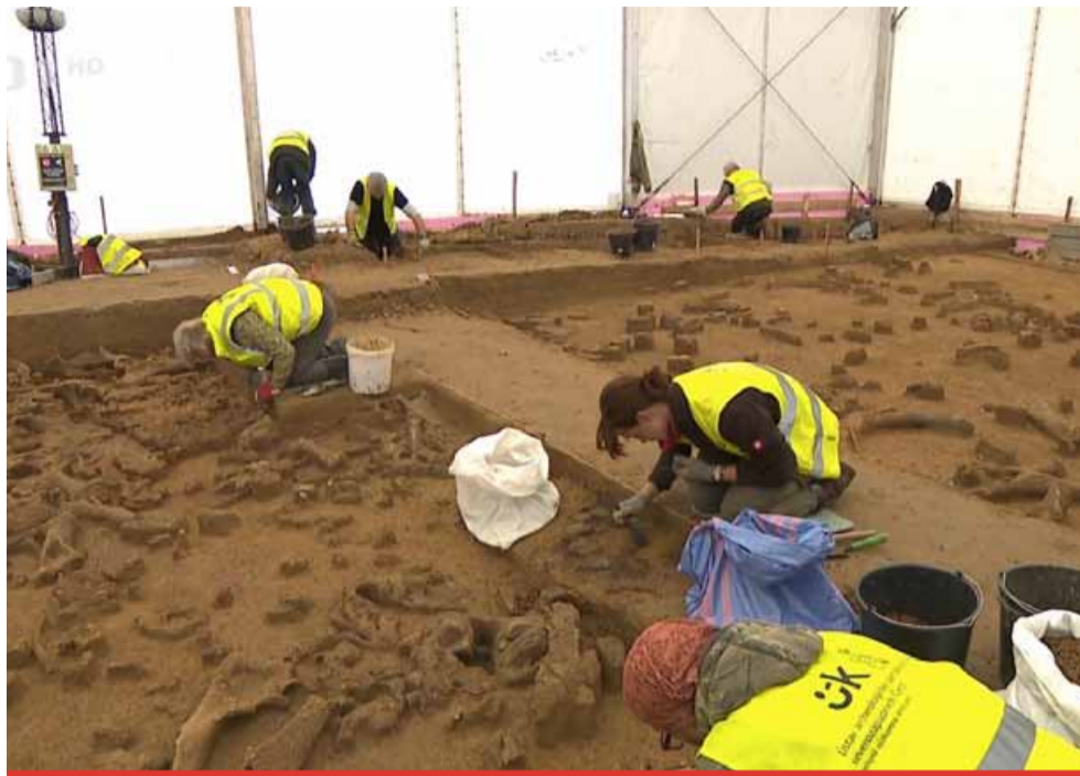
Zcela nové naleziště ze starší doby kamenné objevili archeologové v Ústí nad Labem vloni. Na konci září začali s klasickým dozorovým výzkumem při stavbě justičního paláce v Ústí nad Labem a za necelé dva měsíce narazili na nečekaně zajímavý objev.

Velmi cenné jsou v Ústí nad Labem především nálezy, mezi které patří četná ohniště a pracovní plochy, kde se vyráběly a opravovaly kamenné nástroje a také místa, kde se zpracovávala ulovená zvěř. Výzkum je dalším dokladem mimořádné