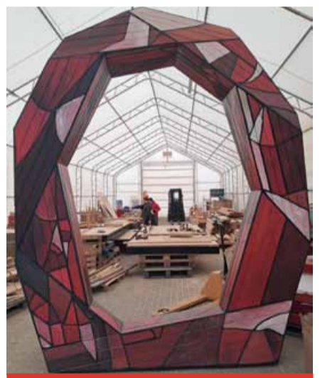
Zpestřením na hradě Hněvín bude nový fotopoint. Už je hotový včetně lávky a čeká na instalaci.

Ačkoliv si Mostčané zvykli, že se Den magistra Edwarda Kelleyho konal v areálu mosteckého muzea. Letos by se měl magr vrátit zpět na hrad. „Stavební práce nebudou mít vliv na akce tohoto typu ani letní divadelní scény. Chceme Kelleyho proto opět vrátit na hrad, protože sem patří a přitáhnout sem zpět