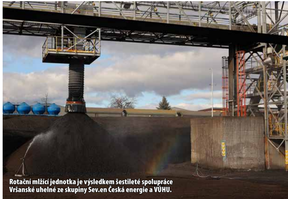
Rotační mlžící jednotka je výsledkem šestileté spolupráce Vršanské uhelné ze skupiny Sev.en Česká energie a VÚHU.

Rotační mlžící jednotka pracující na podobném principu jako sněžná děla je výsledkem šestileté spolupráce Vršanské uhelné ze skupiny Sev.en Česká energie a VÚHU (Výzkumného