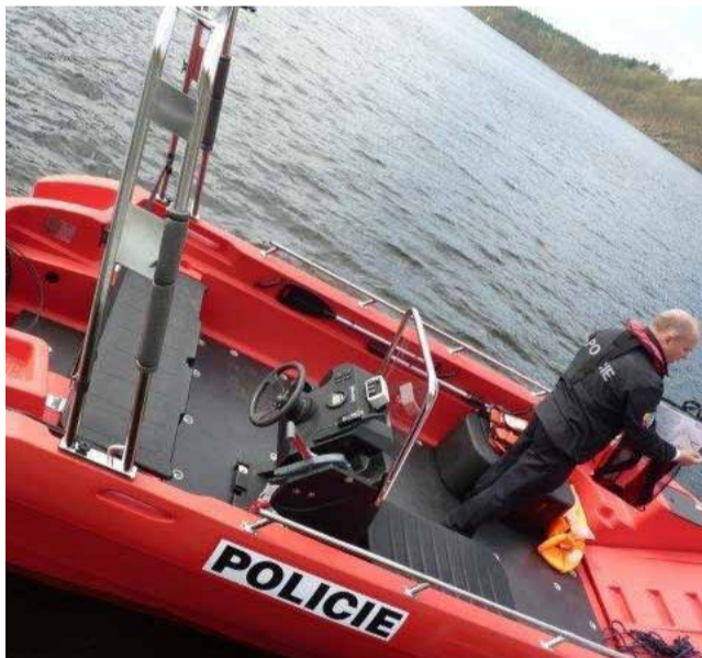
a možností je pokutovat. Budeme určitě lépe připraveni než minulou sezónu,“ ujistil primátor. (sol)

Letos budou na pořádek a bezpečnost u jezera dohlížet strážníci v novém motorovém člunu, který jim město pořídilo. Budou tak moci lépe uhlídat návštěvníky, kteří nedbají pravidel a provozního řádu. Souvisí to i s nově ukořeným fotopointem. Ten bude mít navíc zabudovanou sirénu, která dá hlasitě najevo, pokud by se na nápis Most někdo dobýval. „Měla by tu přibýt také ještě plastová zábrana, která by měla zamezit vstupu na fotopoint a řešíme i další opatření. Máme více nástrojů, jak lidem ve vandalismu zabránit,