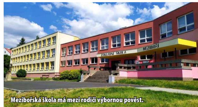
Mezibořská škola má mezi rodiči výbornou pověst.

Mezibořská základní škola vyučuje podle školního vzdělávacího programu Rovná škola, jehož hlavním cílem je všestranný rozvoj osobnosti žáka a rovné příležitosti pro všechny bez ohledu na sociální nebo kulturní zázemí. Nabízí spolupráci se zahraničními školami, kam děti každoročně za svými