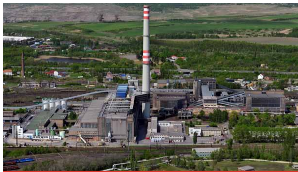
Stávající teplárenský provoz United Energy.

Stavbu prvního paroplynového cyklu zahájí dodavatel, spo-