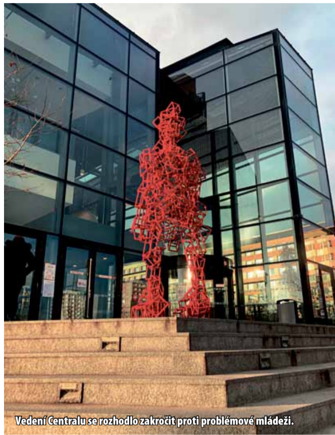
Vedení Centralu se rozhodlo zakročit proti problémové mládeži.