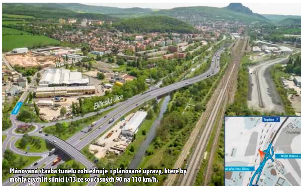
Plánovaná stavba tunelu zohledňuje i plánované úpravy, které by mohly zrychlit silnici I/13 ze současných 90 na 110 km/h.

Při řešení dopravy v Bílině se prověřovalo mnoho variant. Nejschůdnější se nakonec ukázal být tunel, který má od vlakového nádraží až ke koupališti Kyselka kopírovat řeku Bílinu. Na začátku i na konci se napojí na stávající silnici I/13 ve čtyřpruhu. Hlavní důvod, proč byla z několika možností nakonec schválena tunelová varianta, nebyl jen v samotné přetížené Bílině. Zohledňuje ale i plánované úpravy, které by mohly