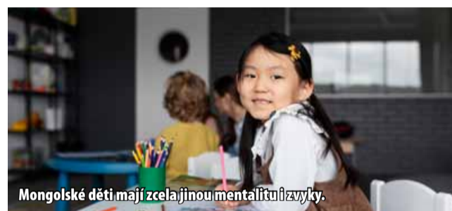
Mongolské děti mají zcela jinou mentalitu a zvyky.

Město spustí několik projektů právě pro tyto menší a budou určené na podporu pedago-