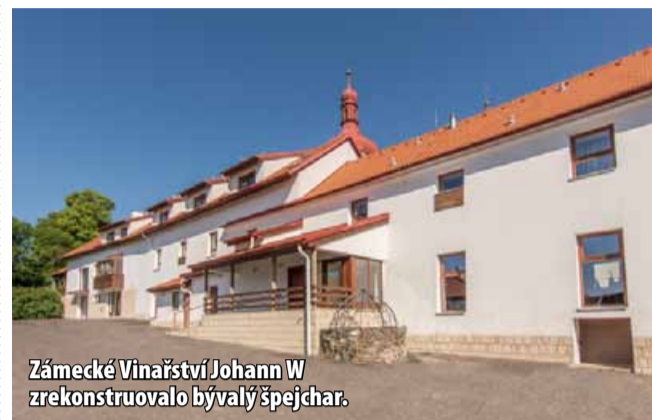
Zámecké Vinařství Johann W zrekonstruovalo bývalý špejchar.

Budete v ideálním výchozím bodě pro výlety, pochutnáte si na bohaté snídani, zrelaxujete se v sauně, oceníte pohodlí i přátelský personál, do vinařství a restaurace to máte jen pár kroků. Víno si můžete vychutnat i na terase, parkování a Wi-fi je zde zdarma. Více o penzionu najdete na: www.johannw.com . Rezervace se přijímají na: penzion@johannw.com . (nov)