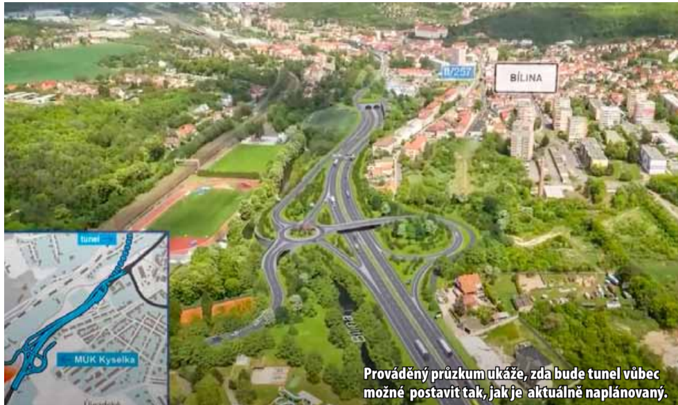
Prováděný průzkum ukáže, zda bude tunel vůbec možné postavit tak, jak je aktuálně naplánovaný.

Tunel, který má vyřešit kritickou situaci na silnici I/13, schválilo ministerstvo dopravy v roce 2021. Průjezd po hlavním