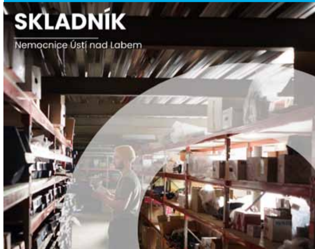
SKLADNÍK Nemocnice Ústí nad Labem