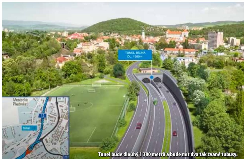
Tunel bude dlouhý 1 380 metrů a bude mít dva tak zvané tubusy.

Po vjezdu do tunelu bude trasa dál pomalu klesat a podcházet řeku Bílinu a Kyselskou a Mosteckou ulici. Trasa se stočí k železniční trati přibližně v místě, kde bude podcházet Základní škola Lidická a začne opět pomalu stoupat. Poté bude pokračovat pod centrální částí města a nedaleko vlakového nádraží opět vystoupí napovrch. Tunel bude dlouhý 1 380 metrů. Dál bude silnice pokračovat nezastavěným územím mezi železniční trati a řekou. Před areálem stavebnin se trasa stočí a mostem přejde na druhý břeh řeky Bíliny. V místech, kde se silnice opět dostane do původní trasy silnice I/13, se vybuduje mimoúrovňová křižovatka Bílina – sever. Podobně jako v začátku úseku, také zde se bude jednat o třípaprskovou trubkovitou křižovatku s jedním mostem a okružní křižovatkou. Do křižovatky se napojí Teplická ulice, Bílinská ulice a komunikace do Chudeřic. Za touto křižovatkou trasa nově přeložky skončí a silnice I/13 bude pokračovat dál na Teplice po stávajícím čtyřpruhu. (nov)