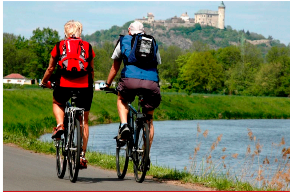
Na vypůjčených kolech se můžete vydat kamkoliv, třeba i za hranice Mostu.

Půjčovna bude otevřena od května do září, Po - Ne, od 9 do 17 hodin. „Slibujeme si od této služby atraktivnější turistického centra pro návštěvníky,“ uvedla mluvčí mosteckého magistrátu Klára Vydrová. Kola si mohou vypůjčit osoby starší 18 let nebo i mladší, za přítomnosti zákonného zástupce. Za čtyři hodiny je půjčované u klasického kola 200 Kč, u elektrokola 300 Kč. Součástí je i vratná záloha 1 000 Kč. „Součástí smluv jsou i ceny za způsobené škody,“ doplnila mluvčí. K půjčování kol je poskytnut kompletní servis. Součástí výbavy jsou přílby a základní nářadí. „Cyklisté si mohou půjčit kolo kamkoliv. Důležité je, aby se kola vrátila včas a v pořádku,“ podotýká mluvčí. „Turistické centrum by mělo být výkladní skříň magistrátu, což se o našem centru příliš říci