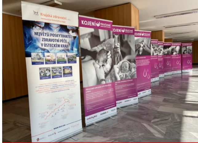
V Nemocnici Most je k vidění putovní výstava organizace Nedoklubko, která se věnuje kojení předčasně narozených dětí. Výstavu tvoří 10 tematických fotografií vystihujících kojící maminky nebo krmení alternativními způsoby.

Darované mateřské mléko nejčastěji využívají perinatologická