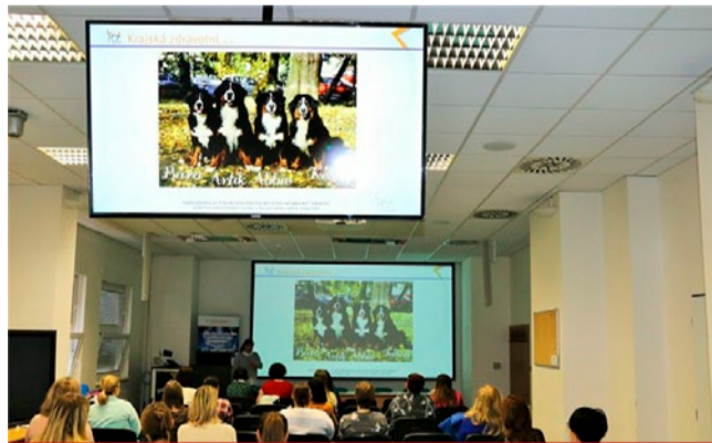
Canisterapie má v Krajské zdravotní nezastupitelné místo. Do nemocnic Krajské zdravotní ji přináší nadšenci z řad chovatelů psů.

mocnici. Od jejího příchodu na kliniku před třinácti lety lze pozorovat systematický rozvoj canisterapie v největší krajské nemocnici a posléze i v KZ. „Je spousta lidí, která se snaží canisterapii nahrazovat třeba nějakou loutkovou či jinou terapií. Canisterapie je ale motivací na straně jedné, a na straně druhé umožňuje pacientovi nahradit svalové jádro. Psa nemůže žádný přístroj nahradit. Jde i o psychickou podporu od této němé duše, kte-