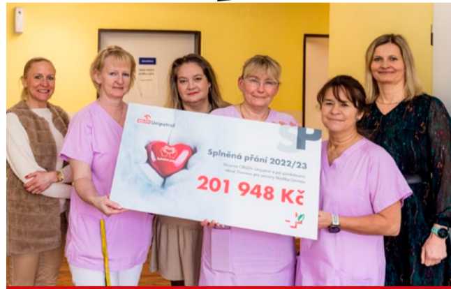
Každoroční sbírka zaměstnanců skupiny ORLEN Unipetrol vynesla rekordních 619 tis. Kč.

Domov pro seniory Naděje Litvínov - Zajištění zdravotních a rehabilitačních pomůcek,