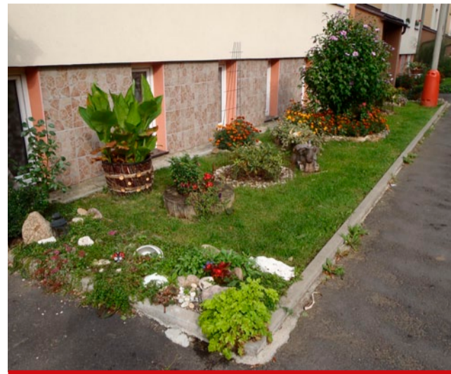
Svími ukázkovými předzahrádkami jsou Mezihořtí vyhlášeni.

děno minimálně pětikrát v průběhu dubna až října. Přesný termín hodnocení se předem nezveřejňuje, ale stanoví se, aby všechna místa byla posuzována pokud možno stejnými porotci a ve stejný den. Každého hodnocení se zúčastní nejméně čtyři porotci. Ti budou bodovat nápad, harmonii a kontrast, rozmanitost a plochu předzahrádky. V každé etapě hodnocení může hodnocení získat nejvýše 15 bodů. Prvních pět výherců odmění město poukázkami na nákup zahradnického zboží. (ink)