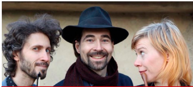
Kapela je vítězem Porty 2021