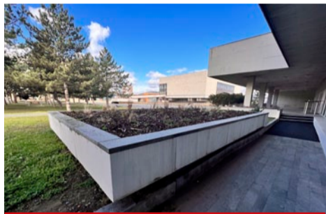
Opravit by se měly i nevzhledné kamenné květníky z boku hotelu.

V jednotlivých patrech se postupně mění podlahové krytiny, koberec a částečně i nábytek a dělají se nové výmalby. Město nyní vyhlašuje veřejnou zakázku na rekonstrukci podlah a výměnu koberec v 5. a 12. patře hotelu. Opraví se i vstupní přístřešek, kterým dlouhodobě zateká. Nový vzhled bude mít také název. „Chceme zpracovat stu-