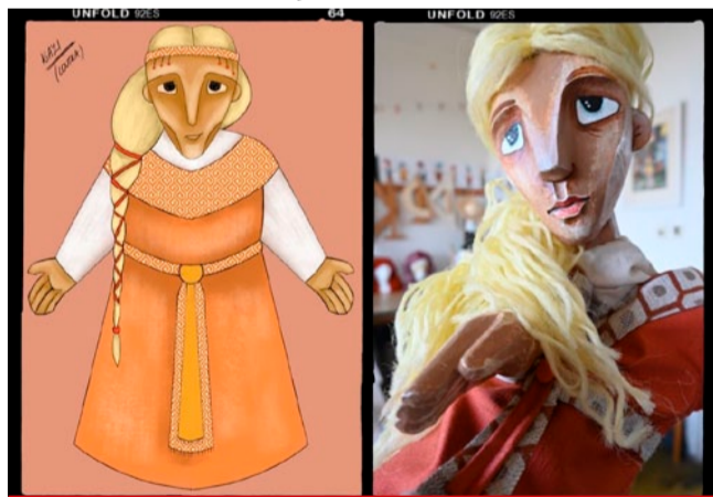
Seznamte se s Kazi, s nejstarší ze slavné trojice sester se silou v léčitelských schopnostech a slabostí pro statné muže.