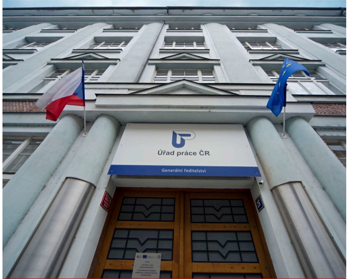
„Vládní signály“ živnostníky k podnikání příliš nemotivují, spíš naopak! Pokud likvidace živností bude pokračovat, úřady práce budou zřejmě prskat ve švech.

V lednu 2023 s podnikáním skončilo v České republice necelých 15 888 živnostníků a do poloviny února 24 630.