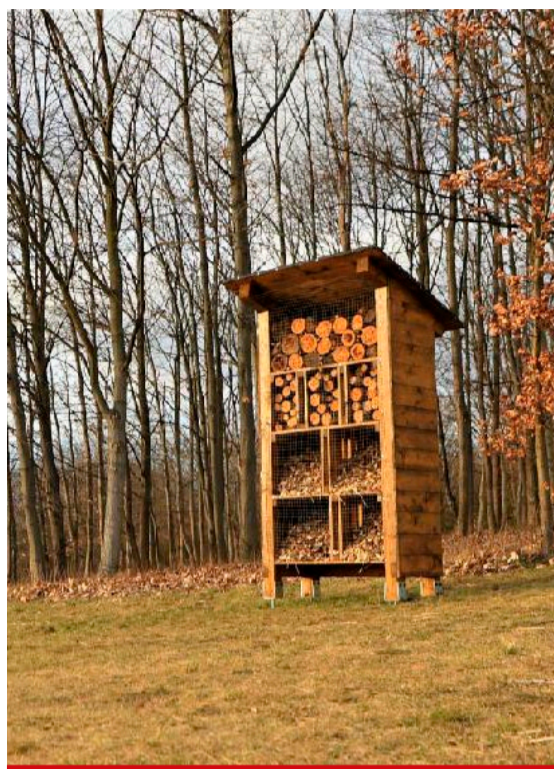
Stejný hmyzí hotel, jaký už obydli noví nájemníci na rekultivovaných plochách lomů Vršany a ČSA, postavili během zimních měsíců truhláři firmy Rekultivace ze skupiny Sev.en ve spolupráci s městem Most také v parku Šibeník.

Hmyzí hotel má na zadní straně informační tabuli, která představuje některé z jeho potenciálních nájemníků. Jak si žije sluněčka sedmítečná, blanokřídle nebo třeba škvoří, mohou Mostčané sledovat při svých procházkách parkem. Na rekultivovaných plochách kolem povrchových lomů Vršany a ČSA se nachází několik hmyzích hotelů. Jeden z prvních byl umístěn nedaleko cyklostezky na Slatinické výspě u lomu Vršany. Během loňských prázdnin vyrostl hmyzí hotel u altánu na vnitřní výspě lomu ČSA. Doplnil biotop, který se nachází v jeho bezprostřední blízkosti. Multifunkční biotopy vznikají na výspěch lomů obvykle na územích mezi zemědělskou či lesnickou rekultivací. Tvoří je vodní plochy a mokřady a doplňují kamenné mohyly, hromady odumřelého dřeva i písčité a šterkové plochy. Takto vytvořené životní podmínky vyho-