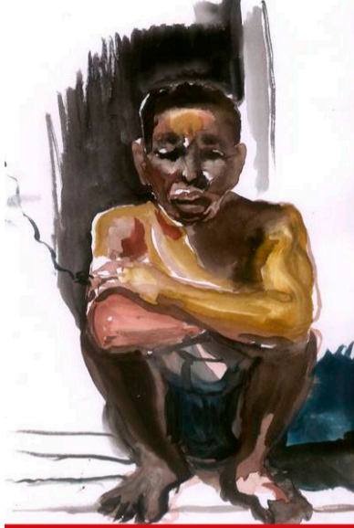
Výstavu Život a umění v Amazonském pralese doplní obrazy Otto Plachty inspirované pobytem v peruánské Amazonii.