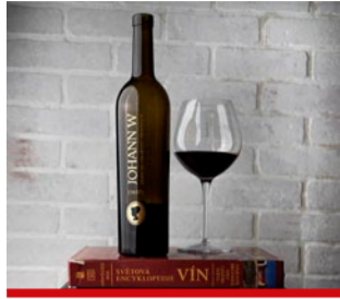
Letošní ceny pocházejí z dílny Efka.

Na ochutnávku vína z Vinařství Johann W nemusíte čekat až do Dnů vína. Zajet si můžete do vinotéky v Třebívlicích. Ta je otevřena po - pá od 10 do 17 hodin, v so - ne od 10 - 16 hodin nebo po domluvě na tel.: +420 733 532 096. Vína můžete nakupovat také prostřednictvím e-shopu na www.johannw.com . (nov)