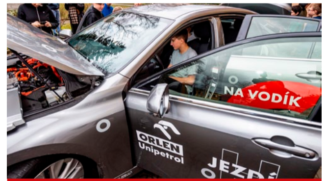
Žáci mohli nahlédnout pod kapotu i dovnitř vodíkového „draka“.

né energie. Děti si mohly v třídním týmu postavit zatím jen podvozek vlastního vodíkového autíčka a vyrobit svůj první zelený vodík a během pauzy se podívat pod kapotu skutečného vodíkového autům. Konkrétně do Toyoty Mirai, která byla přistavena před školou. (nov)