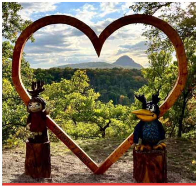
Mezi podpořenými projekty je i Pohádkový les Bílina, který se díky podpoře Ústeckého kraje dočká záchytného parkoviště.

dokumentace pro cyklostezky apod. Mezi příjemce dotace patří např. Krásná Lípa s projektem na vybudování plochy pro obytné vozy, Brozany se záměrem na stavbu stellplatzu a cyklopointu na cyklostezce Ohře. Útulny v Krušných horách nebo parkoviště pro běžkaře v Petroviciích plánuje vystavět DA Krušnohoří, Terezín připravuje redesign infocentra, Jílové či Roudnice nad Labem plánují výstavbu sociálního zařízení, Bílina záchytné parkoviště u Pohádkového lesa, podobně jako Ústě. Další projekty se pak zaměřují například na cyklistickou infrastrukturu. (nov)