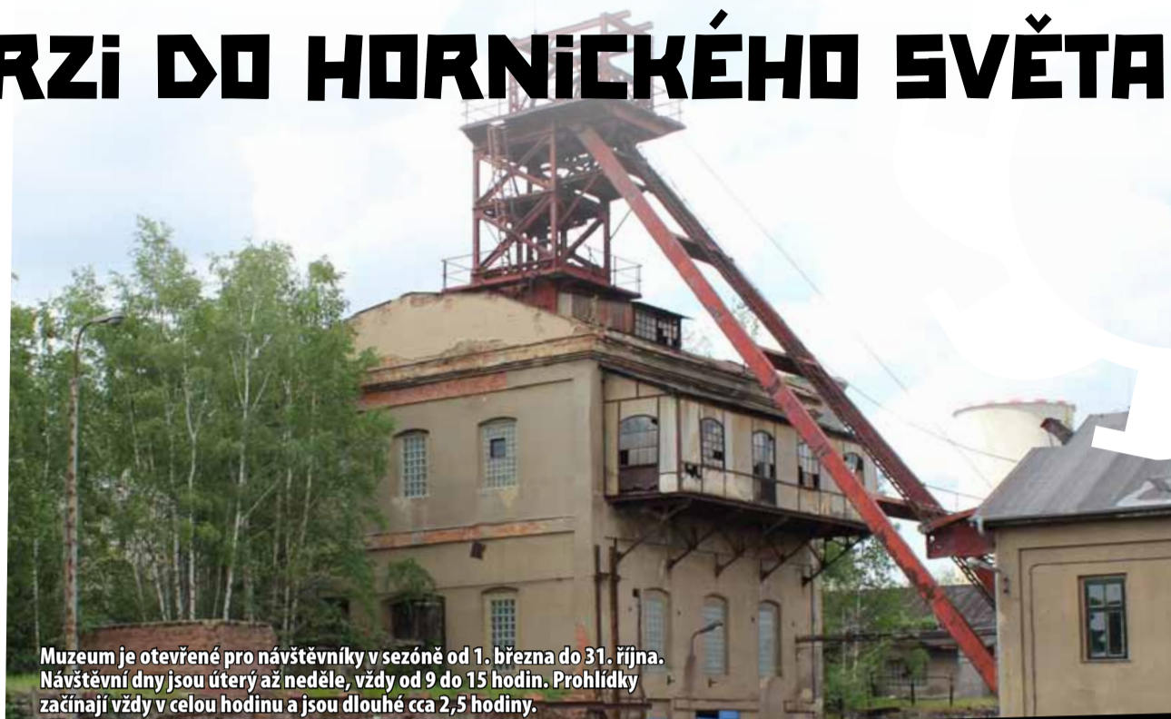
Muzeum je otevřené pro návštěvníky v sezóně od 1. března do 31. října. Návštěvní dny jsou úterý až neděle, vždy od 9 do 15 hodin. Prohlídky začínají vždy v celou hodinu a jsou dlouhé cca 2,5 hodiny.

„Náš region má unikátní industriální dědictví a je naší povinností toto dědictví uchovat,“ říká ředitel muzea a dodává: „Partnerství se Sev.en Česká energie nám umožňuje nejen udržovat muzeum jako kulturní centrum, ale i rozvíjet nové projekty, které přiblíží naši historii širší veřejnosti.“ (ink)