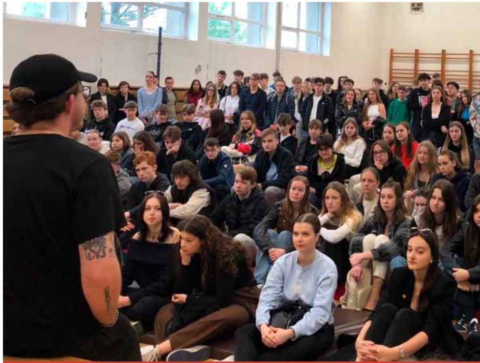
Jako první se mohli „hecnout“ studenti mosteckého gymnázia. O přednášky byl nebývalý zájem.

H3KNISE není běžný výukový či osvětový program. Místo tradičních přednášek slyší studenti autentické příběhy přímo od lidí, kteří si sami prošli vlastními výzvami a našli cesty, jak se „hecnout“ ve svém životě k lepšímu. Do projektu jsou přizvány osobnosti z řad influencerů a mladých lidí, kteří již v mladém věku vybudovali úspěšný business či svými aktivitami pomáhají ostatním překonávat problémy a životní překážky. „Zapojení se do projektu H3KNISE pro nás bylo přirozeným krokem, protože