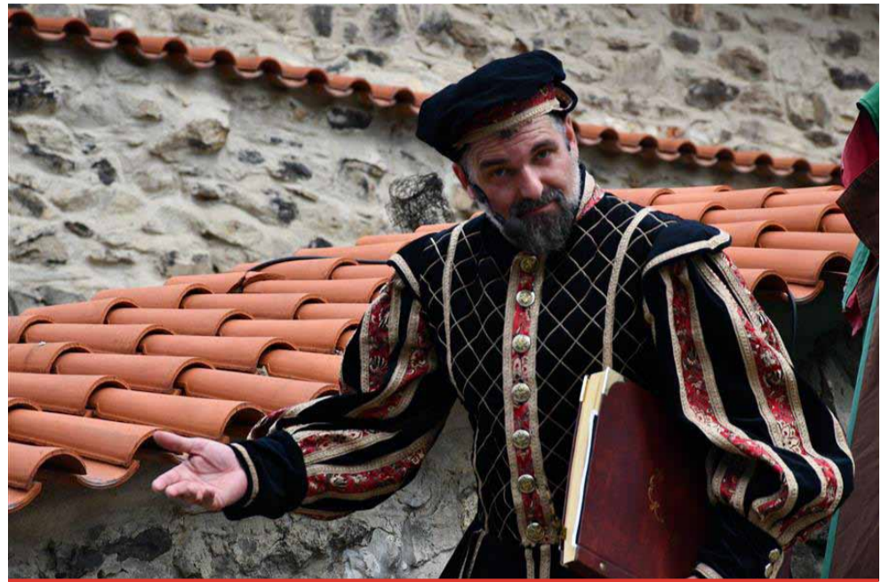
Otevření dílny slavného mága na Hněvině se kvůli opravám hradu o měsíc zpozdí.

Od 1. června bude možné navštěvovat dílnu alchymisty pouze přes víkend. Otevřeno bude od pátku do neděle od 11 do 17 hodin. Od 2. července do 1. září od úterý do neděle v době od 9 do 17 hodin. „V případě, že by se stalo něco neočekávaného