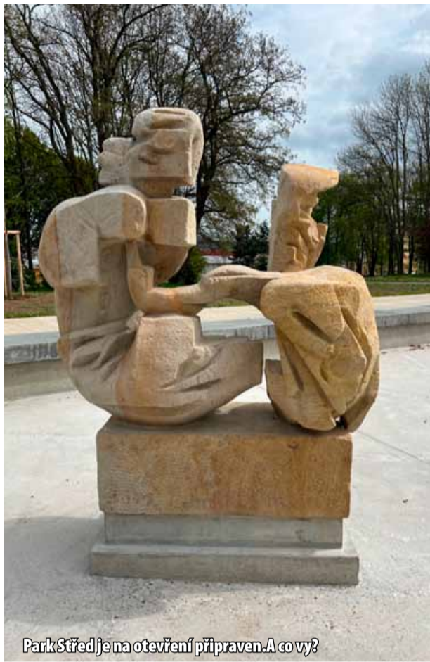
Park Střed je na otevření připraven. A co vy?