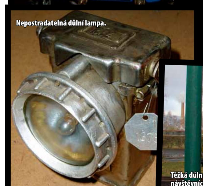
Nepostradatelná důlní lampa.