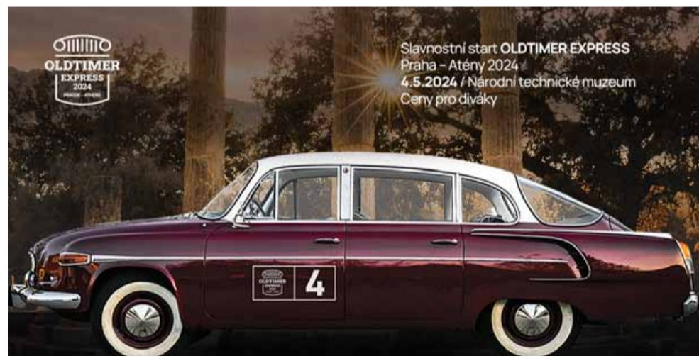
Slavnostní start OLDTIMER EXPRESS Praha - Atény 2024 4.5.2024 / Národní technické muzeum Ceny pro diváky

Už 4. května se na cestu vydá Oldtimer Express - vytrvalostní jízda 43 českých veteránů z Prahy do Athén. Přípravy i celou cestu můžete sledovat na Facebooku a Instagramu Oldtimer Express. Účastníci závodu můžete přijít podpořit na start, kde v rámci programu uvidíte vystavené vozy závodu a slavnostní start prvního vozu. Připravena je autogramiáda osobností motorsportu Zlatý volant a soutěž o ceny pro návštěvníky. Ceny pro diváky: Tankovací karta ORLEN 10.000 Kč, Glo-