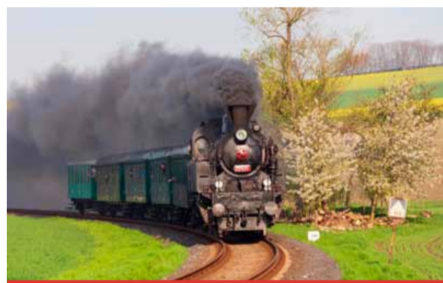
Legendární parní lokomotiva Všudybylka opět vyrazí na trať, aby svezla železniční nadšence.

MOST – Švestková dráha zve 1. května na prvomájové parní jízdy na Švestkové dráze s historickou soupravou taženou parní lokomotivou z roku 1925, známou pod přezdívkou Všudybylka.