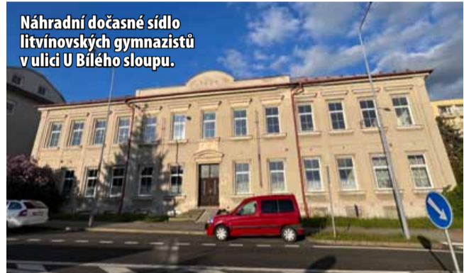
Náhradní dočasné sídlo litvínovských gymnazistů v ulici U Bílého sloupu.

Prostory v budově u Bílého sloupu v současnosti využívá Table-tenis club. Tím, že se sem dočasně přestěhuje Gymnázium T. G. M., ale nijak ne-