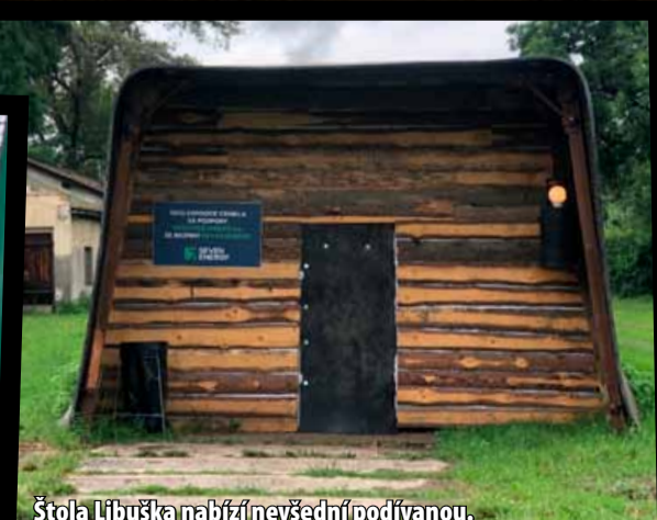
Štola Libuška nabízí nevěšdní podívanou.