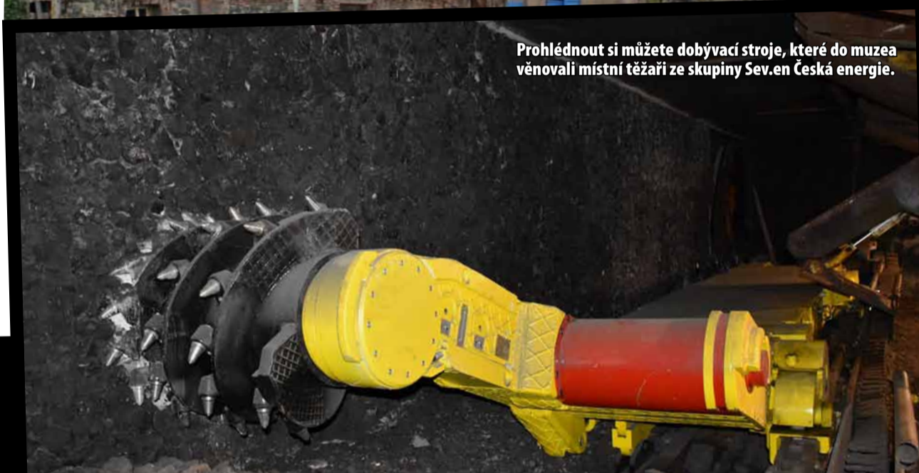
Prohlédnout si můžete dobývací stroje, které do muzea věnovali místní těžaři ze skupiny Sev.en Česká energie.