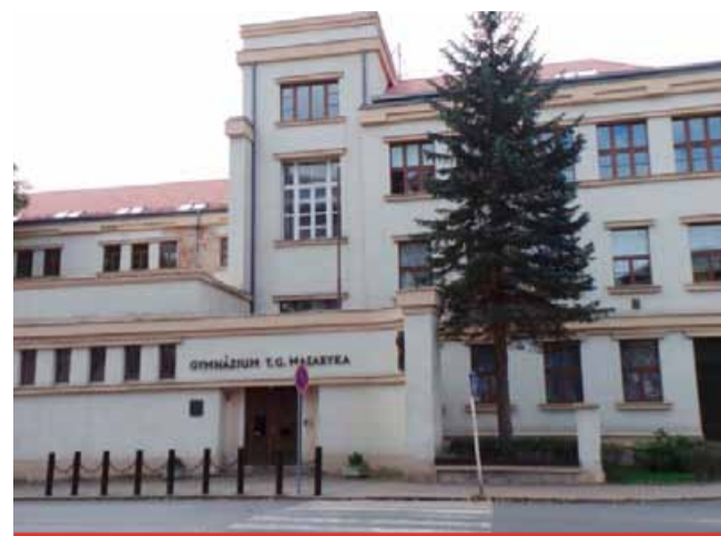
Litvínovské gymnázium čeká velká rekonstrukce, kvůli které se žáci budou muset na nějaký čas odstěhovat.

budou dotčeny. „Stolní tenisové budovy i nadále využívat svůj samostatný vstup do budovy,“ doplnil místostarosta.