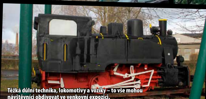
Těžká důlní technika, lokomotivy a vozíky – to vše mohou návštěvníci obdivovat ve venkovní expozici.