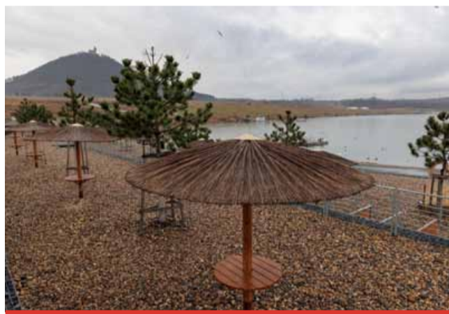
V plánu byly letos kaskády, lehátka u slunečníků a nové toalety. Správce jezera Most, státní podnik Diamo, zde však další rozvoj zatím zastavil.

Jedním z projektů, které se měly začít realizovat, byl i centrální park. „Zjistilo se, že je tu neúrodná půda. Vzali jsme sem odborníky, kteří potvrdili, že půda je neúrodná a cokoliv by se zde zasadilo, by nerostlo nebo uhynulo. Pokud by zde měl v budoucnu být park, bude zde potřeba provést náročné zemní práce a rekultivace. I proto se o kus dál