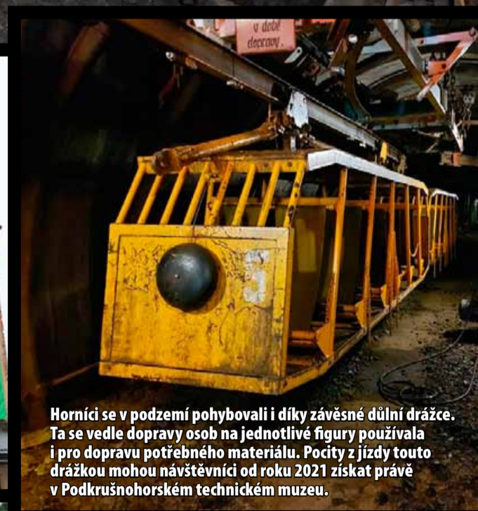
Horníci se v podzemí pohybovali i díky závěsné důlní drážce. Ta se vedle dopravy osob na jednotlivé figury používala i pro dopravu potřebného materiálu. Pocit z jízdy touto drážkou mohou návštěvníci od roku 2021 získat právě v Podkrušnohorském technickém muzeu.