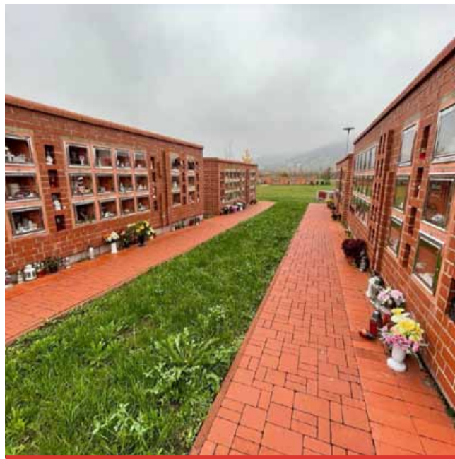
V areálu Kostelního hřbitova vzniknou další čtyři kolumbární zdi. Práce začnou v červnu a potrvají zhruba tři až čtyři měsíce.

Město uvažuje v souvislosti se hřbitovy o dvou novinkách. Jednou z nich je hřbitovní průvodce. „Příslušný odbor opako-