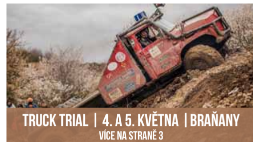
TRUCK TRIAL | 4. A 5. KVĚTNA | BRAŇANY VÍCE NA STRANĚ 3