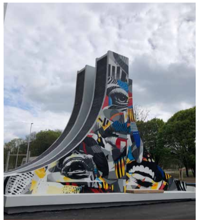
Sací vzduchotechnika se proměnila ve streetovou galerii. Najdete ji ve street art zóně ve spodní části parku.

Známý pouliční umělec z Havířova je autorem řady velkoplošných maleb v mnoha českých městech. Zkrášluje nejen města, ale také firmy, instituce a domovy. Jako samouk začínal u klasického street artu a graffiti. V poslední době se věnuje především velkoformátovým dílům, kterým se přezdívá mural art. Nikola Khoma Vavrouse vytváří také originální malby na zakázku, malby dětských pokojů, obrazy na míru, pořádá graffiti workshopy a art exhibice. (nov)