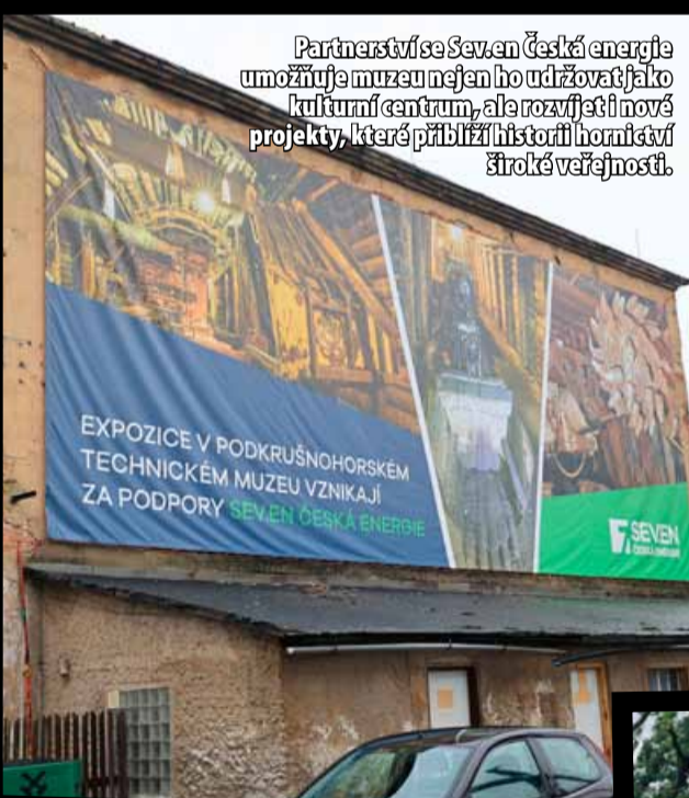
Partnerství se Sev.en Česká energie umožňuje muzeu nejen ho udržovat jako kulturní centrum, ale rozvíjet i nové projekty, které přiblíží historii hornictví široké veřejnosti.