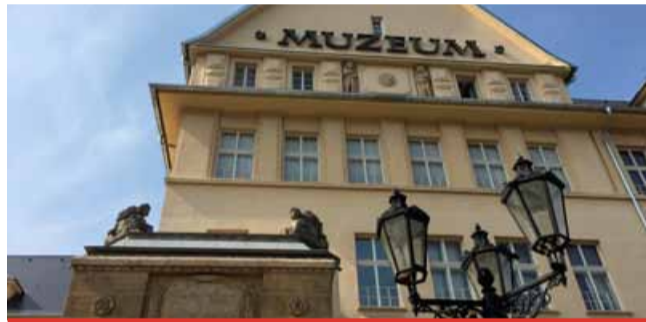
Oslavy Dne magistra Kelleyho se letos opět odehrají v mosteckém muzeu.

problémová infrastruktura, a je to tak pro návštěvníky příjemnější. Kelley ale patří na Hněvín. Vždyť je s ním spjat i historicky a odtud i skutečně prchal,“ připomněl primátor. Přislíbil, že město se bude snažit najít kompromis, aby vyhověl příznivcům obou možností. „Řešíme, jak propojit areály hradu i muzea pro tuto akci. Tedy část programu v muzeu a část na Hněvíně,“ prozradil primátor. (sol)