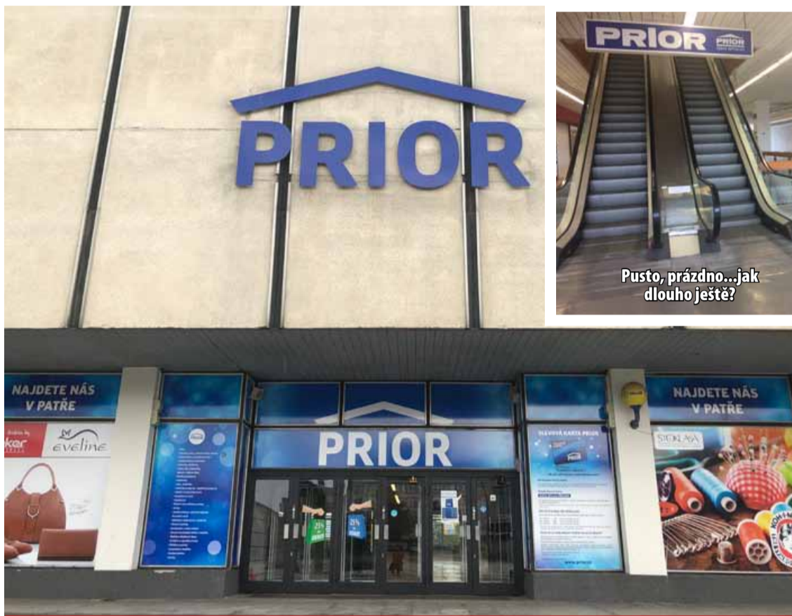
Město Most se už několik let marně snaží dohodnout s majiteli Prioru na jeho odkoupení. Nyní se snad objevila naděje objekt získat. Ačkoliv jasný plán na jeho využití zatím není, koketuje město s myšlenkou vybudování druhého multikina.

Sláva obchodního domu Prior, jehož stavba začala v roce 1972 a trvala tři roky, je dávno minulostí. Žalostný stav obchodního domu a jeho okolí štvě občany i politiky. Majitelé nyní zahájili úspěšná opatření a plánují sestěhovat fungující obchody z horních pater do spodních. (sol)