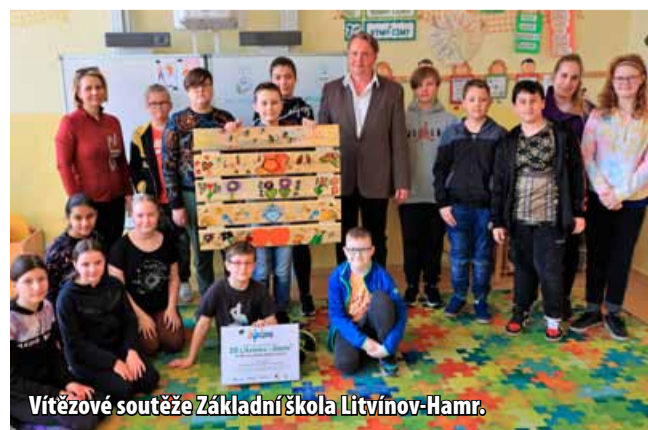
Vítězové soutěže Základní škola Litvínov-Hamr.