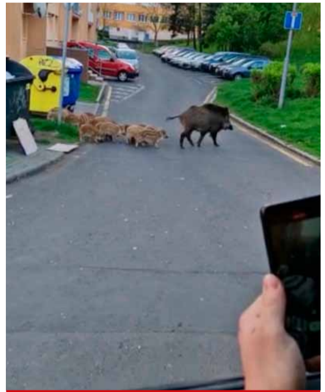
Situace s přemnoženými prasaty ve městě se zdá být vyhozená, ale podle mostecké radnice je to také tím, že si lidé divočáky, kteří pendlují sídlištěm a tam, fotí a posílají po sociálních sítích.