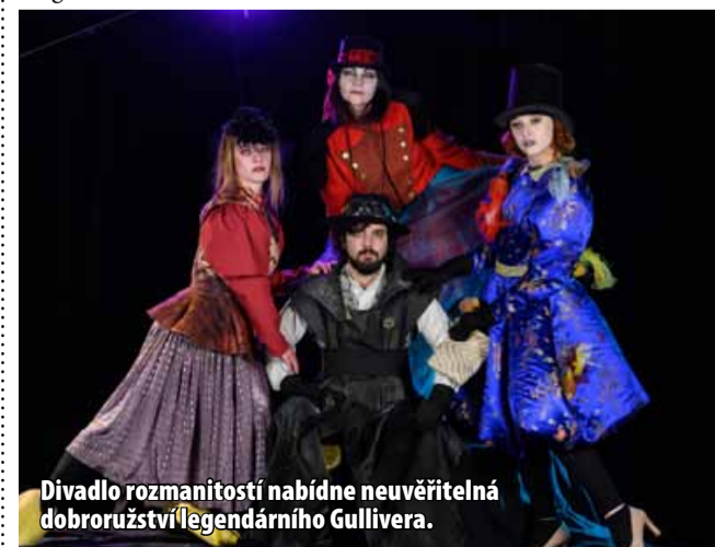
Divadlo rozmanitostí nabídne neuvěřitelná dobrodružství legendárního Gullivera.

Fantastický cestopisný román napsal v roce 1735 anglický spisovatel Jonathan Swift. Hlavní hrdina knihy, lodní lékař a později kapitán Lemuel Gulliver, vypráví příběh o neuvěřitelných dobrodružstvích, která prožil u malíčkových obyvatel Liliputu, u brodingnackých obrů, u učenců na létajícím ostrově Laputa a nakonec u moudrých koní Hvajninimů. Neuvěřitelné příhody a setkání s různými fantastickými národy nabízí satirický pohled na náš vlastní život. Vstupné: 140 Kč, hra je vhodná pro děti od 6 let. Hraje se v budově Magistrátu města Mostu!