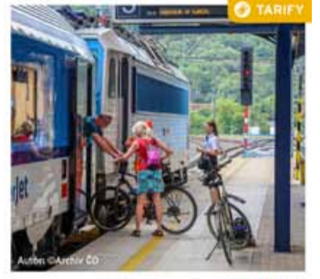
Zarezervujte si místo pro vaše kolo

ÚSTECKÝ KRAJ - Jízdenky Dopravy Ústeckého kraje pro jízdní kola už nejsou nepřestupní, ale s časovou platností.