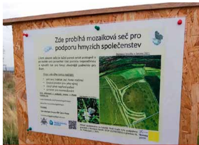
Některá města dovedla mozaikovou seč k dokonalosti. Na místa, kde probíhá, instalovala v rámci osvěty vysvětlující tabule.

Mozaikové travníky najdete na třídě Budovatelů, Zahrazenech, v parku pod nemocnicí, na ploše mezi dopravním podnikem a tramvajovým pásem, v ulici K. J. Erbena nad blokem 540, v části parku J. Vrchlického za blokem 264 nebo v lokalitě