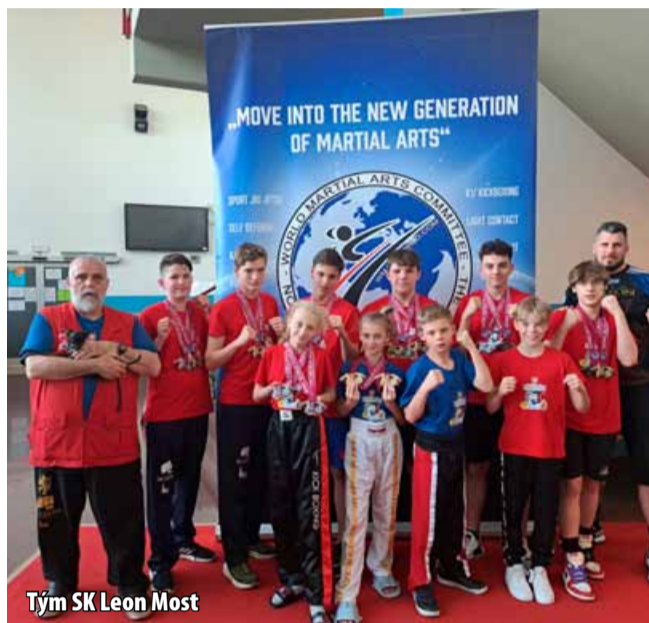
Tým SK Leon Most