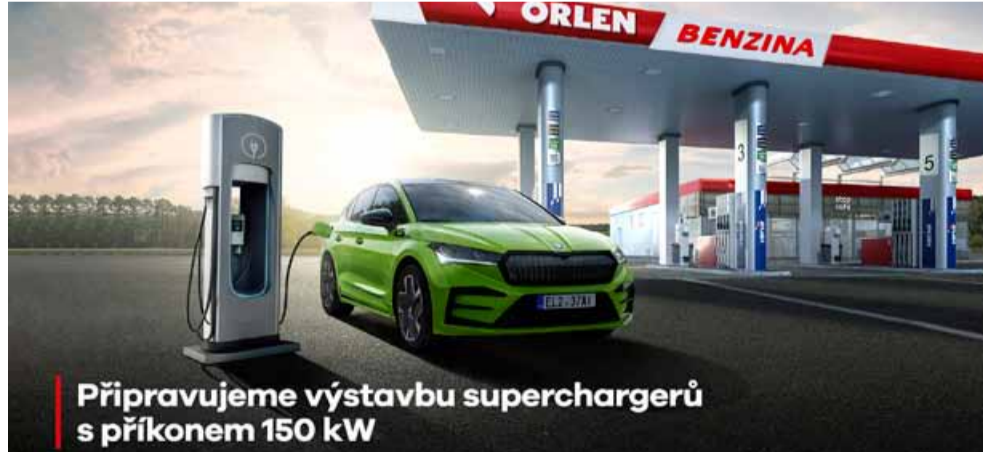
Připravujeme výstavbu superchargerů s příkonem 150 kW

Sít ORLEN Benzina nabízí 225 elektrodobíjecích bodů na 55 čerpacích stanicích, což