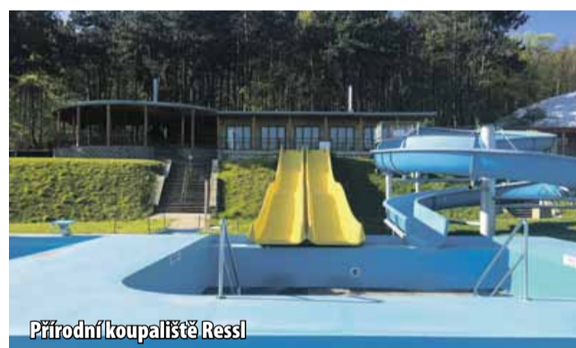
Přírodní koupaliště Ressler

MOST - Ačkoliv původně měla být loňská sezóna přírodního koupaliště na Ressleru poslední, areál se opět otevře. Pokračování další sezóny potvrdil jeho majitel Josef Smolík.