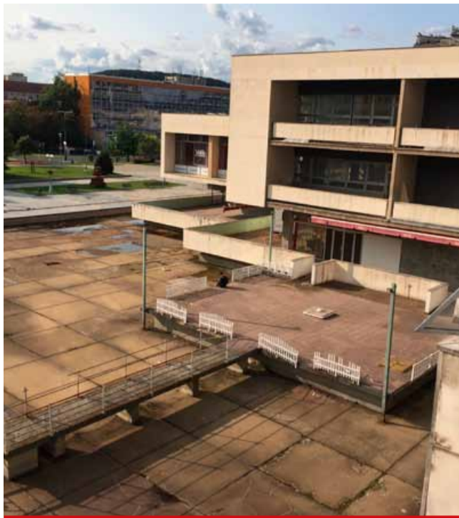
Navzdory plánům zůstává Repra zatím v neutěšené podobě a nějaký čas ještě zůstane.

Dokončení stavební části Repre se předpokládá v prosinci 2025 a dovybavení městské knihovny, která se sem přestěhuje z Moskevské, v prosinci 2026. S novou plesovou sezónou se počítá v lednu 2027. Jednou z hlavních součástí nového Repre bude nový kulturní sál, jehož podoba by se neměla nijak zásadně měnit. Vybuduje se moderní multikino a zachováno zůstane také planetárium. Rekonstrukce zahrnuje i revitalizaci venkovního prostranství. „Součástí bude i oprava stávající zničené uvolněné dlažby, vyjma schodiště, které se tu nachází a vede k hotelu Cascade. Nepatří totiž do majetku města,“ informoval primátor a prozradil, že majitel zvažoval zrušení tohoto schodiště, protože je minimálně využité. Oprava dlažby by se měla provést jen na polovině venkovního prostranství. Zbývající část náleží Prioru. (sol)