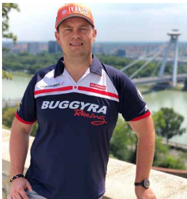
Ačkoliv to původně vypadalo jinak, tým Buggyra na šampionátu okruhových tahačů v Mostě nebude chybět.