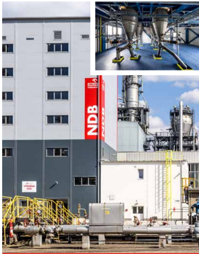
Nová výroba bezprašných směsí.

Projekt výroby bezprašných stabilizačních směsí vznikl ve spolupráci s výzkumným a vývojovým centrem ORLEN Polymer Institute Brno. Díky této investici může Orlen Unipetrol rychle reagovat na tržní výzvy a nabízet produkty, které přesně vyhovují specifikacím a požadavkům svých zákazníků. Nová jednotka na výrobu bezprašných stabilizačních směsí představuje také významný krok směrem k dekarbonizaci činnosti skupiny ORLEN Unipetrol. (nov)