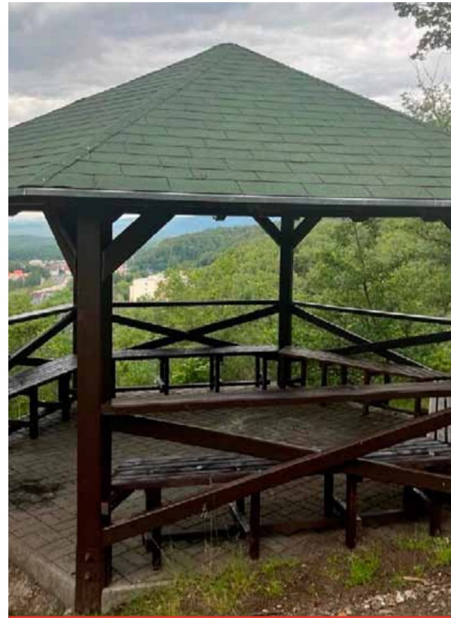
Czeditův gloriet na svahu Studničního vrchu nad Litvínovem je nově opravený. Je z něj krásný výhled na celý Litvínov.