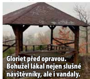
Gloriet před opravou. Bohužel lákal nejen slušné návštěvníky, ale i vandaly.