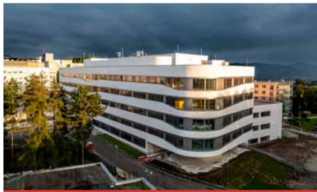
Součástí nového pavilonu jsou operační sály a lůžka oddělení kardiocirurgie, kardiologie, hrudní chirurgie, Kliniky anesteziologie, perioperační medicíny a jednotky intenzivní péče, ale i ambulance jednotlivých oddělení. Jde o nemocniční koncept budovy vycházející z nejnovějších trendů.

nemocnic investovat. Naším cílem je dlouhodobé, koncepční promyšlené investice do našich nemocnic i v souladu s demografickými trendy,“ uvedl předseda představenstva