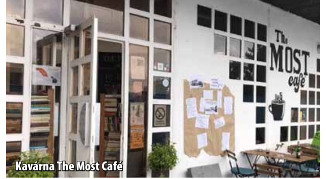
Kavárna The Most Café