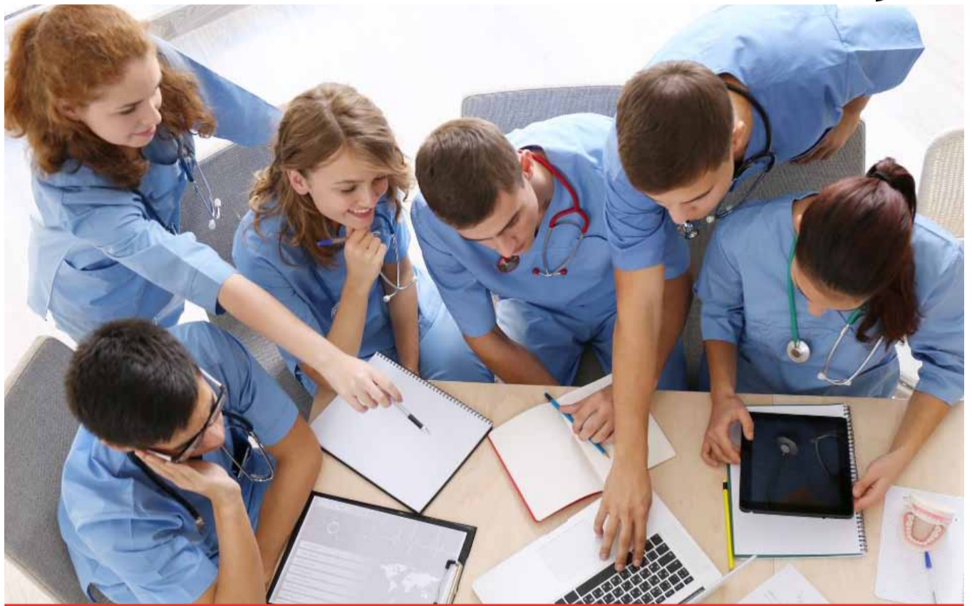
Medicové mohou získat až 800 tis. Kč, budoucí zdravotní sestry dosáhnou až na půl milionu korun. Pro akademický rok 2024/2025 se mohou studenti hlásit do 20. října. Podrobnosti zájemci najdou na www.kr-zdraotni.eu .

PRO AKTUÁLNÍ ZPRAVODAJSTVÍ SLEDUJTE WWW.HOMERLIVE.CZ