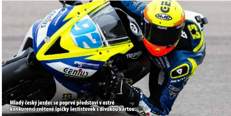
Mladý český jezdec se poprvé představí v ostré konkurenci světové špičky šestistovek s divokou kartou.