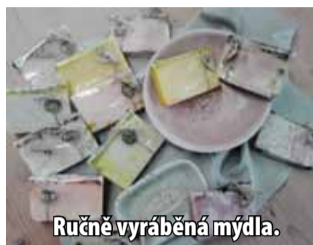
Ručně vyráběná mýdla.

„Slatinická výsypka je příkladem úspěšné rekultivace. Místem, kde se dříve těžilo uhlí, ale které se plně vrátilo pří-