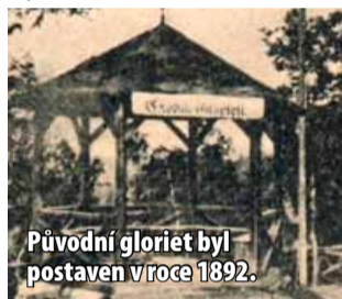
Původní gloriet byl postaven v roce 1892.