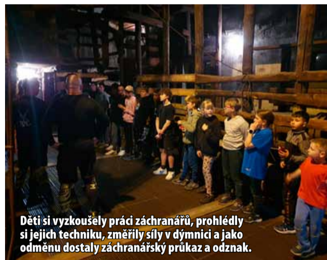
Děti si vyzkoušely práci záchranářů, prohlédly si jejich techniku, změřily síly v dýmnici a jako odměnu dostaly záchranářský průkaz a odznak.

„Děti měly možnost nahlédnout do světa profesionálních záchranářů a ke konci dostaly průkaz záchranáře s vlastními jmény a změřeným časem, za který dýmnicí zdolaly a záchranářům za program, který pro ně připravili, všechny děti poděkovaly,“ uvádí Eva Maříková mluvčí skupiny Sev.en Česká energie. Báňští záchranáři zasahují v různých typech situací. Do akce nastupují například při haváriích v podzemí, v nedýchacím ovzduší a podílejí se na pracích při odstraňování následků havá-