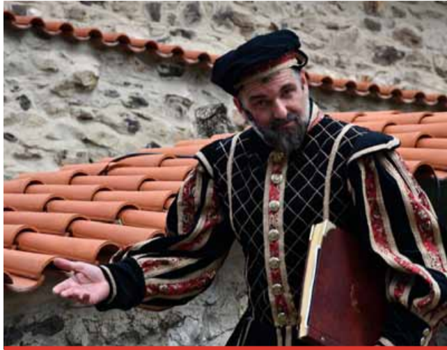
„Kelley patří k Hněvínu a my ho tam vrátíme, i když zatím nevíme, v jakém rozsahu“ (primátor).