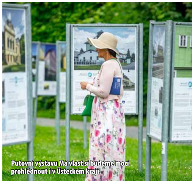
Putovní výstavu Má vlast si budeme moci prohlédnout i v Ústeckém kraji.

Celá výstava obsahuje osmdesát nových proměn ze všech krajů Česka i Slovenska a čtrnáct vítězných proměn z loňského ročníku. V něm vloni uspěly a cenu odborné poroty získaly dvě proměny na území Ústeckého kraje. Konkrétně projekty „Obnova renesanční brány Tvrze v Hrobčicích“ a „Záchrana renesančního zámku v Hrobčicích-Miřošovicích“.