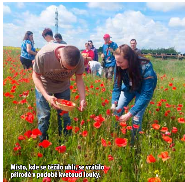
Místo, kde se těžilo uhlí, se vrátilo přírodě v podobě kvetoucí louky.

„Tato spolupráce demonstruje, jak může inovativní přístup k obnově průmyslových ploch přinést reálné výhody nejen pro životní prostředí, ale i pro komunitu,“ říká Šárka Švejkarová, ředitelka ENERGIE o.p.s. a dodává: „Sběr vlčích máků a dalších květin pro výrobu našich mýdel nejenže je skvělým příkladem ekologické