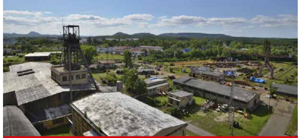
Pro své výzkumné centrum využijí vysoké školy jen část areálu. Zaměřené bude na výzkum a inovace v oblasti obnovitelných zdrojů. Vznikne v rámci projektu GET Green Energy Technologies Centre of UJEP.

Pro své výzkumné centrum využijí vysoké školy jen část areálu. Zaměřené bude na výzkum a inovace v oblasti obnovitelných zdrojů. Vznikne v rámci projektu GET Green Energy Technologies Centre of UJEP. K zemi půjde stará administrativní budova se vstupní vrátnicí i protiatomovým krytem. Místo ní tu vyroste solární park a vodíkový elektrolyzátor. Jedním partnerů projektu je i společnost Sev.en Inntech. GET tak spojuje univerzity, pracoviště akademie věd a průmyslové partnery. Zájem mají společný. Na Mostecku vybudovat základnu pro vědu, výzkum a inovace v oblasti obnovitelných zdrojů energií. „Společnost Sev.en Inntech, která je v projektu za skupinu zapojena, poskytne především plochy a zázemí pro vybudování důležitých částí projektu. Areál dolu Centrum, mimo jiné plochy v okolí stávající správní budovy, bude využit pro vybudování solárního parku. Počítá se se stacionárními panely, na nedaleké vodní ploše vzniknou plovou-