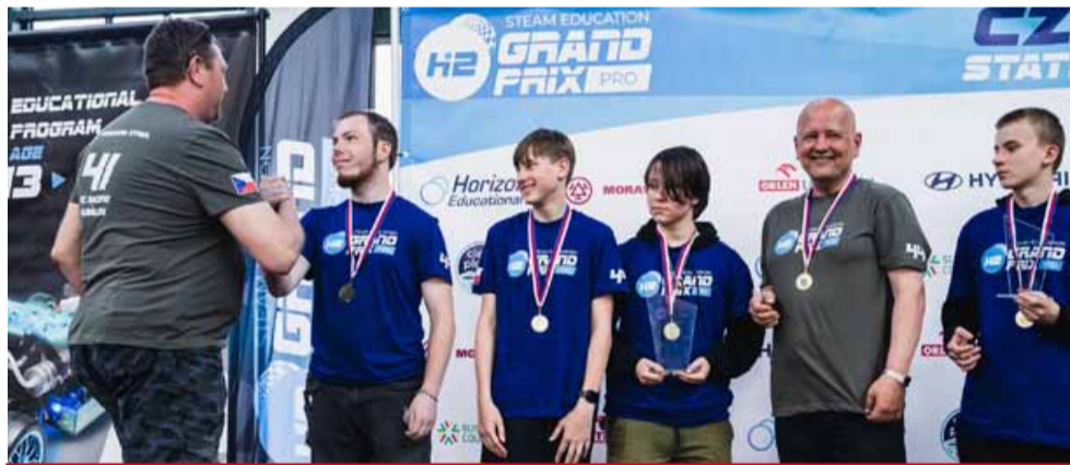
Tým HC Verva racing team z Gymnázia T. G. Masaryka Litvínov s nejvyšším počtem ujetých kol až 991 se stal celkovým vítězem.

H2 Grand Prix World Finals je největší závod RC vozíků na světě. Horizon Hydrogen Grand Prix