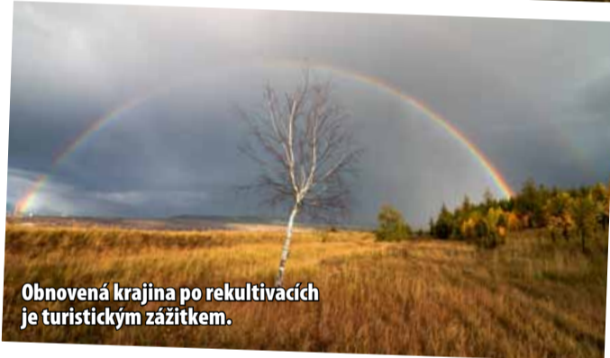
Obnovená krajina po rekultivacích je turistickým zážitkem.