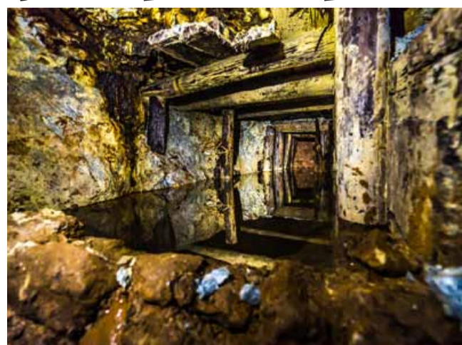
Štola v Mikulově má bohatou minulost. Více o historii a prohlídkových trasách se dozvíte na www.stola-mikulov.cz.