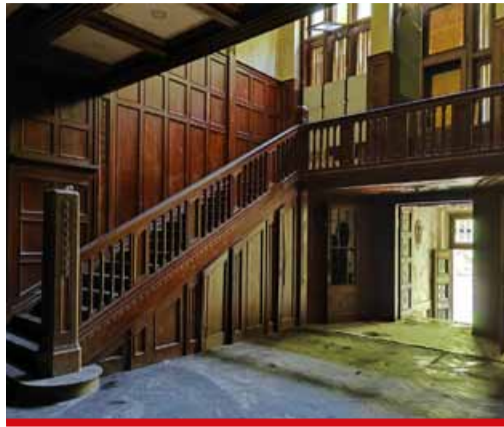
O znovuoživení vily se stará veřejně prospěšná společnost.

Jedná se již o druhou letošní brigádu. Tentokrát bude zaměřena zejména na exteriéry a na dokončování úklidu ve vile. Konkrétně se brigádníci zaměří na zahradu vily. Pokud doma naleznete kosy, křovinořezy, motorové pily... podle organizátora akce pomůžte. Rieckenovu vilu najdete na adrese Sokolská 2, Litvínov - Šumná. Drobné občerstvení bude k dispozici a pro ty odvážnější je připravena i možnost přespání ve vile. Proto spacák a karimatka s sebou! Rieckenova vila je památkově