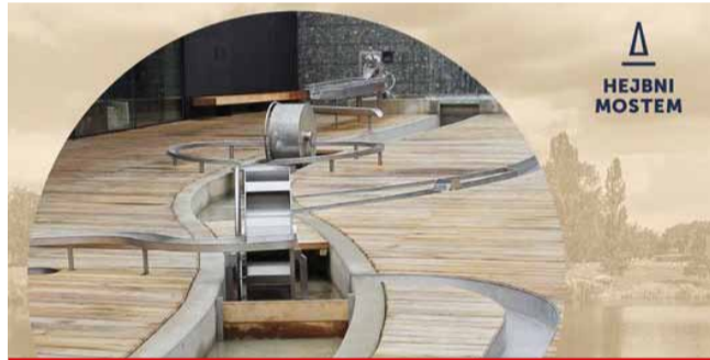
Mezi projekty, které se dočkají realizace, je například vodní hřiště na Benediktu.