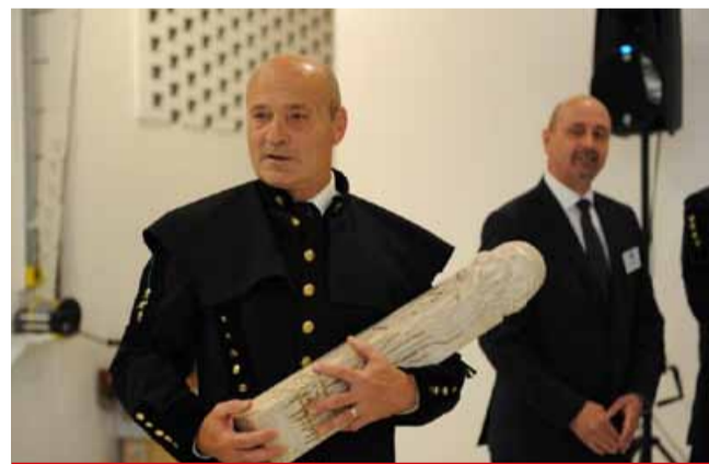
Zlatého Permona získala společnost Sev.en Inntech ze skupiny Sev.en.

Prestížní ocenění Zlatý Permon bylo zřízeno již před 20 lety Českým báňským úřadem, Odborovým svazem pracovníků hornictví, geologie a naftového průmyslu a Odborovým svazem Stavba České republiky jako projev uznání za dosažení vynikajících výsledků v oblasti bezpečnosti v hornictví. V minulosti obdržely toto ocenění i další společnosti ze skupiny Sev.en. (ink)