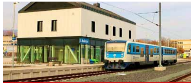
Koncem července se na trati z Litvínova do Teplic a zpět připravte na výlukou.

je vyloučena, přeprava cestujících na vozíku není garantována, přeprava kočárků je pouze do vyčerpání kapacity, přeprava cestujících v 1. vozové třídě není zajištěna. Více informací získáte na www.cd.cz. (nov)