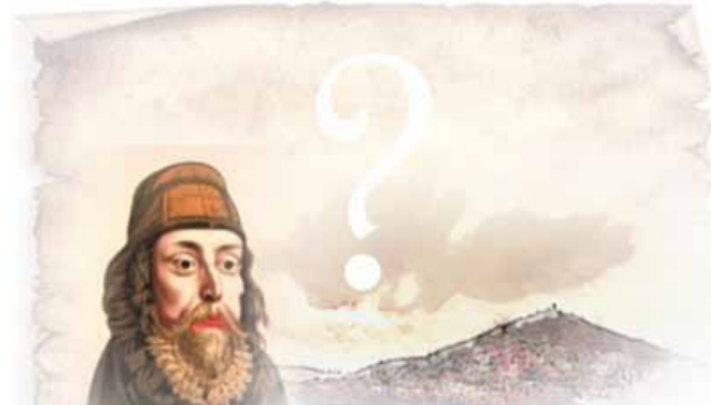
V mosteckém muzeu mohou děti zažít prázdninové dobrodružství a prolomit kletbu.