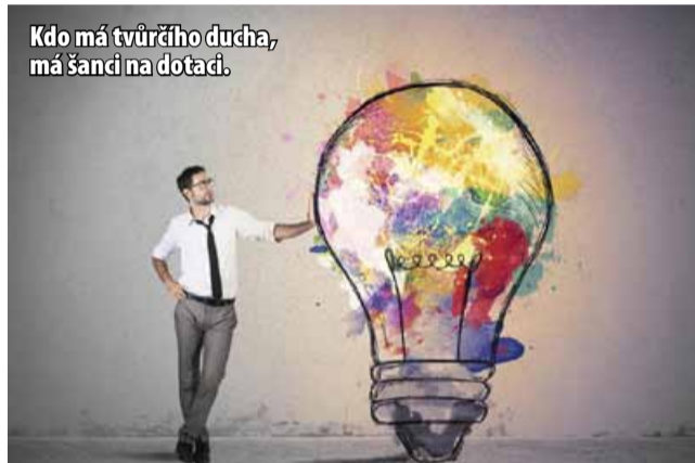
Kdo má tvůrčí ducha, má šanci na dotaci.

přechodu od uhelné ekonomiky prochází. Regionu mohou vytvářet atraktivní tvář a přinášet novátorská řešení. Podnikání založené na kreativitě má navíc velký ekonomický potenciál. Peníze jsou připraveny, teď potřebujeme podněty přímo z terénu od možných žadatelů, aby se podařilo správně nastavit podmínky dotací a ty byly využity efektivně,“ uvedl náměstek hejtmána