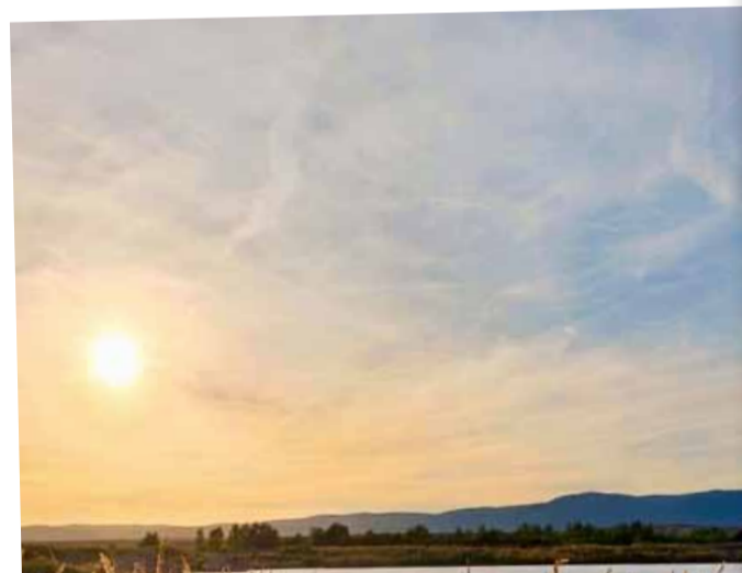
Uhelné safari má více jak desetiletou tradici.