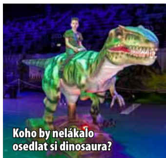
Koho by nelákalo osedlat si dinosaura?

Akce Dino Expo & Show nabídne po oba víkendové dny vždy od 10 do 18 hodin pestrý zážitek pro děti i pro rodiče. Uvidíte pohybující se dinosaury, živého dinosaura, dinosauří skútr, ježdění na dinosaurech, mazlení dětské dino, dokumentární film, dětský film, popisy, skákací hrady, žijící pavouky, štirý a hmyz.