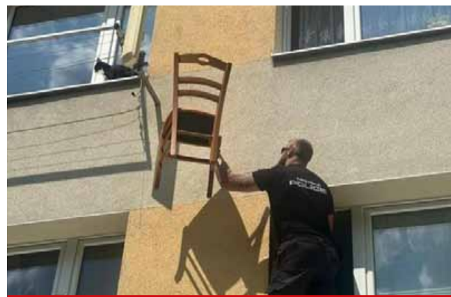
Záchrana se blíží...

Kočka ale nabídku a vlnidné slovo strážníka ignorovala. Strážníci proto požádali o pomoc hasiče. Ti na místo dorazili s výsokozdvíhací plošinou. Pokusili se kočku odchytnout za pomoci žebříku a odchytnové tyče. Ani to však neklaplo. Hasiči nakonec za pomoci planžety otevřeli okno, což bylo přesně to, jak si kočka svoji záchranu představovala. Ihned vlezla do bezpečí bytu a hasiči následně okno za kočkou opět zajistili. (sol)