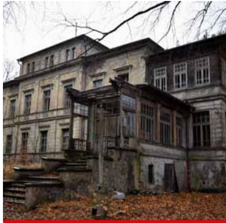
Vila je sice nepřístupná, ale ne zcela opuštěná.

chráněná budova v Litvínově. Je součástí areálu bývalé textilní továrny Marbach & Riecken, je-