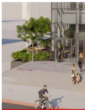
Už za pár dnů usedne před mosteckým Centralem nadživotní červený MOST-TYČÁK.