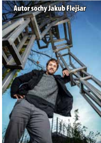
Autor sochy Jakub Flejšar

Po odhalení sochy u vchodu Centralu chystá mostecké obchodní centrum letos ještě další novinky a překvapení. Ty však prozatím zůstávají v utajení. (nov)