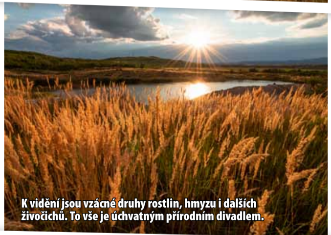
K vidění jsou vzácné druhy rostlin, hmyzu i dalších živočichů. To vše je úchvatným přírodním divadlem.