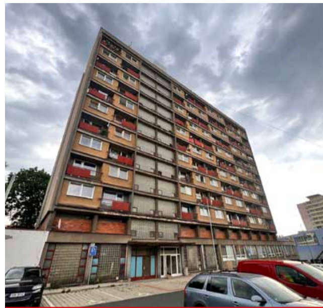
Na přetřes se dostala i velmi neutěšená situace kolem hotelového domu.

álních zařízení, kuchyňských linek apod. Byty předávají novým nájemníkům k užívání nově vymalované. V plánu mají také dokončení oprav bývalé Hvězdy v ulici Valdštejnská čp. 2126, 2127,“ prozradila Květuše Hellmichová. Na přetřes se dostala i velmi neutěšená situace kolem hotelového domu v ulici Mosbíl rychlou nápravu současného neutěšeného stavu,“ upozornila místostarostka. Diskuse se točila také kolem tématu vylepšování podmínek pro bydlení nájemníků. „Společnost pokračuje v rekonstrukcích prázdných bytů v Litvínově, především soci-