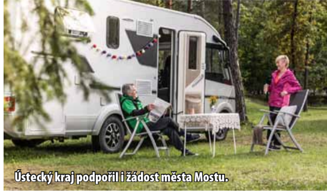
Ústecký kraj podpořil i žádost města Mostu.

hodobé úsilí města Mostu o rozvoj cestovního ruchu na rekultivovaných plochách po těžbě uhlí a vhodně doplňuje stávající infrastrukturu u jezera Matylda. Druhý projekt se podobá prvnímu a cílí na vytvoření parkovacích míst pro karavany ve městě Terezín. Tento projekt přímo navazuje na projekt Ústeckého kraje Recapture the Fortress Cities z programu Interreg Europe a zapadá do dlouhodobé snahy o revitalizaci Terezínské pevnosti. Další projekt počítá se zří-