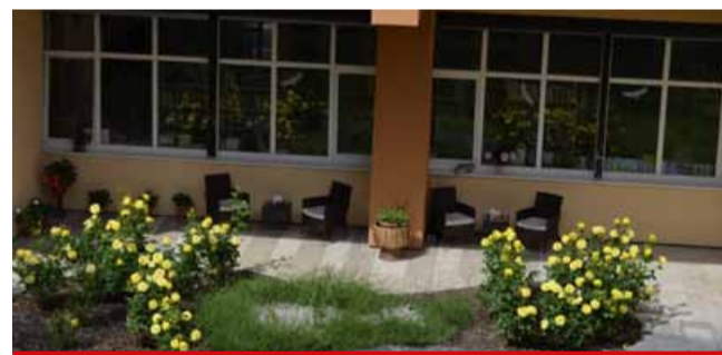
V mezibořské knihovně můžou spokojeně relaxovat čtenáři i nečtenáři.