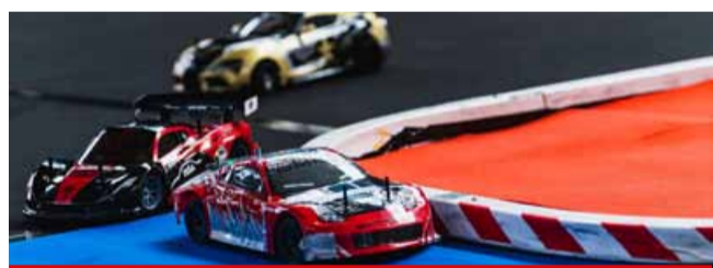
Perfektní řídicí dovednosti a rychlost nestačí. V závodech H2GP záleží na počtu ujetých kol v šestihodinovém klání, ovšem s omezeným množstvím energie uložené ve vodíku.

díkových aut na světě. Horizon Hydrogen Grand Prix