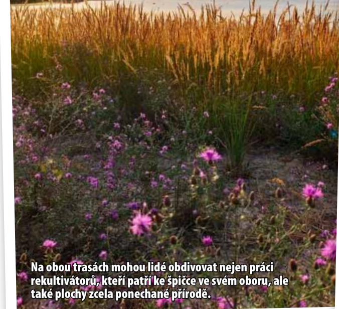
Na obou trasách mohou lidé obdivovat nejen práci rekultivátorů, kteří patří ke špičce ve svém oboru, ale také plochy zcela ponechané přírodě.