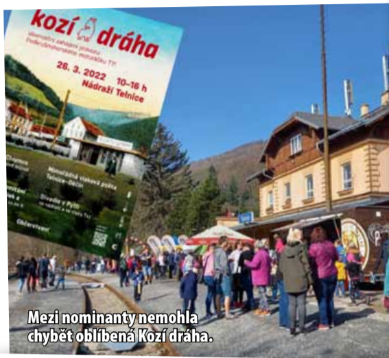
Mezi nominanty nemohla chybět oblíbená Kozí dráha.