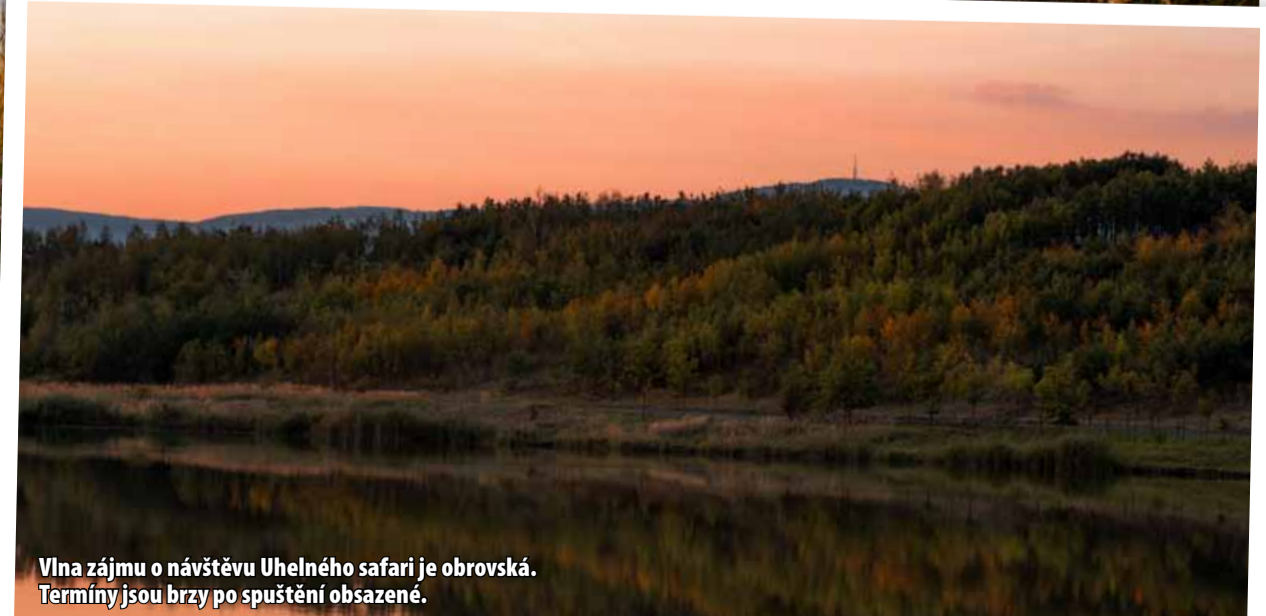
Vlna zájmu o návštěvu Uhelného safari je obrovská. Termíny jsou brzy po spuštění obsazené.