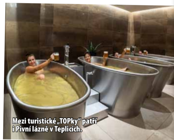
Mezi turistické „TOPky“ patří i Pivní lázně v Teplících.