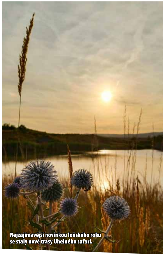
Nejzajímavější novinkou loňského roku se staly nové trasy Uhelného safari.