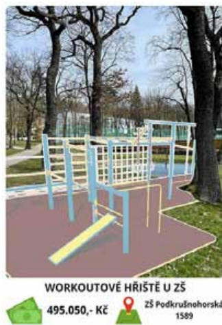
WORKOUTOVÉ HŘIŠTĚ U ZŠ 495.050,- Kč ZŠ Podkrušnohorská 1589

Z 1. ročníku není zatím realizován amfiteátr, z 2. ročníku molo na Pilařském rybníku. V obou případech se řeší problém s dodavateli. „Amfiteátr by se měl stihnout ještě letos. Největší problém jsme měli s molem na Pilařském rybníku, tady se situace ještě řeší,“ doplnil místostarosta. V souvislosti s okolím Pilařského rybníka také připomněl,