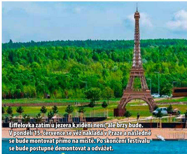
Eiffelovka zatím u jezera k vidění není, ale brzy bude. V pondělí 15. července se věž nakládá v Praze a následně se bude montovat přímo na místě. Po skončení festivalu se bude postupně demontovat a odvázet.

MOST - Olympijský festival na jezeře Most se koná od 26. července - 11. srpna. Otevírací doba je v pátek 26. července od 14 do 21 hodin, dále pak od neděle do čtvrtka od 9 do 19 hodin a od pátku do soboty vždy od 9 do 21 hodin.