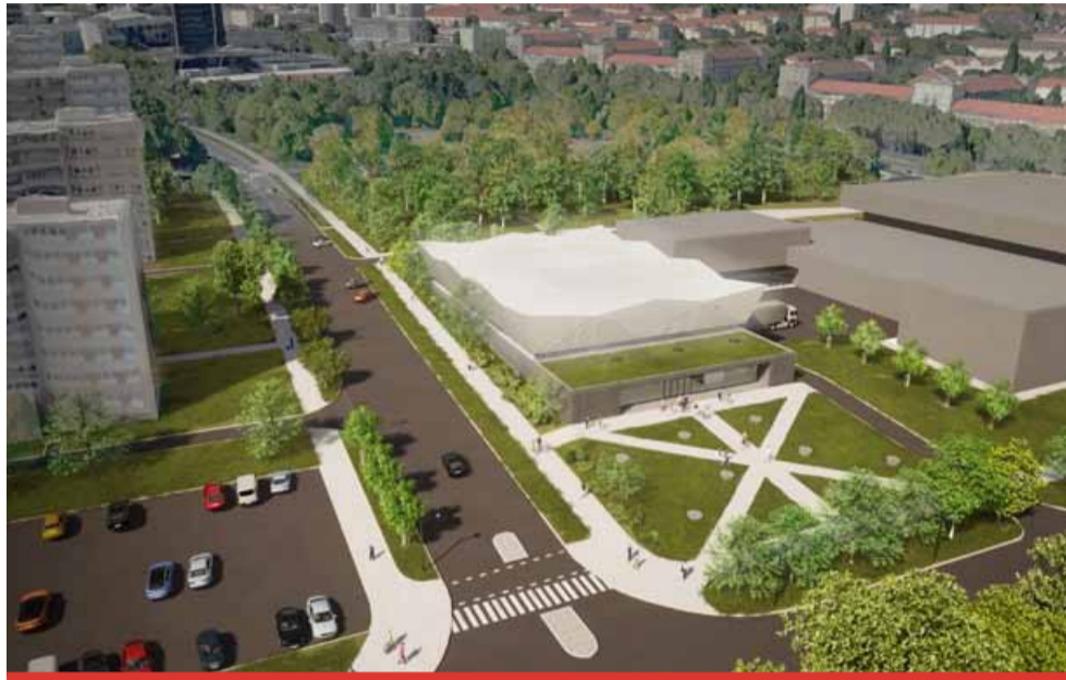
Nové sportovní hale bude dominovat netradiční konstrukce. Střecha by měla mít atypický tvar připomínající královské korunky.

Nová sestra stávající sportovní haly vyroste hned v jejím sousedství, na místě hlídaného parkoviště. „Počítáme s tím, že se udělají některá opatření a omezení. Celá tato část bude staveniště, které bude oplocené směrem k parku. Projekt nového parku Střed byl už v souladu s projektem nové sportovní haly,