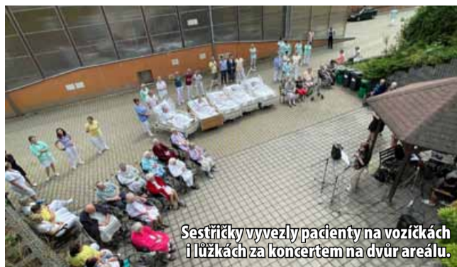
Sestřičky vyvezly pacienty na vozíčkách i lůžkách za koncertem na dvůr areálu.

ležitostech. Pacienti si koncert pod širou oblohou skvěle užili, a někteří si s vystupujícími dětmi dokonce i společně zaspívali. „Pilotní akce se moc vydařila a již na zářij je plánován další koncert, tentokrát nejspíše ve stylu dechovky,“ komentuje personál rehabilitačního oddělení. (nov)