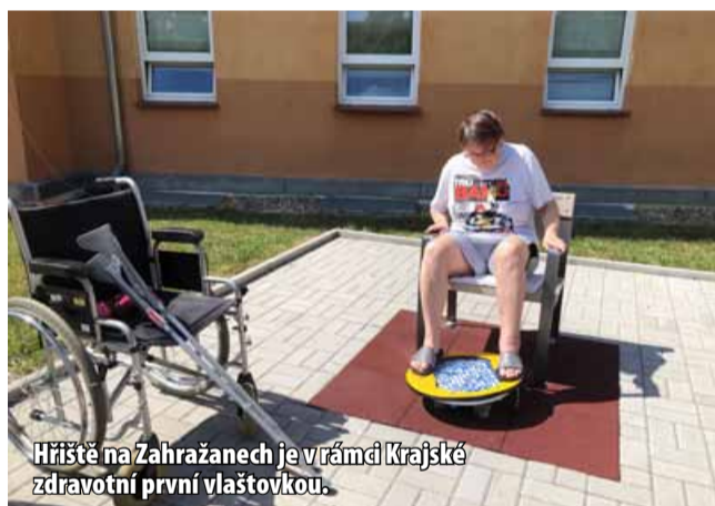
Hřiště na Zahražanech je v rámci Krajské zdravotní první vlastovkou.