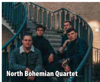
North Bohemian Quartet