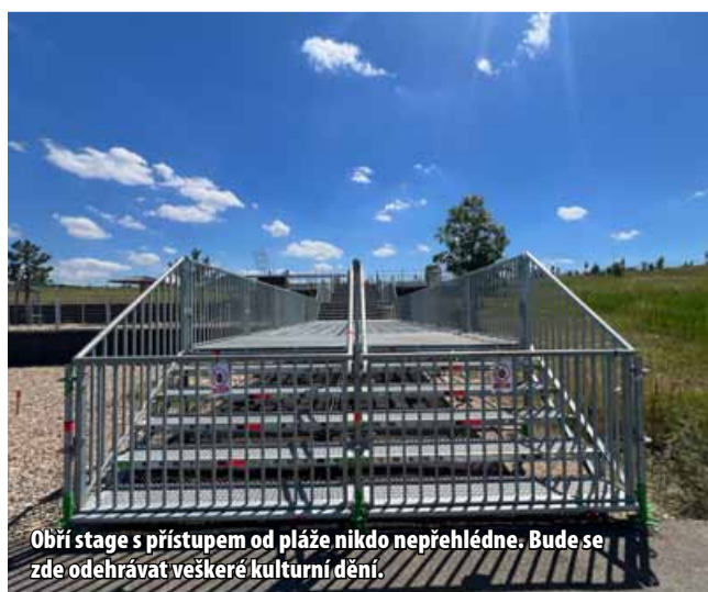
Obří stage s přístupem od pláže nikdo nepřehlédne. Bude se zde odehrávat veškeré kulturní dění.