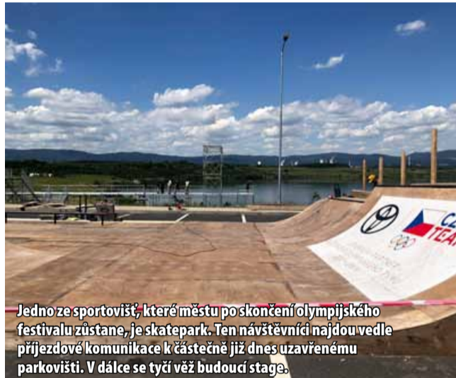
Jedno ze sportovišť, které městu po skončení Olympijského festivalu zůstane, je skatepark. Ten návštěvníci najdou vedle příjezdové komunikace k částečně již dnes uzavřenému parkovišti. V dále se tyčí věž budoucí stage.