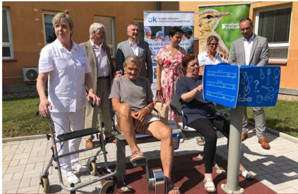
Výstavba hřiště začala vloni v říjnu. Venkovní stroje jsou odolné vůči povětrnostním vlivům, snadno ovladatelné a bezpečné. Jediným způsobem umožňují klientům cvičení na čerstvém vzduchu. Celková cena fyzioterapeutického hřiště je 349 tis. Kč bez DPH.

„Krajskou zdravotní podporujeme dlouhodobě. V uplynulých letech jsme společně realizovali několik projektů, které měly za cíl zlepšit zdravotnickou péči v regionech, kde podnikáme. Mimo jiné jsme například podpořili modernizaci porodnice a neonatologického oddělení. Uroveň