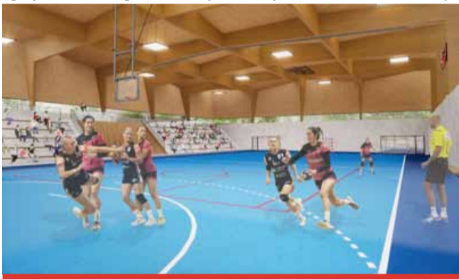
Nová hala bude určena zejména pro tréninky všech halových sportů, pro školky i dorostence, kteří nyní chodí do velké haly.

Nové sportovní hale bude dominovat netradiční konstrukce. Střecha nové haly by měla mít atypický tvar připomínající královské korunky, jako symbol spojení královské historie města a současné sportovní výjimečnosti místních házenkářek – královen házené. Obě haly budou propojeny spojovací chodbou. Nová hala nabídne prostor pro zhruba 300 diváků. Bude menší než hala současná a energeticky výrazně úspornější. „Budeme ji moci využívat pro tréninky všech halových sportů, pro školky i dorostence, kteří nyní chodí do velké haly. Nebude se tak vytápět zbytečně prostor s hlediskem pro 1 300 diváků. Její výhodou bude také to, že se bude dávat přepažit. Součástí bude také nová posilovna, šatny i zázemí pro diváky,“ vyjmenoval ředitel Sportovních areálů Most Petr Formánek. (sol)