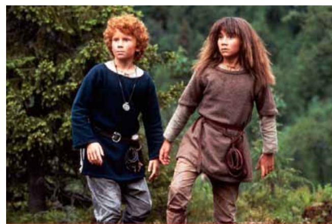
Pohádku Ronja, dcera loupežníka znají děti z televize.