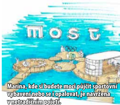
Marína, kde si budete moct půjčit sportovní vybavení nebo se i opalovat, je navržena v neustředěném pojetí.