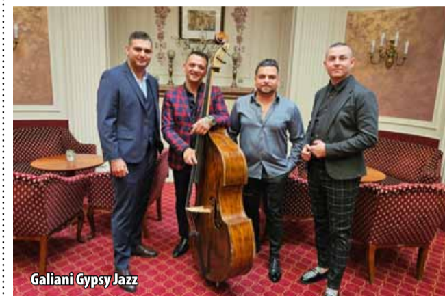
Galiani Gypsy Jazz