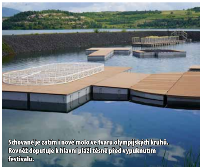
Schované je zatím i nové molo ve tvaru olympijských kruhů. Rovněž dopluje k hlavní pláži těsně před vypuknutím festivalu.