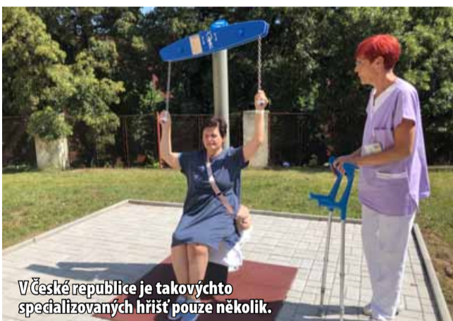
V České republice je takovýchto specializovaných hřišť pouze několik.

Na venkovních strojích bude možné provádět jak pohybovou, tak neurologickou terapii. Cvičení má pozitivní vliv na zlepšení kognitivních procesů a také procvičuje koordinaci ruka-oko. Tento typ koordinace je zodpovědný za správný odhad vzdáleností a umožňuje přesně a cíleně plánovat a provádět pohyby.