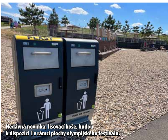
Nedávná novinka, lisovací koše, budou k dispozici i v rámci plochy olympijského festivalu.