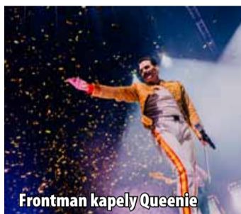
Frontman kapely Queenie