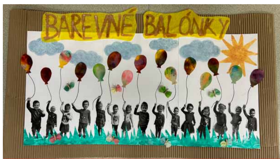
Děti s paními učitelkami vytvářely dílo několik týdnů, ale stálo to za to!