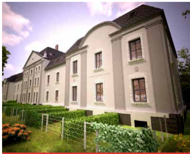
Vize po rekonstrukci. Na zachování vzhledu budou dohlížet památkáři.

mohou ke zlepšení kvality života klientů. Profesionální personál bude zajišťovat individuální přístup a bezpečné prostředí, ve kterém se budou klienti cítit pohodlně a respektovaně.