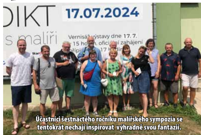
Účastníci šestnáctého ročníku malířského sympozia se tentokrát nechají inspirovat výhradně svou fantazií.

MOST – Návštěvníci Benediktu mají opět možnost nahlédnout pod ruce umělců při malířském sympoziu. To je od roku 2009 jednou z nejvýznamnějších událostí Mostecká v oblasti moderního umění. Tradičním partnerem akce je Sev.en Česká energie, která mladé umělce při jejich tvorbě na Benediktu podporuje každé léto.