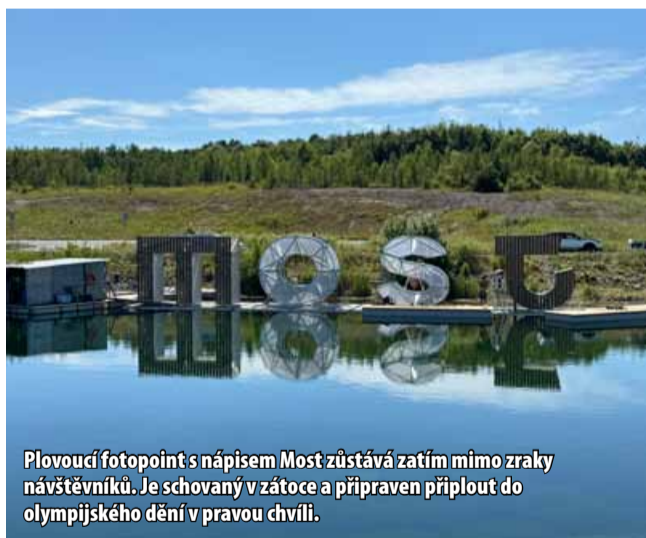
Plovoucí fotopoint s nápisem Most zůstává zatím mimo zrak návštěvníků. Je schovaný v zátocce a připraven připlout do olympijského dění v pravou chvíli.