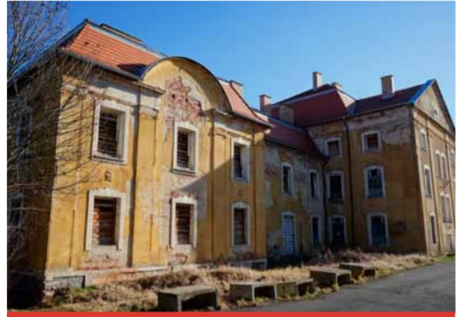
Po odchodu vojáků se objekt dostal do soukromých rukou. Takový je výsledek.

Do rekonstrukce památkově chráněného objektu, který byl poslední roky prázdný, se pustila Charita Most. Ta objekt koupila od soukromého vlastníka v roce 2021. Od té doby probíhaly přípravy na rozsáhlou rekonstrukci. V rámci ní se vytvoří zázemí přípravy na rozsáhlou rekonstrukci.