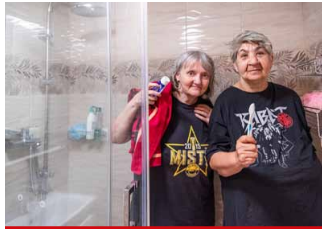
Díky daru Severočeské teplárny si dvě kamarádky, uživatelky chráněného bytu v Meziboří, mohou užívat novou koupelnu.

Tento malý zásah však zásadním významem ovlivnil život dvou uživatelek, které ještě budou moci několik let setrvat v tomto chráněném bytě společně bez výraznější péče. ENERGIE o.p.s. v Meziboří je dlouholetý poskytovatel sociální služby Chráněné bydlení, určené osobám s mentálním postižením nebo dlouhodobým duševním onemocněním. (ink)