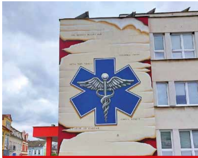
Murály na poliklinice vznikly během festivalu Carola Art Session, jehož zakladatelem je výtvarník a jeden ze tří autorů maleb Filip Ungr.