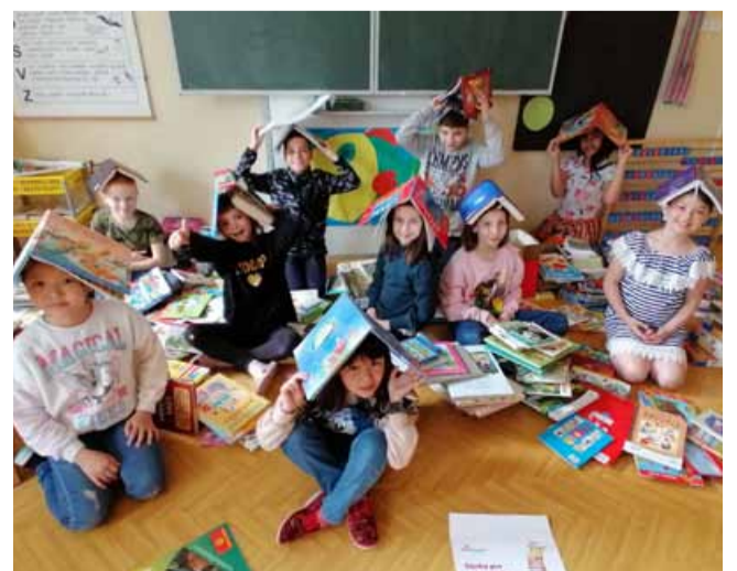
Když se do pomoci pustí děti, výsledek je úžasný a ještě s překvapením.

bou vybraly dokonce 8 krabic plných knih. Dalším překvapením pro nás byl také nápad dětí ze Základní a mateřské školy z Bečova u Mostu, které pro nemocné děti vytvořily vlastní omalovánky s příběhem a hlavolamem. Mezi darovanými knihami jsme také našli fotografii malé holčičky se vzkazem do Motola: „Jste v nejlepších rukou a dá se to zvládnout, i já to dokázala. Přeji všem do Motola hodně sil a trpělivosti“, neskrývají radost pracovníci nadace a všem děkují za zapojení do sbírky. (nov)