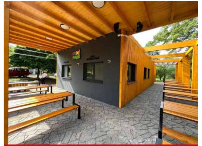
FUNPARK láká více lidí i díky novému sociálnímu zázemí a nové zastřešené terase s občerstvením, které tu letos otevřely sezonu a prošly už zatěžkávací zkouškou.

Mezi další „vychytávky“ FUNPARKu, které ocenili návštěvníci zejména v červenci