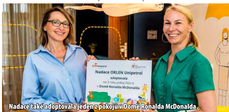
Nadace také adoptovala jeden z pokojů v Domě Ronald McDonalda.

Unipetrol adoptovala jeden z jednadvaceti pokojů na dobu tří let. K pomoci se také přidala ORLEN Benzina, která rodinám a personálu přivezla potřebnou energii ve formě produktů Stop Café „Pro děti jsme přivezli knížky ze zaměstnanecké sbírky ORLEN Unipetrol i omalovánky a hlavolamy vytvořené žáky ze Základní a mateřské školy z Bečova u Mostu. Pro rodiny připravujeme i zábavně vzdělávací aktivity, se kterými do Domu Ronald McDonald přijedeme na podzim,“ informuje nadace. (nov)