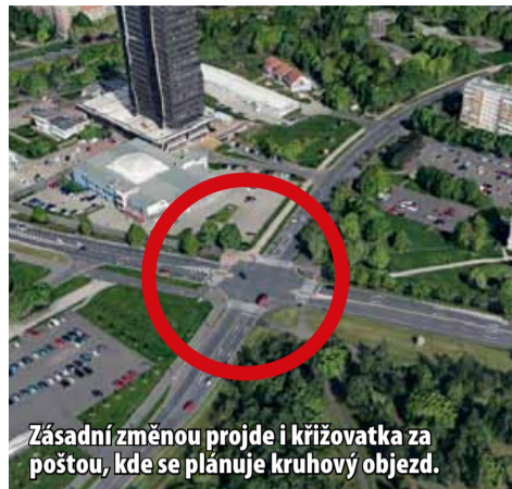
Zásadní změnou projde i křižovatka za poštou, kde se plánuje kruhový objezd.