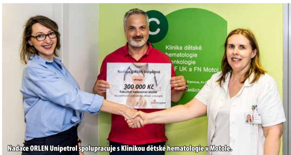
Nadace ORLEN Unipetrol spolupracuje s Klinikou dětské hematologie v Motole.

V rámci spolupráce s motolskou nemocnicí chtěl přidat každý pomocnou ruku, a proto nadace ve společnosti ORLEN Unipetrol uspořádala sbírku knih, omalovánek a pastelek. Společnost ORLEN Benzina poslala na kliniku potřebnou energii ve formě občerstvení produktů STOP Café pro nemocné děti i jejich rodiče nebo lékaře a sestřičky. „My z Nadace jsme podpořili zdravotnický personál částkou 300 tis. Kč, které