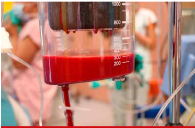
Díky technologiím Krajské zdravotní byla operace možná i bez nutnosti použití krevních derivátů.