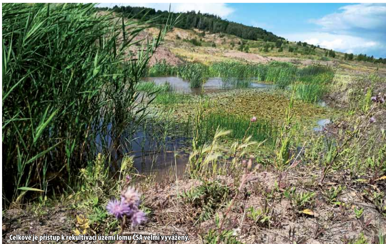
Celkově je přístup k rekultivaci území lomu ČSA velmi vyvážený.

Ihned po ukončení těžby v lomu ČSA začnou rekultivační práce a také příprava území vyčleněného pro přírodě blízkou obnovu. V okolí budoucího jezera a celého bývalého lomu vzniknou cyklostezky a turistické cesty, které toto území propojí s oblastí zámku Jezeří a dalším okolím. K tomu poslouží i část stávajících cest v lomu. Agentura ochrany přírody a krajiny ČR uvažuje také o vzniku návštěvnického centra – Domu přírody, naučné stezky pro děti a pozorovatelny nebo vyhlídek. Návštěvníci totiž nejsou při dodržování základních pravidel pro pohyb v přírodě pro ekologickou obnovu krajiny žádným rizikem a nabídne se jim tu jedinečná možnost k zajímavým a poučným procházkám či cyklovýletům. Ekologové ubezpečují, že při přírodě blízké obnově krajiny se není třeba obávat ani velkého výskytu nepůvodních invazivních rostlin – jednoduše proto, že se jim v bývalých lomech nedaří a není tu pro ně vhodná půda. Poroste tu prostě jen takové rostlinstvo, kterému místní podmínky vyhovují.