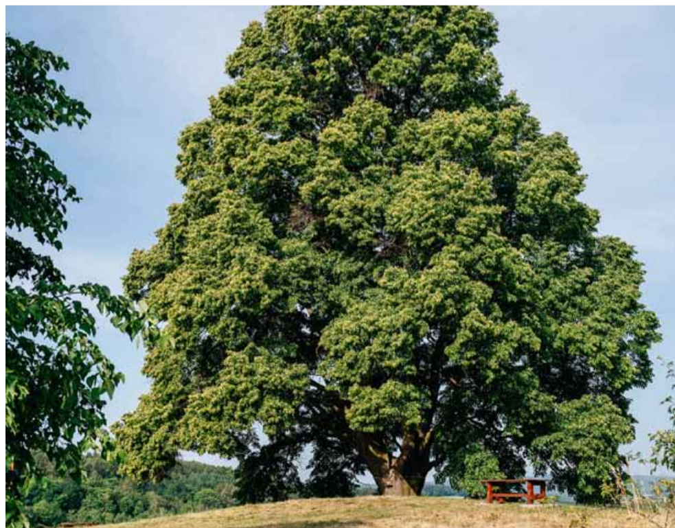
Památná lípa s červeným srdcem se nachází na pahorku na kraji obce.