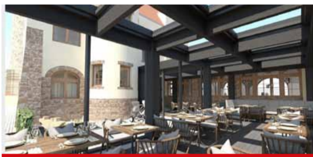
Novinkou bude venkovní terasa, která bude fungovat jako zimní zahrada.