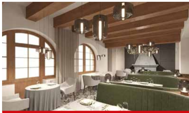
Restaurace bude v původních prostorách, dispozičně se ale změní.

Restaurace by měla být v původních prostorách, dispozičně se ale změní. Novinkou bude venkovní posezení na terase, které bude variabilní a v době špatného počasí bude fungovat jako zimní zahrada. Změnou projde také ubytování. Kdy ale bude možné se na hradě uby-