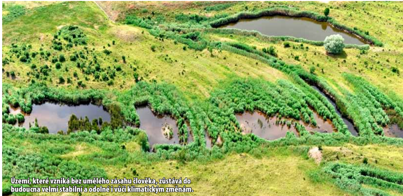
Území, které vzniká bez umělého zásahu člověka, zůstává do budoucna velmi stabilní a odolné i vůči klimatickým změnám.

Dosud byly všechny plochy po těžbě uhlí rekultivovány klasicky – vznikly na nich jezera, louky, zeleň, sady nebo stavby jako třeba mostecký autodrom. Je ostatně v této oblasti na co navazovat – česká rekultivační škola patří ke světové špičce. Ale postupem doby se zjistilo, že pokud se příroda ponechá svému osudu, poradí si velmi rychle sama a vznikne velmi cenné území s rozmanitou skladbou rostlin a živočichů, kteří se jinde nevyskytují. To je značný rozdíl v porovnání s běžnou rekultivací, kde žijí vesměs všudypřítomné a běžné druhy živočichů i rostlin. A protože toto území vzniká bez umělého zásahu člověka, zůstává do budoucna velmi stabilní a odolné i vůči klimatickým změnám. Modernější přirozená obnova krajiny, ve které má hlavní slovo příroda, dostane prostor v okolí budoucího jezera, které zaplní důlní jámu lomu ČSA mezi obcemi Vysoká Pec a Horní Jiřetín, na dohled zámku Jezeří. Celkem se jedná o zhruba 14 procent z celkové plochy lomu a jeho výsypek, tedy přibližně 10–11 km 2 .