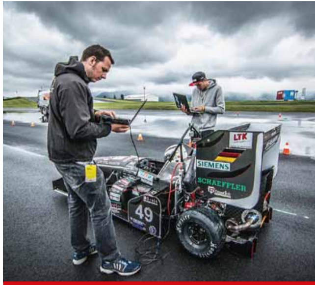
V rámci mezinárodních závodů Formula student uvidí diváci pod ruce mechaniků 60 týmů z celého světa.

Návštěvníci zaparkují zdarma, ale jen před branami autodromu či polygonu. Vnitřní travnaté plochy budou totiž sloužit jako kemp pro soutěžící týmy. Diváci mohou využít i volného vstupu do velkého stanu, který slouží jako paddock. (nov)