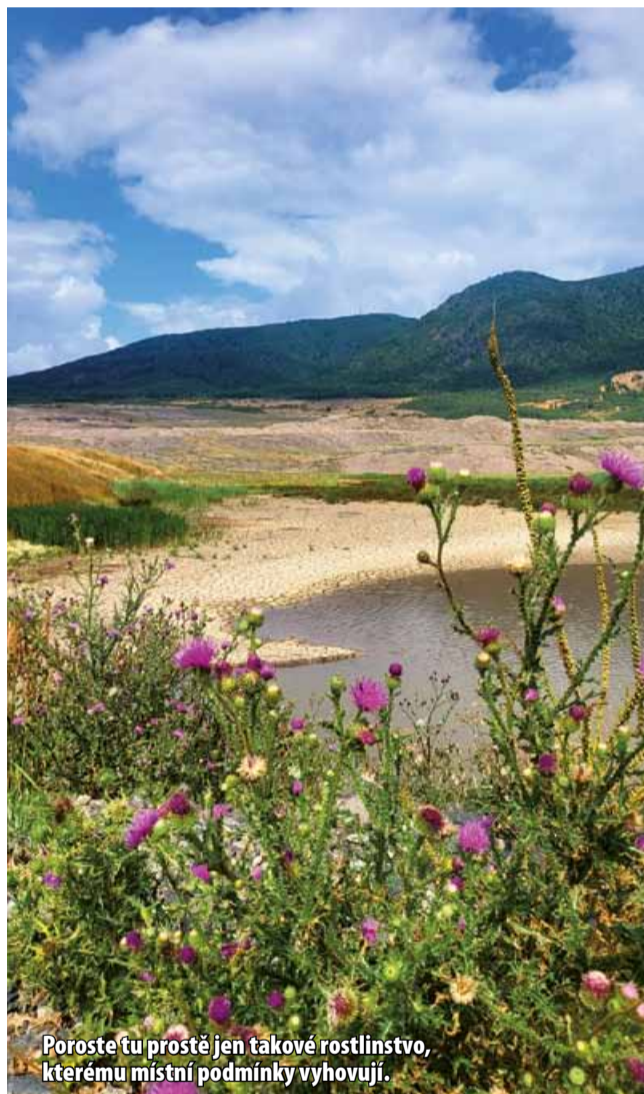
Poroste tu prostě jen takové rostlinstvo, kterému místní podmínky vyhovují.

Celkově je přístup k rekultivaci území lomu ČSA velmi vyvážený. Kromě jezera obklopeného novodobou „divočinou“, která zachová to nejcennější z přírody na Mostecku, co jinde nenajdeme, tu zhruba stejná plocha projde obvyklou rekultivací a na části někdejšího lomu vzniknou solární elektrárny. (ink)