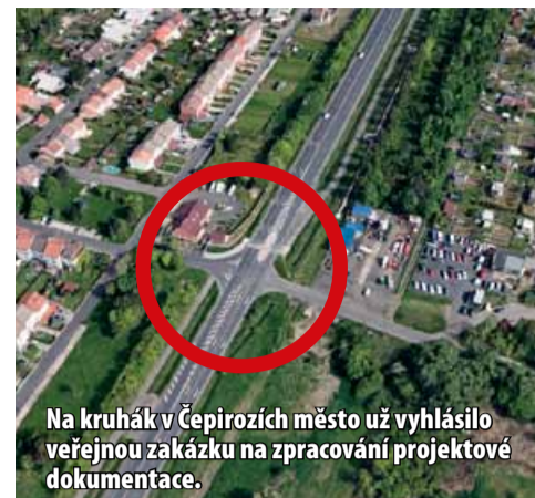
Na kruhák v Čepirohách město už vyhlásilo veřejnou zakázku na zpracování projektové dokumentace.

podotkla mluvčí. Zrušení semaforů v Bělehradské by mělo jít ruku v ruce s modernizací křižovatek ve městě a novým projektem na dynamizaci světelných křižovatek na třídě Budovatelů. Křižovatka se semaforů v Bělehradské byla jedinou, která by po zavedení dynamicky řízených křižovatek „zpomalovala“ provoz v centru města.