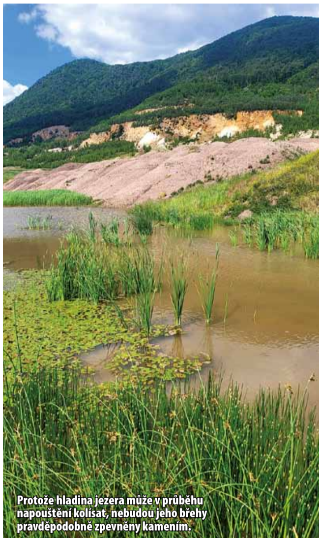
Protože hladina jezera může v průběhu napouštění kolísat, nebudou jeho břehy pravděpodobně zpevněny kamením.