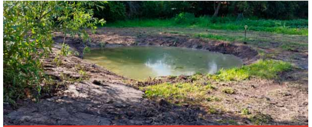
Obnova mokřadů a napajedel je nezbytné pro udržení vody v krajině a zdravý ekosystém. Současně poskytuje živočichům lepší životní podmínky a tolik potřebnou vodu v suchém regionu Mostecká.

V rámci projektu bylo identifikováno sedm lokalit, kde byly historicky přítomny tůně a mokřady. Tyto lokality byly obnoveny v úzké spolupráci s místními zemědělci a staros-