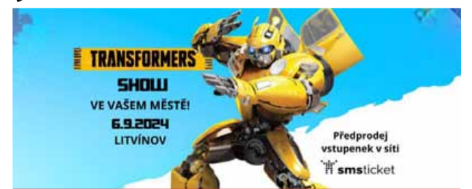
Všichni tři roboti po skončení show přijdou mezi děti a s každým se osobně pozdraví a vyfotí.