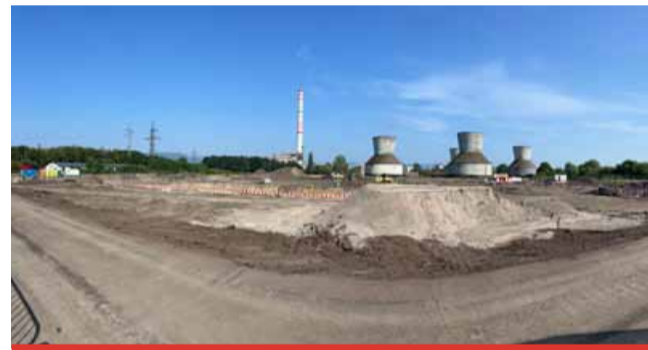
Na tomto místě se v září začne stavět. Hotovo by mělo být v roce 2027, kdy se zařízení uvede do provozu.

EVO Komořany bude schopno zhodnotit ročně až 150 tisíc tun zbytkového odpadu. Zařízení pomůže nahradit přibližně 120 tisíc tun hnědého uhlí za rok, což výrazně přispěje k redukci emisí CO 2 .