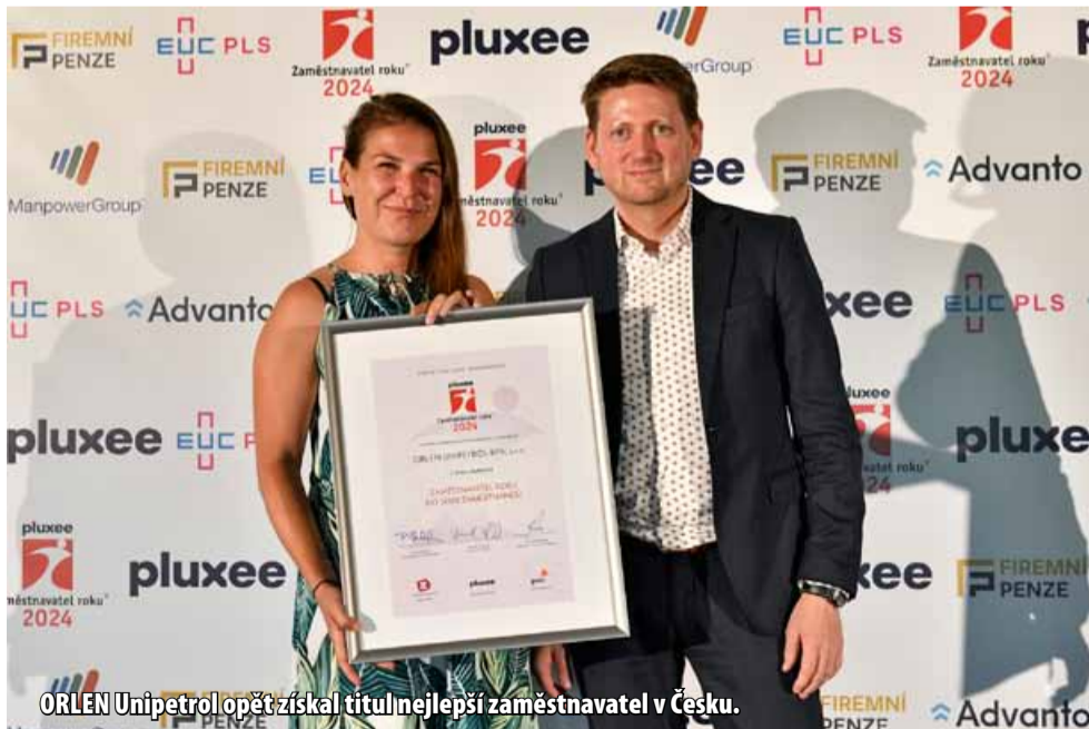
ORLEN Unipetrol opět získal titul nejlepší zaměstnavatel v Česku.

ORLEN Unipetrol se dlouhodobě zaměřuje na spokojenost