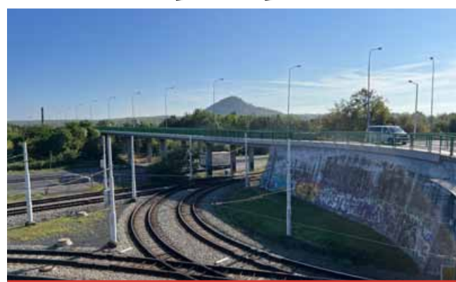
Rekonstrukce mostu odstartuje 16. září, tedy po konání Mostecké slavnosti. Od tohoto data se most uzavře pro veškerý automobilový provoz zhruba na půl roku, možná i na déle.

Most Rico se opravuje znovu po 19 letech. Slavnostně se otevřel a uvedl do provozu už v roce 2005. Při pravidelné revizi se totiž ukázalo, že není v nejlepším stavu. „Není sice v havarijním stavu, ale moc mu k němu nechybí. Zásadnější opravu už vyžaduje,“