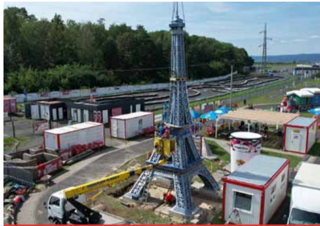
Mostecká Eiffelovka už je na novém místě. Můžete ji obdivovat v Bagrparku.

sítky tisíc fanoušků. „Jsme uzavřený areál, přičemž v otevírací době tu máme vždy nějakou obsluhu. Nemůže se tak stát například to, co se stalo městu s plovoucím fotopointem a nápisem Most. Nehrozí, že by na věž lidé lezli a mohli ji poničit. Bude tu v bezpečí a zpestřením pro lidi, protože se s ní budou moci vyfotit, pokud to třeba nestihli u jezera,“ říká jednatel Bagrparku a dodává: „Byla to ikona olympijského festivalu a je to i určitý odkaz na výjimečnou akci.“ Věž zůstane v Bagrparku již nastálo a nikam se už stěhovat nebude. „Myslím si, že je skvělé, že bude u nás, protože je to v areálu Autodromu Most, který je hojně navštěvovaný, nejen náš Bagrpark. Zejména, když se tu konají atraktivní akce typu mistrovství světa superbiků či závody trucků apod. Může ji tu tudíž obdivovat velké množství lidí,“