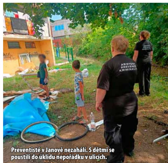
Preventistka v Janově nezahálí. S dětmi se pustili do úklidu nepořádku v ulicích.

Nový preventista spolupracuje s nízkoprahovým centrem Jaklík, které se právě na volný čas dětí zaměřuje. Na nového preventistu získalo město z dotačního programu Ústeckého kraje 384 tis. Kč. Náklady na projekt činí 549 tis. Kč. „Vnímám projekt preventisty pro volnočasové aktivity dětí a mládeže jako rozšíření práce, kterou v sociálně vyloučené lokalitě Janov děláme. Uvítali bychom, kdyby město získalo také dotaci na asistenty prevence kriminality, kteří by působili přímo ve školách. Stávající asistenti prevence kriminality se pohybují v ulicích a v okolí škol. Mnoho problémů ale vzniká během volného času mimo sa-