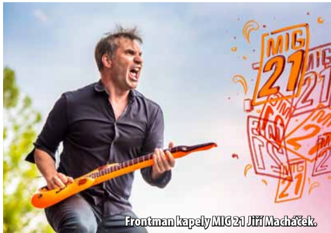
Frontman kapely MIG 21 Jiří Macháček.

V pátek 13. září zahraje kapela MIG 21, česká popová kapela, v jejímž čele stojí zpěvák a herec Jiří Macháček. Pojmenování skupiny vyjadřuje vztah ke starým a již téměř nepoužitelným letadlům, která měla původně budít strach a hrůzu. Taková má být, podle vyjádření frontmana i samotná kapela. V sobotu 21. září se můžete těšit na slovenskou rockovou kapelu z Nitry Horkýže Slíže. Skupina dvakrát získala platinovou desku. Jejich hudba je označována jako punková, punk rocková, nebo jednoduše rocková. Koncerty začínají ve 20 hodin, areál bude otevřen již od 18 hodin. Vstupenky jsou k zakoupení na www.hudbanavinicich.cz nebo na www.xticket.cz . (nov)