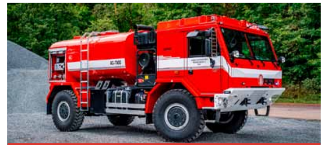
Oproti předchozímu typu, který hasiči Vršanské uhlé využívali, má nová cisterna především větší objem nádrže.

skupiny také jídelny nebo koupelny. V případě potřeby by se toto vozidlo dalo využít i jako záložní zdroj pitné vody například u větších zásahů,“ vysvětlil Bronislav Vilhelm, velitel hasičů Vršanské uhlé. Ve vozovém parku hasičů cisterna nahradí podobný vůz předchozí generace, který už je za hranicí životnosti. „Na nákupu nové cisterny jsme se dohodli se společností Servis Leasing, která pro nás nová vozidla objedná, už zhruba před rokem a půl. Protože se ale jedná o speciální vozidlo, veškeré