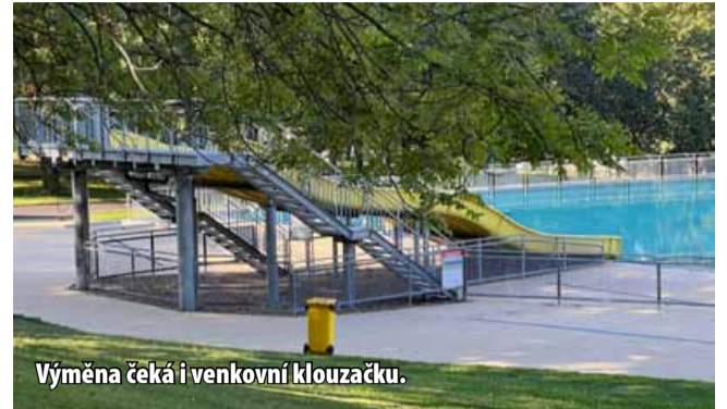
Výměna čeká i venkovní klouzačku.

stavby vodního parku se tu totiž postupně začíná projevovat zub času. V minulých letech se například vyměňovala dlažba ve vnitřním areálu a loni se kompletně změnila i vzduchotechnika. Jednalo se o zásadní opravy,