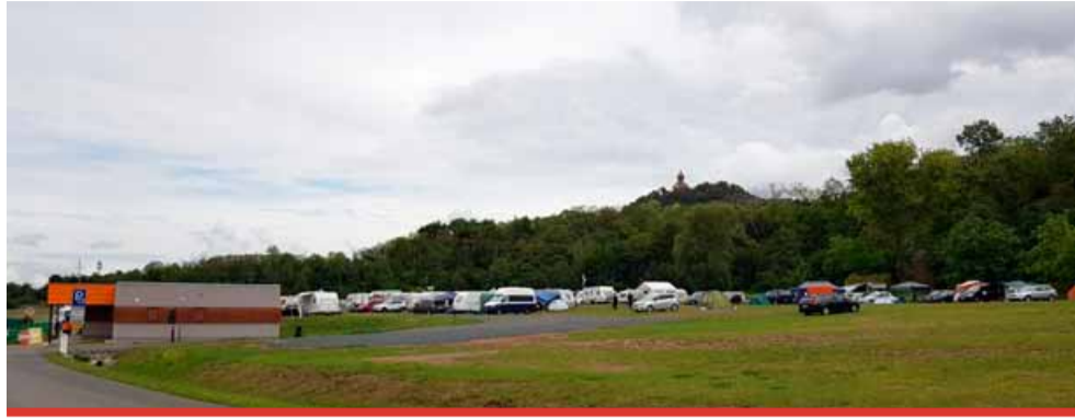
Nová stání pro karavany jsou navržena v prostoru louky stávajícího tábořiště – kempu Matylda.

Tzv. stellplatz by měl být dokončen ještě letos. „Následně proběhne kolaudace stavby a příprava provozního a návštěvního řádu. Zákazníkům by tedy mohl sloužit již na příští sezónu. Ceny za pronájem míst