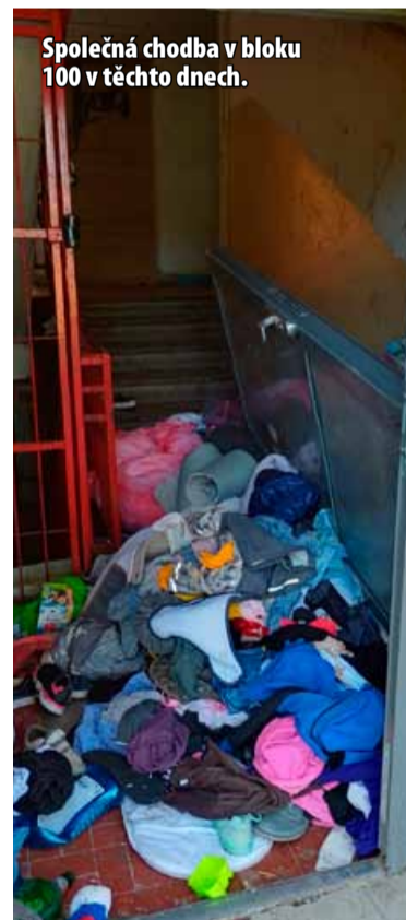
Společná chodba v bloku 100 v těchto dnech.

Poznámka pro archivní ročníky: Ban je internetový výraz pro zablokování. Tuto klatbu, zákaz, vyhoštění či vypovězení z prostředí Facebooku, sítě X a podobně uvalují majitelé té správné a jediné pravdy.