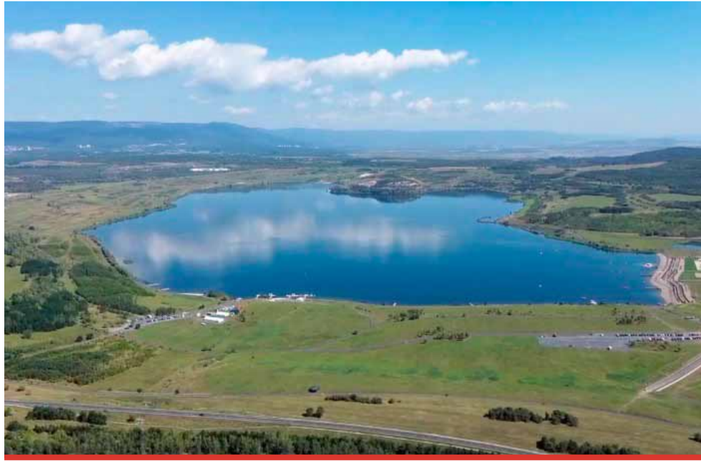
Maximální hloubka jezera Most je 71 metrů a při průměrné hloubce 22 metrů má objem 69,8 milionů metrů krychlových. Jezero je přístupné veřejnosti od 12. září 2020.

Na nedostatek vody si před hlavní sezónou postěžovalo i město Most, a to zejména kvůli nebezpečí poškození nových vodních mol a dalších atrakcí, které nechalo na vodní hladinu instalovat. „Dopouštění jezera Most závisí na klimatických podmínkách. V prvním čtvrtletí se hladina jezera vlivem pří-