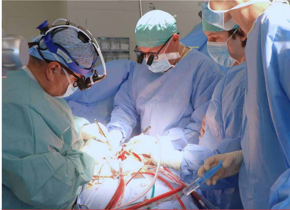
První kardiokirurgická operace v pavilonu „J“ Masarykovy nemocnice v Ústí nad Labem.