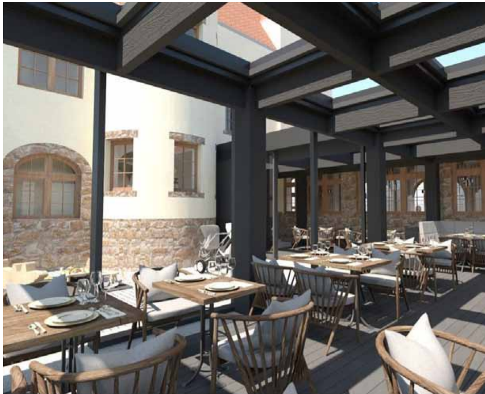
Práce na rekonstrukci restaurace budou hotovy v zimě. Nájemce, kterým je společnost Nord Food, otevře provoz až v příštím roce.

Nájemce Hněvína vybralo město s předstihem, aby mohl konzultovat projektové přípravy na restauraci a rozhodovat o tom, jak by měla restaurace vypadat. Plány byly nakonec ale jiné než skutečnost. Celou akci už od začátku provázela řada problémů. „Zhruba rok jsme se dohadovali s hasiči ohledně požární bezpečnosti budoucího záměru, takže jsme museli zpracovávat nové řešení, což akci významně posunulo. Následně se