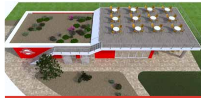
Raritou bude nová pochozí střecha, ze které bude moci veřejnost sledovat zdejší zápasy.

Sotva se však stavební práce mohly rozjet naplno, objevily se komplikace související se zdejším podloží. „Při zakládání stavby se vyskytly menší komplikace. Nejde o nic vážného. Jde