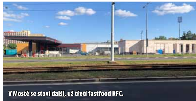
V Mostě se staví další, už třetí fastfood KFC.