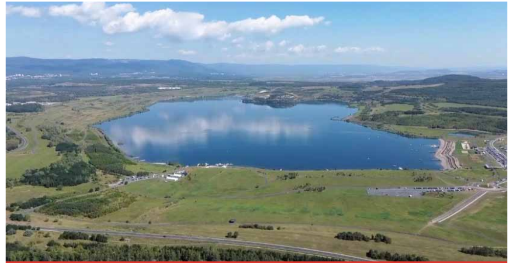
Mezi nejčistší vody patří zatopené lomy. A to i ty hnědouhelné. Pro příklad nemusíme chodit daleko. Jezero Most nabízelu vodu mimořádně čistou i na konci léta.

V Česku v posledních letech vznikly i nové koupací lokality, a to například jezera Milada, Barbora či Most, které dosa-