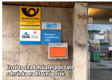
Jistě to snad má alespoň tuto schránku na hlavní poště.

Ačkoliv nalézt poštovní schránku trvá v současné době mnohem déle než dřív, docela zmizet nemohou. Jsou totiž „chráněny“ vyhláškou o jejich dostupnosti, která dosud platí.