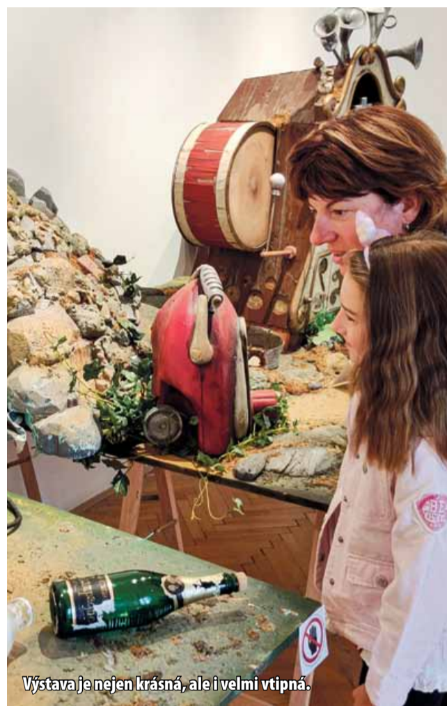
Výstava je nejen krásná, ale i velmi vtipná.