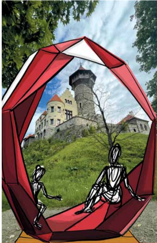
Fotopoint s lávkou na hradě Hněvín by měl být odolný, zejména po neblahých zkušenostech s fotopointem na jezeře, který lidé kvůli neukázněnosti převrátili a poničili.