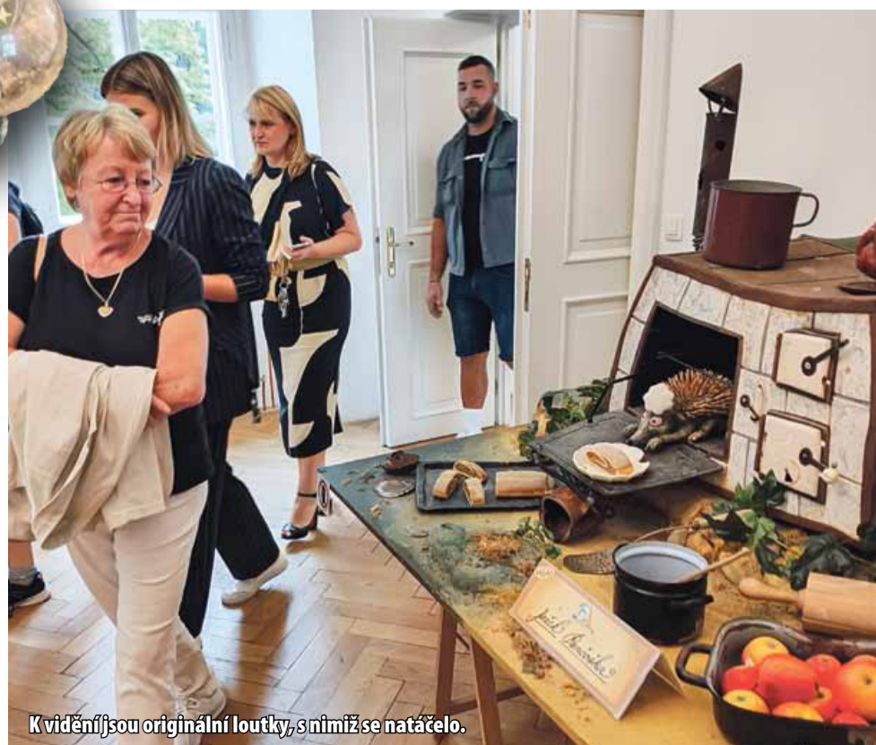
K vidění jsou originální loutky, s nimiž se natáčelo.