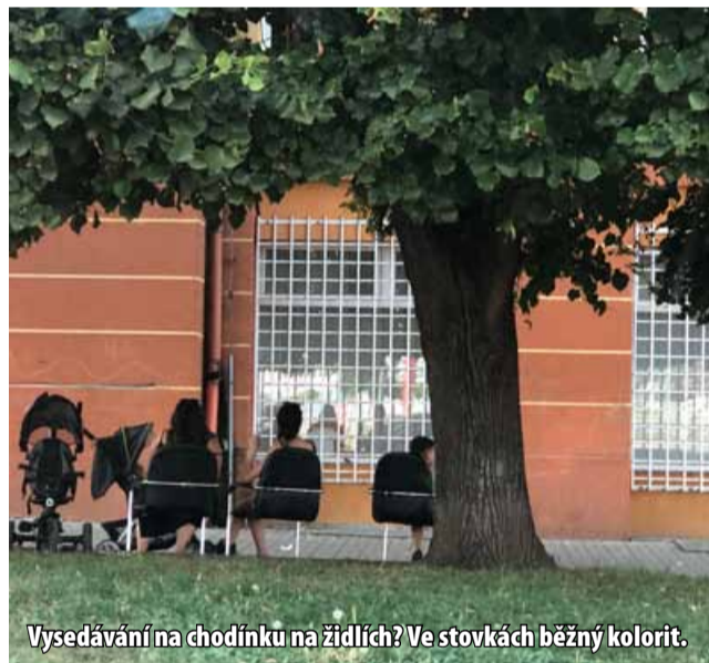
Vysedávání na chodítku na židlích? Ve stovkách běžný kolorit.