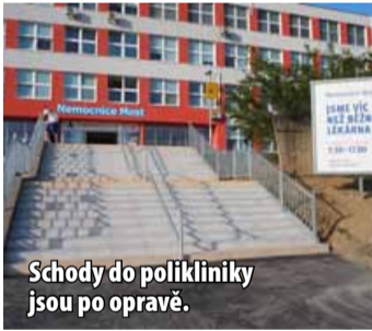
Schody do polikliniky jsou po opravě.

MOST - Od začátku července nebyl kvůli opravám možný vstup do Polikliniky Nemocnice Most hlavním vchodem. Návštěvníci museli do Polikliniky vcházet přes budovu B a bezbariéroví pacienti přes urgentní příjem. Nyní jsou již schody kompletně opravené a vchod je opět přístupný. (nov)