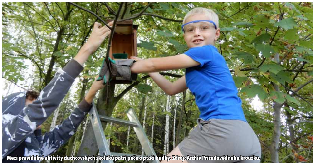
Mezi pravidelné aktivity duchcovských školáků patří péče o ptačí budky.

Během roku se děti v kroužku věnují i celé řadě dalších aktivit – v zimě nosí slunečníky do lesních krmítek nebo potírají rozpraskanou kůru starých stromů lojem. Lesním zvířátkům nosí jablka a zeleninu do přilehlých lužních lesů. „Na nedávné exkurzi na Radovesické výsypce děti hledaly otisky schránek živočichů. Na vycházkách poznávají rostliny a živočichy, se kterými se mohou v naší oblasti setkat. Ve škole mikroskopujeme, hrajeme přírodovědné hry a také organizujeme vánoční sbírku krmiva pro handicapované živočichy,“ vyjmenovává některé z aktivit Marty Hanzlíkové. Své vědomosti pak děti mohou uplatnit i při soutěžích. Jejich největším úspěchem bylo loňské druhé a letošní třetí místo v krajském kole soutěže Zlatý list. (nov)