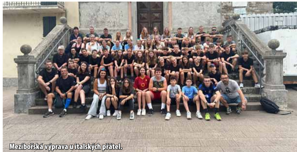
Mezibořská výprava u italských přátel.

Každoročně se výpravy ze tří partnerských měst, z Meziboří, italského Sogliana al Rubicone a německé Saydy scházejí v jednom z partnerských měst. Hostitel pro přátele připravuje kemp, soutěže a poznávací výlety. Tentokrát se týmy přátelských měst setkaly v Itálii. Vloni hostila přátele Sayda. Na Meziboří čeká hostitelská role v příštím roce. „Bude to jubilejní rok. Třicet let partnerství. Program připravujeme už dnes. Samozřejmě chceme, aby byl pestřejší, a spojíme ho s oslavami,“ uvedla místosta-