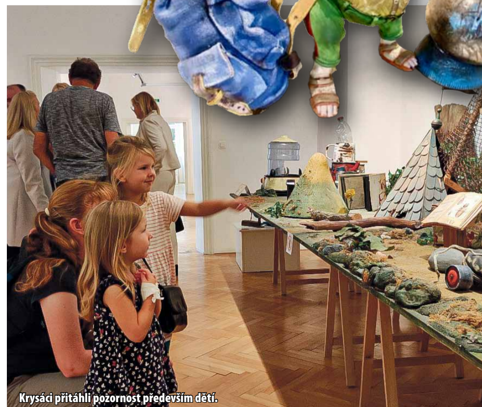
Krysáci přitáhli pozornost především dětí.