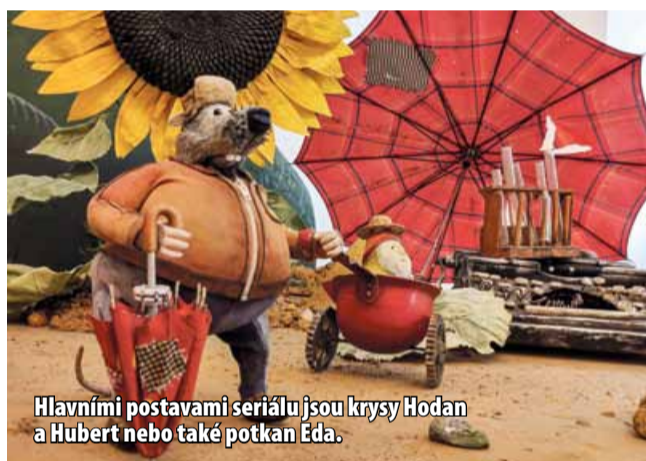
Hlavními postavami seriálu jsou krysy Hodan a Hubert nebo také potkan Eda.