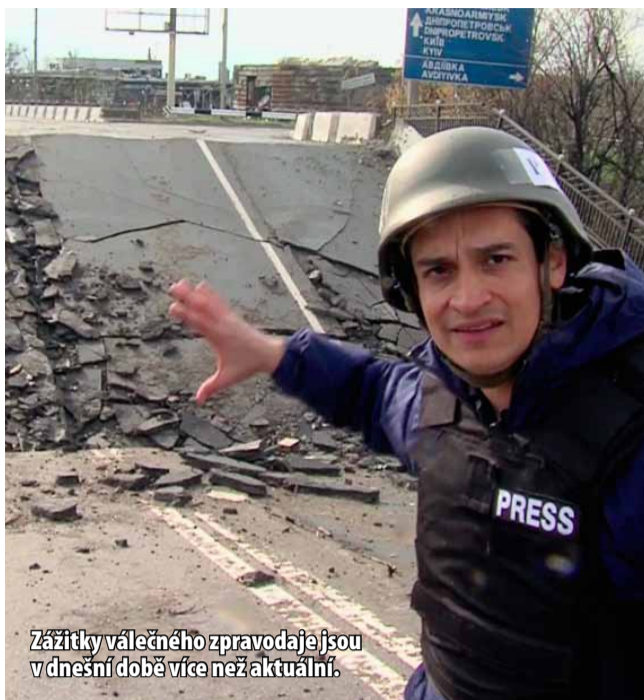
Zážitky válečného zpravodaje jsou v dnešní době více než aktuální.