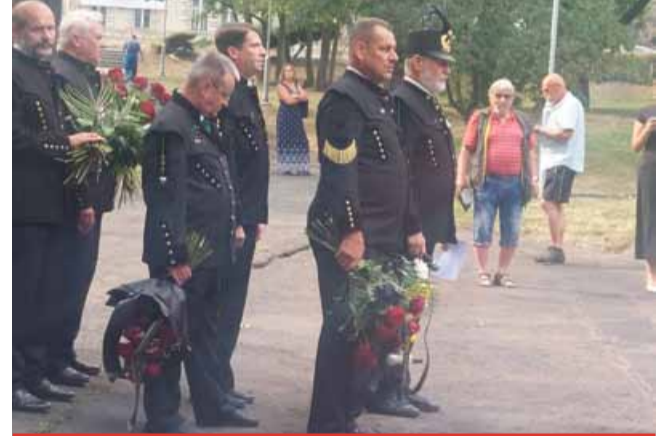
Ke všem tradičním akcím i vzpomínkovým aktům se připojují také největší těžební společnosti, na Mostecku to jsou těžební společnosti ze skupiny Sev.en Česká energie.

Na podzim připadají na Mostecku dvě smutná výročí. K havárii na Dole Pluto došlo 3. září 1981 a vyžádala si 65 lidských životů. Jedno z největších novodobých důlních neštěstí si tradičně připomíná i Klub českých turistů pořádáním turistického pochodu Memoriál Pluto, jehož součástí je i vzpomínka na oběti neštěstí v Louce u Litvínova, kde se hlubinný důl nacházel. Důl Kohinor v Lomu se zapsal do historie 14. listopadu 1946, kdy zde zahynulo 52 lidí. Tato poválečná tragédie byla