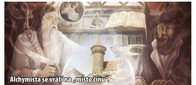
Alchymista se vrátí na „místo činu“.