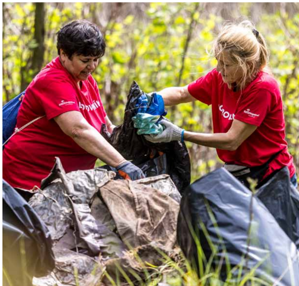
ORLEN Unipetrol je za své aktivity v oblasti udržitelného rozvoje pravidelně oceňována odborníky i širokou veřejností.

Nová zpráva navazuje na Zprávu o trvale udržitelném rozvoji za rok 2022, která informovala o dílčích krocích realizace strategie střednědobého rozvoje do roku 2030, která tvoří odrazový můstek k dosažení uhlíkové emisní neutrality, které chce skupina ORLEN Unipetrol dosáhnout nejpozději do roku 2050. „Naši hlavní motivací je efektivně využívat naše výrobní technologie a hospodářit se surovinami tak, abychom naše podnikání postupně transformovali směrem k udržitelné budoucnosti.“