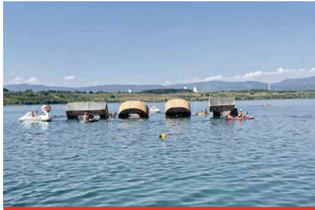
Fotopoint na jezeře Most odolal návštěvníkům jen pár týdnů.