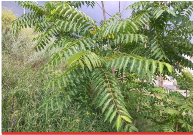
Pajasanu prakticky není možné se zbavit bez použití herbicidů.

Krajský úřad určuje způsoby, jakými je nutné pajasany odstraňovat, kdo tuto regulaci provádí a v jakých lhůtách. Na pajasany se nevztahuje ochrana dřevin podle zákona o ochraně přírody a krajiny a není tedy nutné žádat o povolení kácení. Před kácením je vždy potřeba nejprve aplikovat herbicid, nejlépe navrtáváním a injektáží do kmene. Teprve po uhybnutí dřeviny je možné ji pokácet. Zásadně nemají být pajasany káceny bez předchozí aplikace herbicidu! (nov)