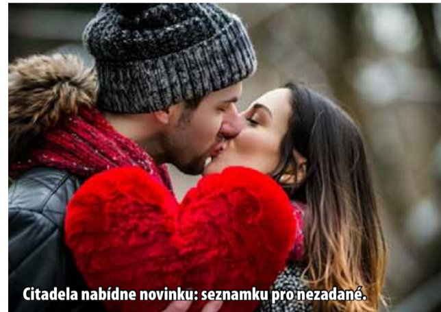
Citadela nabízí novinku: seznamku pro nezadané.

Vstupenky jsou k zakoupení v pokladně Citadely. (nov)