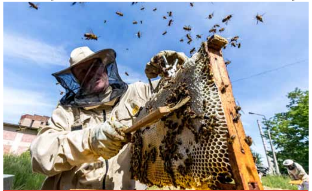
Med „firemní výroby“ plní nejen všechny normy podle odborných testů Výzkumného ústavu včelařského, ale pravidelně získává zlatou medaili nejvyšší kvality v soutěži Český med.

ORLEN Unipetrol loni investoval 490 milionů korun zejména do výstavby nové kotelny etylenové jednotky a nového zařízení pro zpracování sulfidových louhů v Litvínově. Realizoval dále projekty rekonstrukce a obnovy kanalizačních a slopových systémů v rafinéri-