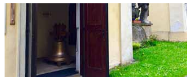
Panna Maria čeká na požehnání a na jeřáb.