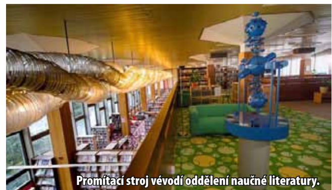
Promítací stroj vévodí oddělení naučné literatury.

Více na webu planetária: http://www.planetariummost.cz (nov)