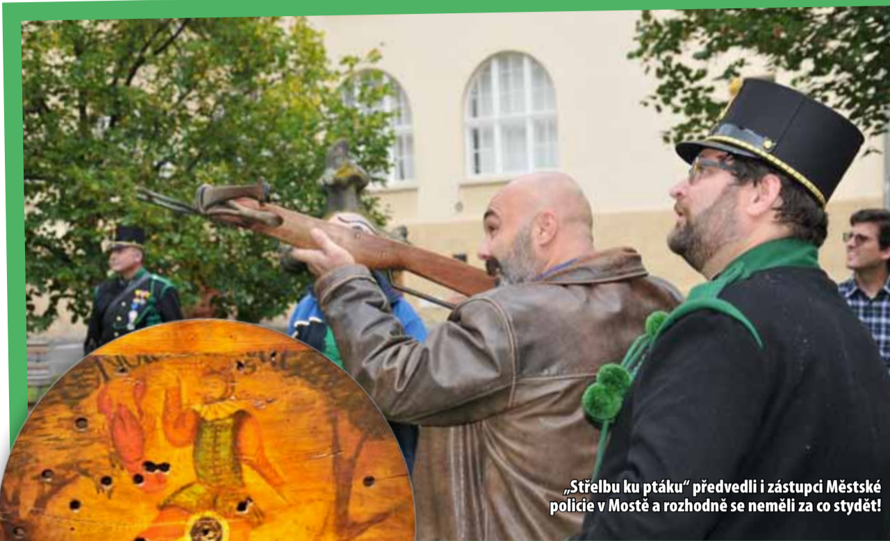
„Střelbu ku ptáku“ předvedli i zástupci Městské policie v Mostě a rozhodně se neměli za co stydět!