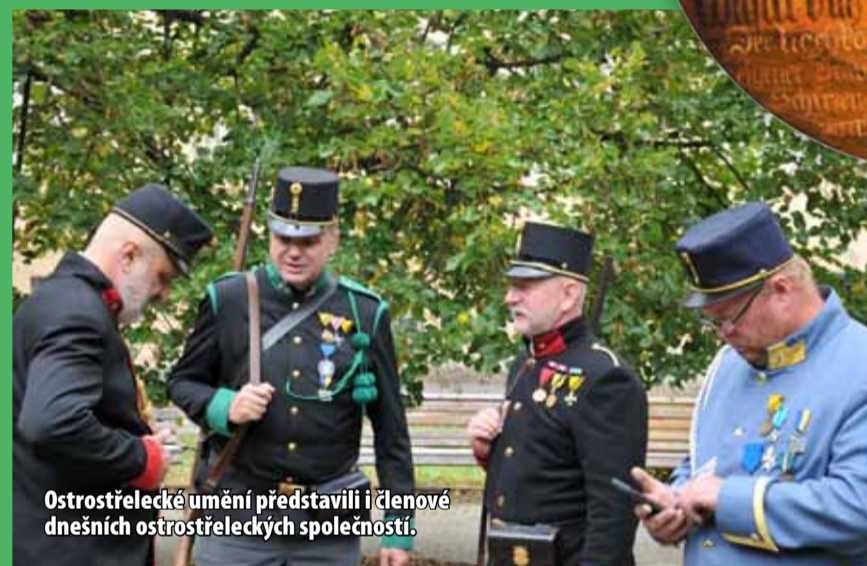
Ostrostřelecké umění představili i členové dnešních ostrostřeleckých společností.