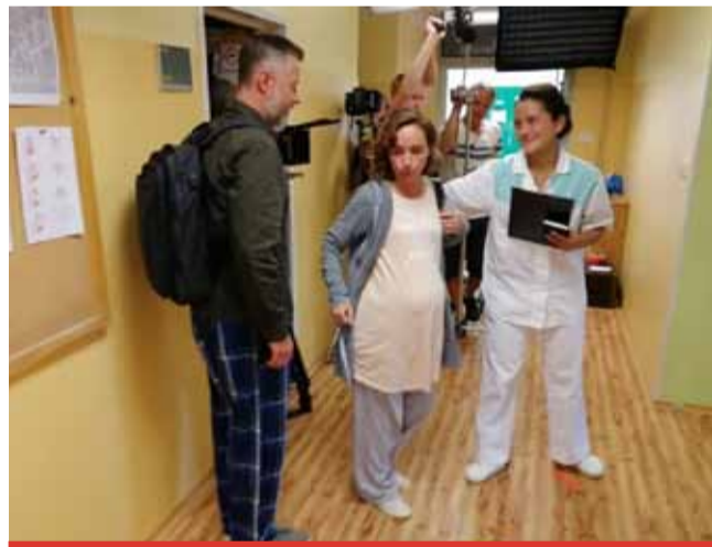
Masarykova nemocnice se na pár dnů změnila ve filmový ateliér.