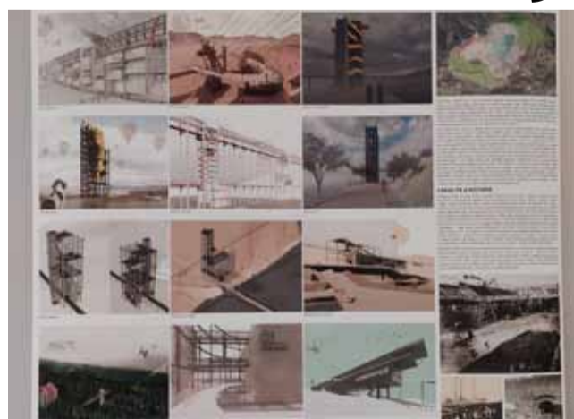
Výstava je k vidění ve výstavních prostorách budovy Krajského úřadu Ústeckého kraje.

cholodí a další zajímavé návrhy. Mladí architekti chtěli přiblížit krajinu po těžbě veřejnosti a obohatit ji zajímavými stavebními prvky. Práce studentů jsou plné nápadů a fantazie v tomto případě nedrželi na uzdě. Studenti měli během uplynulého semestru možnost rekvizice lomu ČSA navštívit, aby si tak přímo na místě udělali jasnou představu, jakými návrhy na výstavě ohromí. (ink)