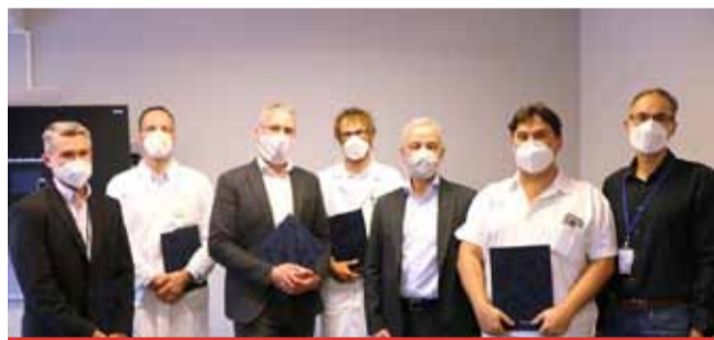
Koordinátoři budou fungovat jako poradní orgán náměstka pro řízení zdravotní péče.