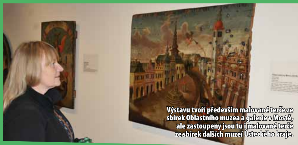
Výstavu tvoří především malované terče ze sbírek Oblastního muzea a galerie v Mostě, ale zastoupeny jsou tu i malované terče ze sbírek dalších muzeí Ústeckého kraje.