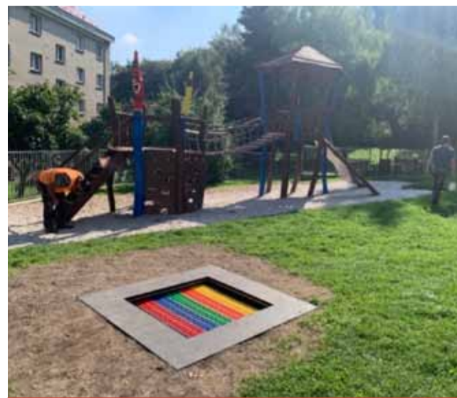
U dětského hřiště pod sportovní halou je nově instalována trampolína. Přibude ještě lezecká stěna.

Společnost Unipetrol RPA darovala letos městu Meziboří 250 tisíc korun. Za ty město pořídilo nové prvky na dětská hřiště a sportoviště. „U dětského hřiště pod sportovní halou, kde je nově pro děti instalována trampolína, přibude ještě lezecká stěna. V oddechové zóně v ulici Svahová budou mít děti průlezku a v ulici Nad Parkem se dokončuje street workoutová sestava včetně lavičky pro teenagery a cvičebního plánu,“ popsala Gabriela Soukupová. Oběma největším zaměstnavatelům v regionu, na jejichž pomoc a podporu se město spoléhá už řadu let, vyjádřila poděkování. (ink)