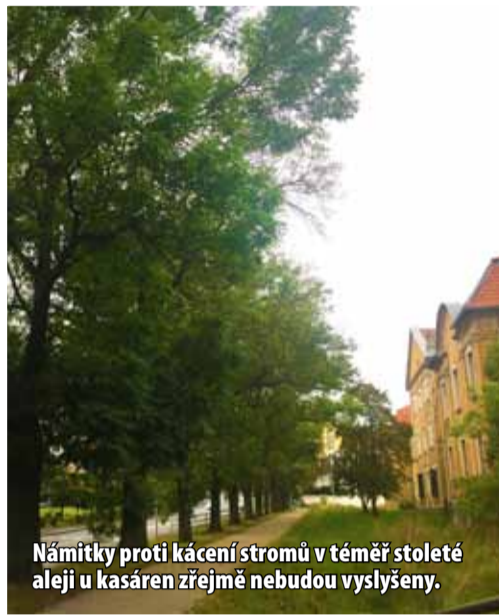
Námítky proti kácení stromů v téměř stoleté aleji u kasáren zřejmě nebudou vyslyšeny.

Vlasta ŠOLTYSOVÁ (Vyjádření Severočeské vodárenské společnosti na straně 2)