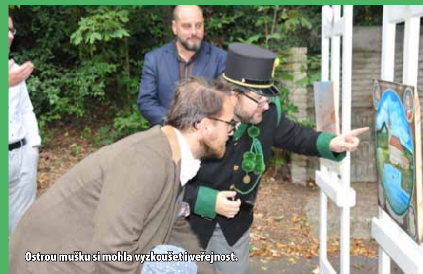
Ostrou mušku si mohla vyzkoušet i veřejnost.