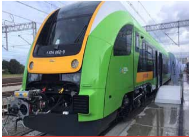
Cestující se mohou těšit na nové soupravy PESA. Budou pohodlnější a s větším komfortem.

Soupravy jsou plně bezbariérové a nízkopodlažní. Dveře jsou vybaveny asistenčním schůdkem. Interiér je klimatizovaný, vybavený zásuvkami pro 230 V a Wi-Fi. Ve voze je WC pro osoby s omezenou schopností pohybu a orientace a soupravy také umožňují přepravu dětských kočárků a jízdních kol. Vozidlo je vybaveno systémem pro hlášení zastávek a dalších dopravních informací. Sedadla pro cestující jsou polstrovaná s opěrkami hlavy a rukou (v pří-