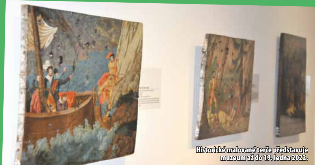
Historické malované terče představuje muzeum až do 19. ledna 2022.