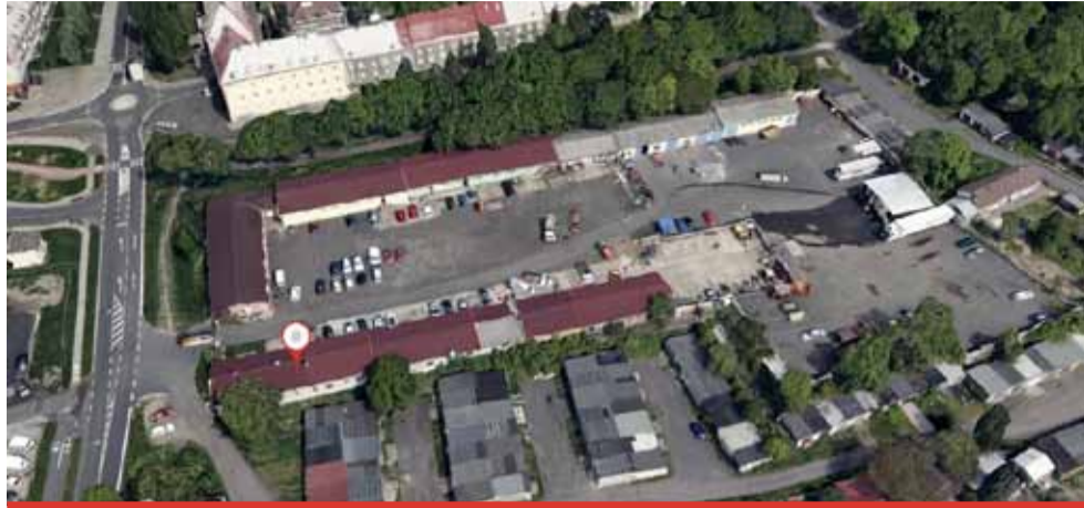
Technické služby se ze stávajícího areálu v ulici S. K. Neumanna (na snímku) přestěhují do „Kovošrotu“ - s nimi i sběrný dvůr a útulek.