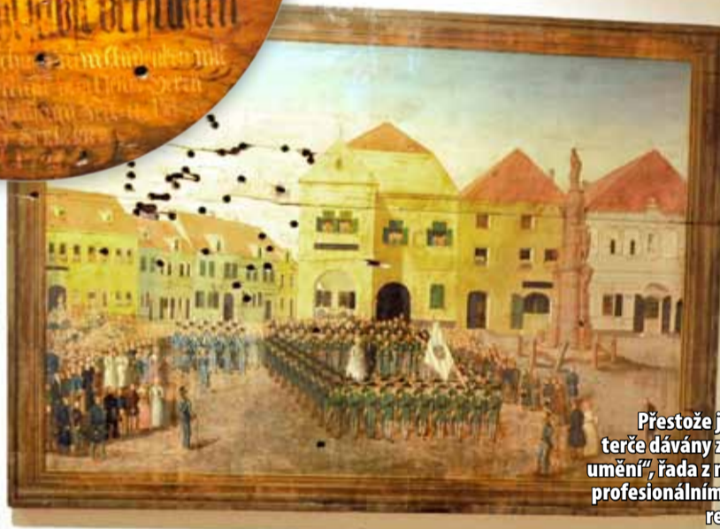
Přestože jsou dnes malované terče dávány za příklad „lidového umění“, řada z nich byla zhotovena profesionálními a často i známými regionálními umělci.