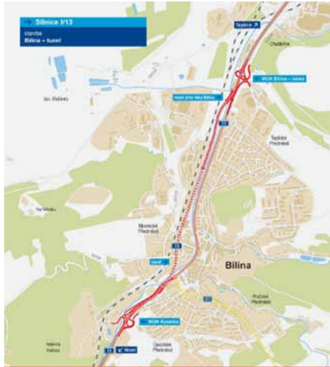
K samotné stavbě povede dlouhá cesta. Novým tunelem by mohli řidiči projíždět v roce 2032.