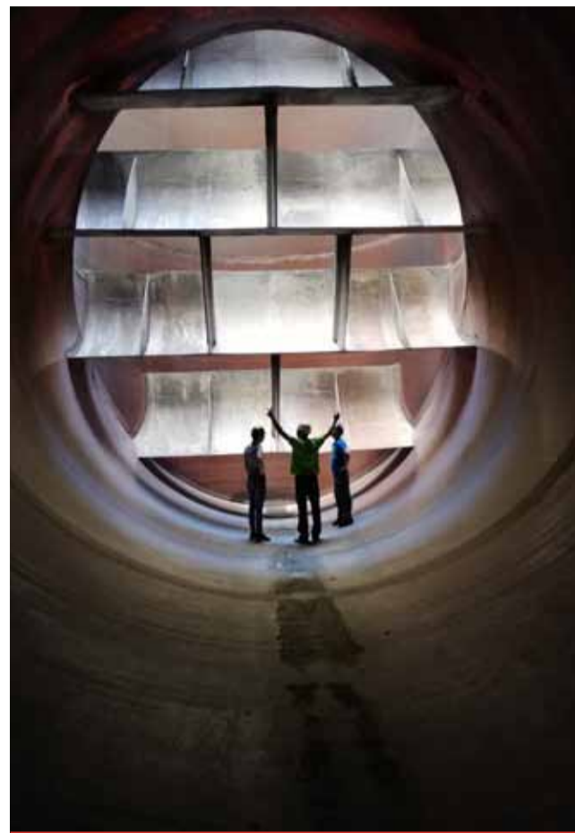
Vítězná fotografie z Elektrárny Chvaletice. Pořízena byla při jedinečné exkurzi do kouřovodu mezi absorberem a spalínovou věží. To, co připomíná plachetnici, jsou výstupní klapky z kouřovodu.