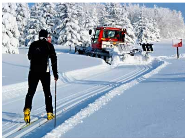
Destinační agentura Krušné hory ve spolupráci s Ústeckým krajem a těžební společností Sev.en Česká energie podporuje úpravu běžeckých tras.

Žadosti o podporu byly posuzovány ve dvou hodnotících obdobích (do konce března a do konce srpna). O přidělení rozhoduje vedení společnosti na základě doporučení grantové komise, kterou zajímá především vliv projektu na rozvoj místní komunity v oblasti vzdělávání, volnočasových aktivit dospělých či mládeže nebo přínos pro životní prostředí. Podrobná pravidla grantu včetně termínů vyhodnocení a přihlašovacího formuláře jsou k dispozici na webových stránkách skupiny a na firemním intranetu. Pro letošní rok byl příjem nových žádostí ukončen, zájemci se mohou ucházet o podporu opět v příštím roce.