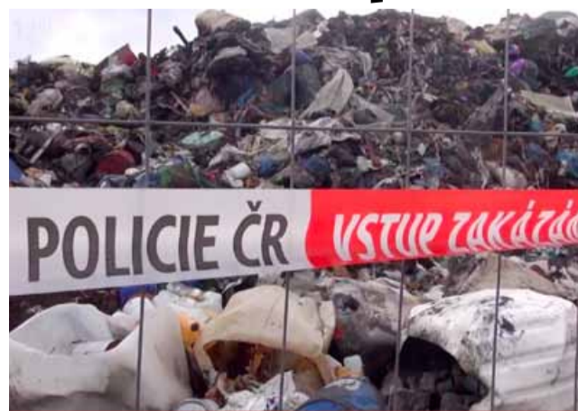
Časovaná bomba v podobě sudů s nebezpečným styrenem tíká na skládce Celio nedaleko města Litvínova už bezmála tři roky. Sudy zde přitom nikdy skončit neměly.