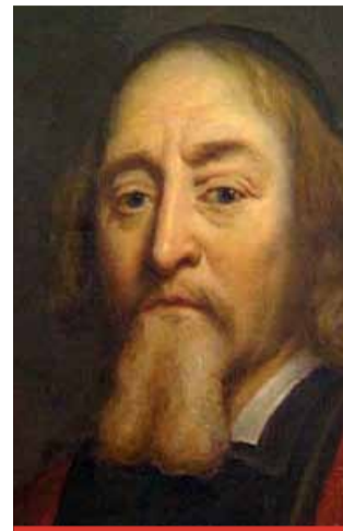
„kdybys vola po celém světě vodil, zůstane volem...“ (Jan Amos Komenský)

ale pouze o množství finančních prostředků určených pro organizace zřizované Ústeckým krajem. Další samosprávy na území kraje by si musely financovat své organizace ze svých zdrojů. Finanční prostředky by podle Jindry Zalabákové musel kraj vynaložit ze zdrojů, které by chyběly ve všech oblastech. Nejen ve školství. Dopady by byly na dotační programy kraje i investiční akce. „Chápu, že šetřit se musí. Nicméně současná vláda má jako jednu z priorit školství. A tato změna bude zásahem do financování škol ze stany kraje. Kraj bude muset dělat opatření, která ve školství nepedagogické pracovníky udrží. I v současné době je jich nedostatek, a proto jsou v našem kraji tato místa neobsazena. Pevně věřím, že budou na toto téma probíhat diskuse a zástupci krajů budou na ně přizváni. Cítím to jako velký finanční zásah pro kraj. A to nemluví o nedostatku školních psychologů, kdy