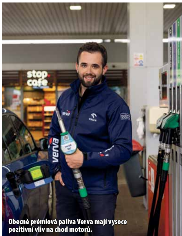
Obecně prémiová paliva Verva mají vysoce pozitivní vliv na chod motorů.

Prémiová paliva obecně obsahují aditiva na základě poměrně detailního vývoje, jehož výsledkem je optimální složení a koncentrace použitých přísad. Když do prémiového paliva přidáte aditiv, o kterém ani nevíte, zda ho již palivo náhodou neobsahuje, tak mohou nastat tři případy. Nejčastěji se nestane vůbec nic. Dále se může stát, že si prémiové palivo vylepšíte pouze „o chlup“, což na provozních vlastnostech vozidla prakticky nepocítíte. V nejhorším případě si prémiovou kvalitou paliva můžete dokonce zhoršit. Aditiv, který si zakoupíte, nemusí být stejný jako v palivu, což může vést k jejich nekompatibilitě a vzájemnému vyrušování. Dodatečná aditivace prémiových naft v zimním období mnoh-