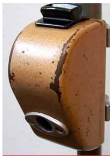
Trocha nostalgické nikoho nezabije. Tento odbavovací systém jej již téměř zapomenutou historií, i když mnozí ho ještě pamatují.

rookům cestujících a ani objednatelů dopravy. Není již kompatibilní s ostatními dopravními a chybí mu i některé funkcionality, které v době jeho pořízení ještě ani neexistovaly. (sol)