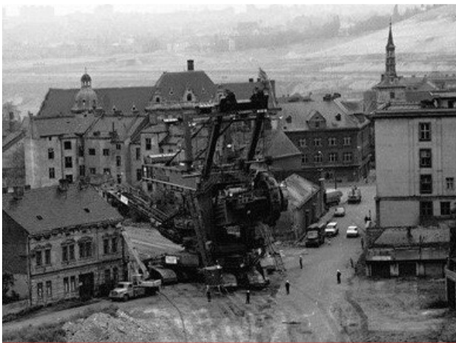
Unikátní představení o zničení starého Mostu uvede Studio3 Ponte records.