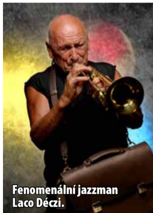
Fenomenální jazzman Laco Déczi.

Kdo je Laco Déczi ví v Česku snad každý. Je mu 85 let a jako nejlepší československý trumpetista byl poprvé vyhodnocen už v roce 1963. Od roku 1985 žije v New Yorku, je krásně (s) prostořeký, mluví česko-slovensko-americky a nebere si žádné servítky. V roce 1967 založil kapelu Jazz Celula, která se aktuálně jmenuje Jazz Celula New York. Do Mostu přijede s triem excelentních doprovodných muzikantů z New Yorku.