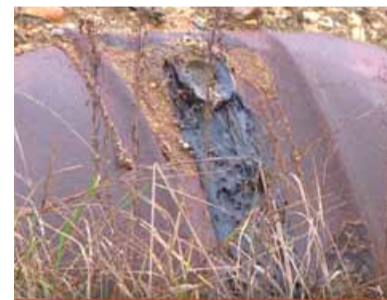
Policisté kvůli nezákonnému uložení smol obvinili tehdejší manažery skládky.

LITVÍN – Vedení města uvítalo nedávné rozhodnutí Krajského soudu v Ústí nad Labem v kauze nelegálně uložených styrenových smol na skládce Celio. Krajský soud zrušil rozhodnutí Ministerstva životního prostředí ČR pro nepřezkoumatelnost a dal Litvínovu za pravdu ve všech klíčových bodech.