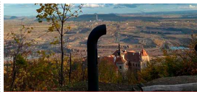
Hlavní funkcí poesiomatu je reprodukce básní široké veřejnosti.

Poesiomat je obvykle pojatý jako „socha“, která vychází z tradičních tvarů hlasných zařízení jako je hlásná trouba, megafon, gramofon a podobně. Poesiomat by měl být odolný a konstrukčně jednoduchý. Poesiomaty vymyslel Ondřej Kobza a najdete je po České republice i v zahraničí. První poesiomat na světě byl postaven v Praze Vinohradech na náměstí Míru v roce 2015. (nov)