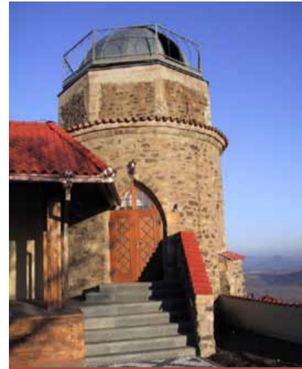
Hvězdárna prošla opravou a znovu se otevře na jaře.

Knihovna chce navázat spolupráci s nájemci hradu Hněvín, aby hvězdárna byla otevřená pravidelně. „Chceme se také starat o techniku tak, aby byla v co nejlepší kondici. Hvězdárna se může pochlubit unikátním dalekohledem se speciálním filtrem, kterým je možné pozorovat slunce.“