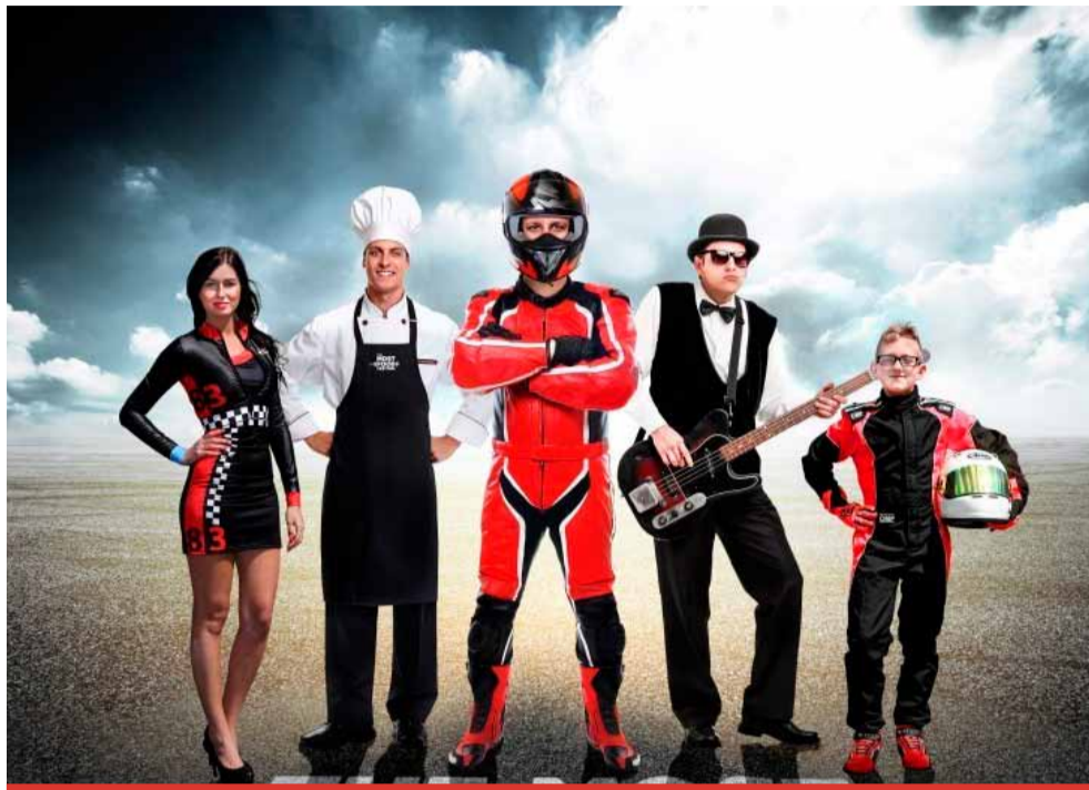
Autodrom Most hlásí volnou pozici sportovního manažera. Přidáte se do skvělého týmu?

Zaměstnavatel požaduje minimálně SŠ vzdělání, ochotu pracovat a učit se nové věci, znalost AJ je podmínkou - minimálně úroveň B2 (každodenní písemná i ústní komunikace s partnery), znalost NJ je výhodou. Dále osobní a časovou flexibilitu, organizační schopnosti a řidičský průkaz skupiny B.