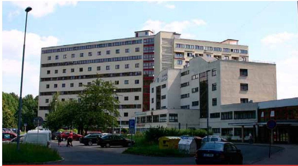
Nová obrazová publikace Koldům v Litvínově, která vznikala za podpory 7grantu, dokumentuje prostřednictvím unikátních fotografií a popisu vznik této monumentální stavby a přibližuje životní podmínky prvních nájemníků.