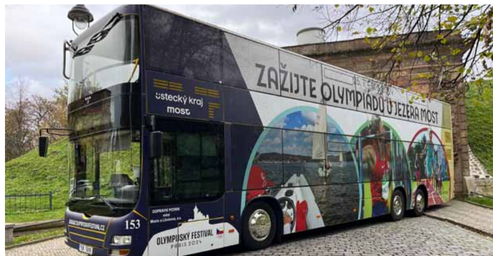
Na olympijský festival láká speciální doubledecker, který jezdí k jezeru Most.