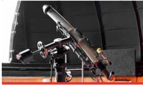
Mostecká hvězdárna, která nově spadá pod mosteckou knihovnu, se může pochlubit unikátním dalekohledem se speciálním filtrem, kterým je možné pozorovat slunce.

Hvězdárna je už dva roky uzavřená. Důvodem je rekonstrukce hradu. Hvězdárna prošla opravou a znovu se otevře na jaře. „Připravují se převodní smlouvy, protože dosud hvězdárnu provozovala Hvězdárna a planetárium Teplice, spadající pod Ústecký kraj. S ředitelem hvězdárny jsme se domluvili na spolupráci a na tom, že knihovna je nekompetentnějším subjektem, který by ji mohl spravovat, a to i vzhledem k tomu, že pod sebou máme planetárium