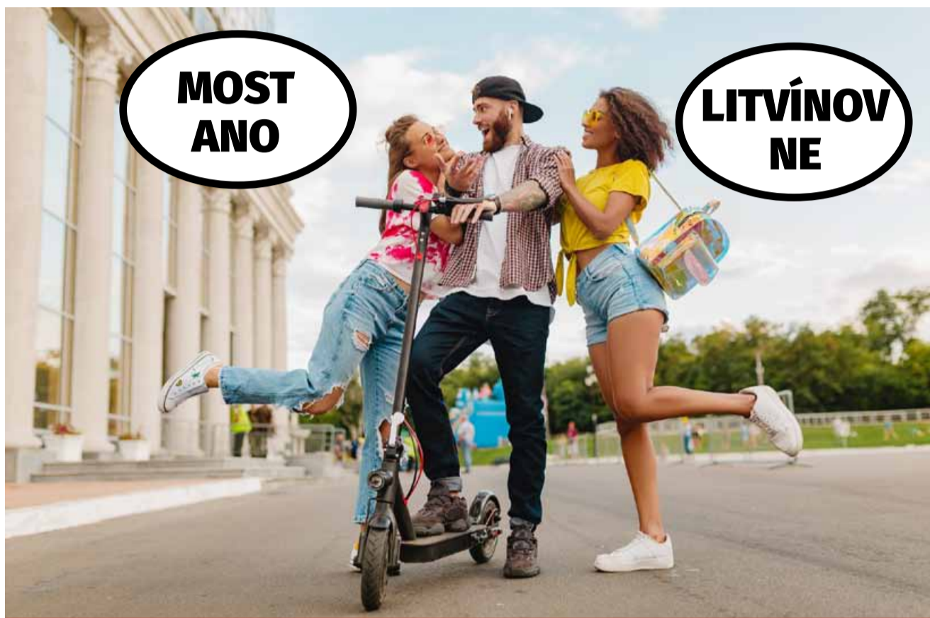
Názory na sdílené elektrokoběžky se různí. Svě zastánci i odpůrci má jak mezi lidmi, tak i mezi městy.