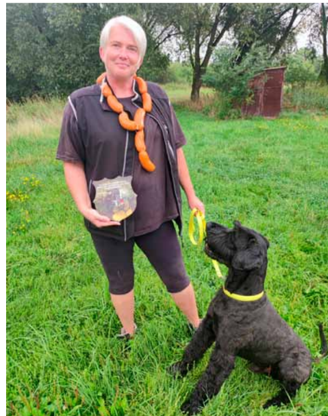
Psovodka, která zachránila seniora, působí v kynologickém klubu Lom jako hlavní trenérka výcviku.

n. m. Upravené trasy se nově propisují do www.mapy.cz . Stačí přepnout na zimní mapu.