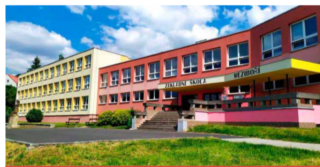
Základní škola Meziboří má trvale nejlepší pověst v celém Ústeckém kraji.

odpadů a vody v ZŠ a MŠ Mírová, opravu výtahu ZŠ, výměnu rozvodů topení a radiátorů v MŠ Mírová. V plánu je také oprava školního hřiště ZŠ, oprava fasády ZŠ Meziboří, oprava střechy v MŠ Mírová, rekonstrukce WC ve školní družině a vybudování podélného parkování pro rodiče vedle školy.