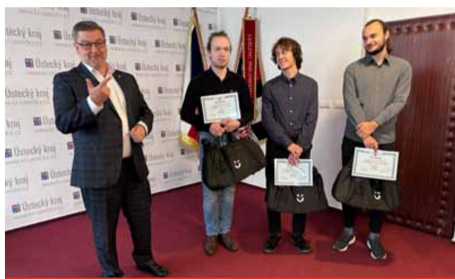
Ocenění týmu „Slave Squad“.