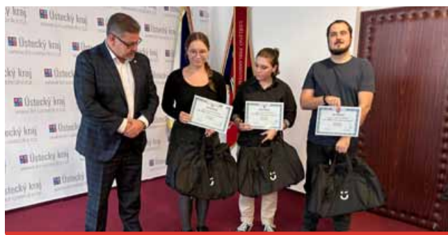
Ocenění týmu „Jsme tu pro zápočet“.