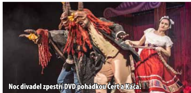
Noc divadel zpestří DVD pohádkou Čert a Káča.