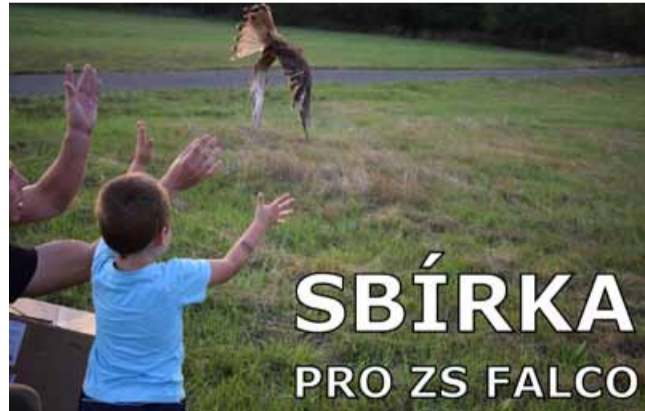
SBÍRKA PRO ZS FALCO