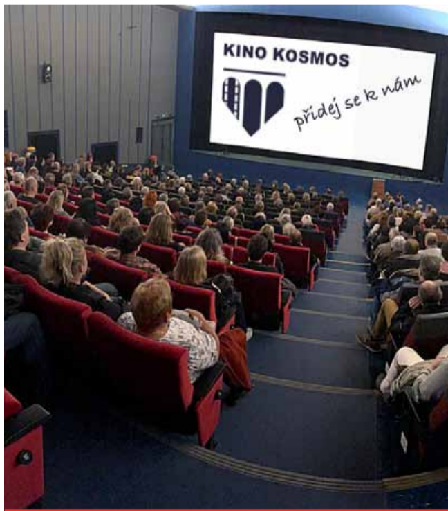
Z velkého sálu kina Kosmos zmizí ještě letos poslední dřevěné retro sedačky a už teď se pracuje na redigitalizaci, která bude znamenat lepší obraz i zvuk.

Filmový zážitek povýší především obnova digitální techniky na velkém sále. Sál MIDI digitalizaci již prošel. Je to nezbytný krok každého kina, které má více než 10 let po zavedení digitální projekce. Mostecké kino promítá v digitální kvalitě už 12 let. Projektor je na hranici životnosti, což se projevuje na kvalitě obrazu. „Promítací technologie se vyvíjí a stoupají i nároky diváků. Změnil se způsob výroby a natáčení filmů, zvyšuje se jejich kvalita a v našem kině technika neodpovídá těmto požadavkům. Redigitalizací bychom měli být schopni kopírovat kvalitu vyrobených filmů,“ vysvětlil ředitel s tím, že dojde ke zvýšení kvality barev i zvuku. Kdy se diváci ostrého obrazu i zvuku v MAXI sále dočkají, se ještě neví. „Redigitalizace je ve fázi příprav. Je náročná na dodání technologie, protože se nejedná o běžné zboží, ale o speciální digitální techniku,“ vysvětlil ředitel. (sol)