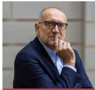
Ministr školství Mikuláš Bek podle odborníků i pedagogů českému školství příliš nepomáhá. Spíše se v něm pohybuje jako slon v porcelánu.

Nápad, který má pomoci státu, představil ministr školství Mikuláš Bek (STAN). Řadě radnic se však zá-