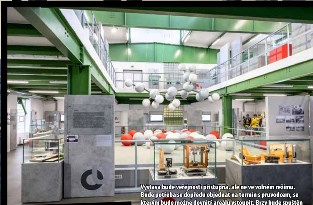
Výstava bude veřejnosti přístupná, ale ne ve volném režimu. Bude potřeba se dopředu objednat na termín s průvodcem, se kterým bude možné dovnitř areálu vstoupit. Brzy bude spuštěn rezervační systém, přes který bude rezervace termínů možná.