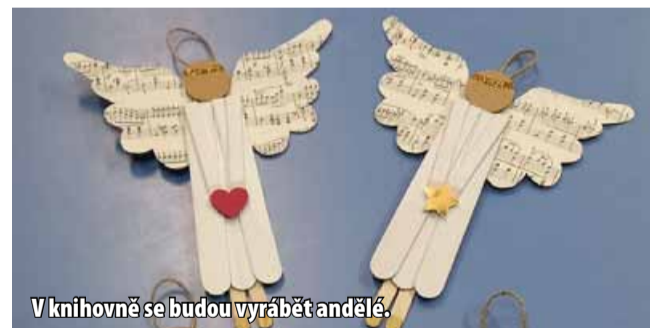
V knihovně se budou vyrábět andělé.

Na tvůrčím workshopu Tvoření bez talentu si tentokrát s Janou Nigrinovou můžete vyrobit dekorativní andělé. Poplatek za 1 workshop je 100 Kč. Nutná je rezervace místa na polivkova@knihovna-litvinov.cz. (nov)