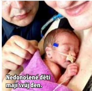
Nedonošené děti mají svůj den.

MOST - Město Most se tradičně symbolicky připojí ke Světovému dni předčasně narozených dětí. Jako poděkování lékařům a sestřím za jejich péči o nedonošené děti se stejně jako řada dalších památek zahájí 17. listopadu do purpurové barvy také hrad Hněvín.