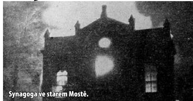
Synagoga ve starém Mostě.

V současné době se po celém světě rozmáhá fenomén „nového antisemitismu“. Nenávisť vůči rase, náboženství, národnosti,