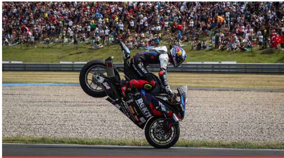
WorldSBK Czech Round 2025 se na Autodromu Most uskuteční nově 16. až 18. května. Vstupenky jsou již v prodeji.

Autodrom Most přichystal pro fanoušky WorldSBK ta-