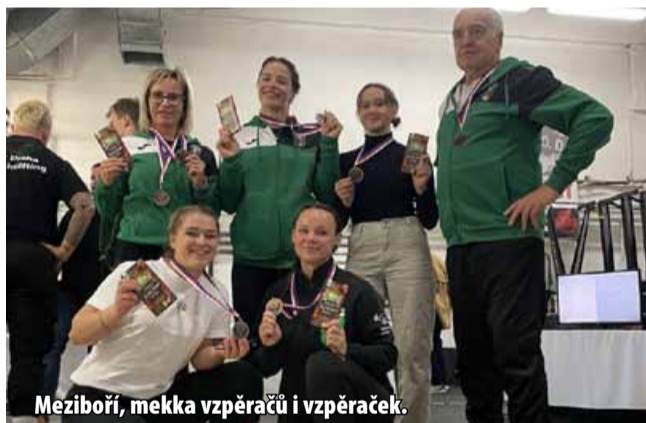
Meziboří, mekka vzpěračů i vzpěraček.