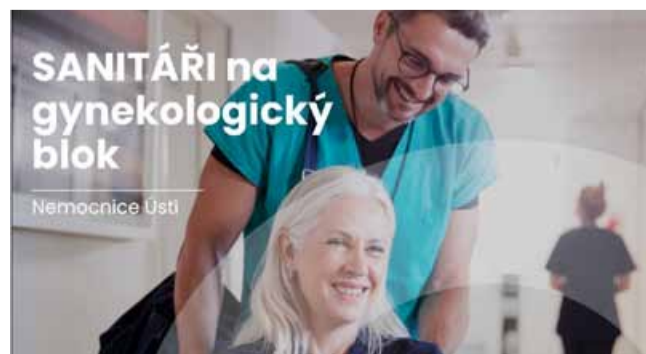
SANITÁŘI na gynekologický blok Nemocnice Ústí