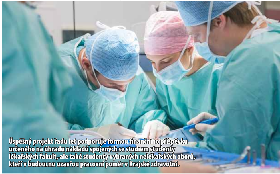
Úspěšný projekt řadu let podporuje formou finančního příspěvku určeného na úhradu nákladů spojených se studiem studenty lékařských fakult, ale také studenty vybraných nelékařských oborů, kteří v budoucnu uzavřou pracovní poměr v Krajské zdravotní.

Desítky tisíc korun za rok ale získají i další skupiny studentů v různých oborech. Stipendijní program pro akademický rok 2024/2025 podpořilo představenstvo Krajské zdravotní pro studenty čtvrtých a vyšších ročníků vysokoškolského prezenčního studia v oborech lékař a farmaceut. Pro studenty prvních a vyšších ročníků vysokoškolského studia také v oborech všeobecná a dětská sestra, porodní asistentka, radiologický asistent a zdravotnický záchranář, dále pro studenty čtvrtého a vyššího ročníku vysokoškolského prezenčního studia