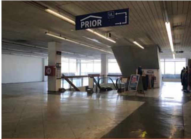
Do prázdného prvního patra by se měly přestěhovat obchody z druhého patra.

Sláva obchodního domu Prior, jehož stavba začala v roce 1971 a trvala tři roky, je dávno minulostí. V současné době zde funguje jen trafika, domácí potřeby s papírnictvím, švadlenka, textil a německé potraviny. Stavba kdysi vyhlášeného prodejního centra s plochou 4 233 metrů čtverečných tehdy přišla na 78 mil. Kčs. (sol)