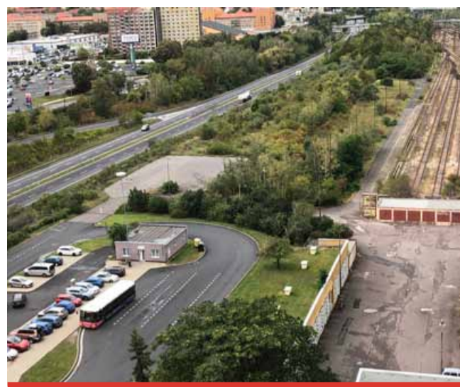
Nádraží vznikne na ploše, kde dnes nic v podstatě není - v levé části od stávajícího vlakového nádraží.

Ostudou přednádraží je dlouhá léta nevyužitý prostor starého autobusového terminálu. Pozemky se zaniklým autobusovým nádražím vlastní společnost BUSCOM. S ní město v minulosti vyjednávalo a chtělo pozemky odkoupit, aby mohlo vybudovat terminál zde. „BUSCOM měl sice vůli k prodeji, ale za zcela nesmyslnou cenu. Jednali jsme s nimi opakovaně, ale nikam to nevedlo. Museli jsme proto najít alternativu. Nové autobusové nádraží by zde bylo ideální. Tato část proto zůstává i dál nevyužitá a zdevastovaná,“ připomněl primátor.