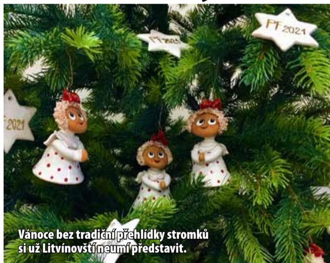
Vánoce bez tradiční přehlídky stromků si už Litvínovští neumí představit.