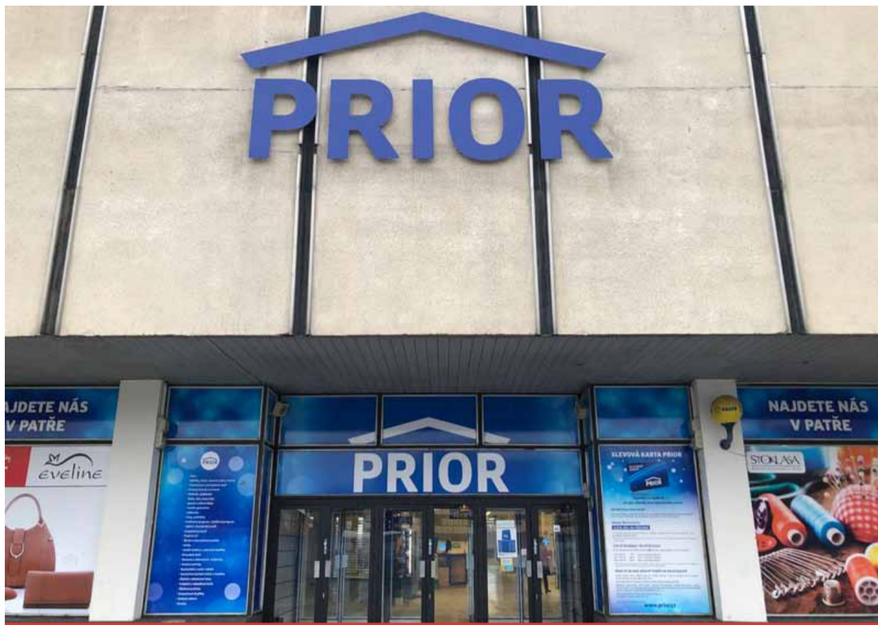
Lidé se často ptají, zda v Prioru, než se začne rekonstruovat, zůstanou stávající obchody, jako je švadlenka a látky, oděvy, obuv, papírnictví, domácí potřeby, trafika a německé potraviny. Město ujišťuje, že udělá vše, aby současní nájemci v Prioru zůstali.

PRO AKTUÁLNÍ ZPRAVODAJSTVÍ SLEDUJTE WWW.HOMERLIVE.CZ