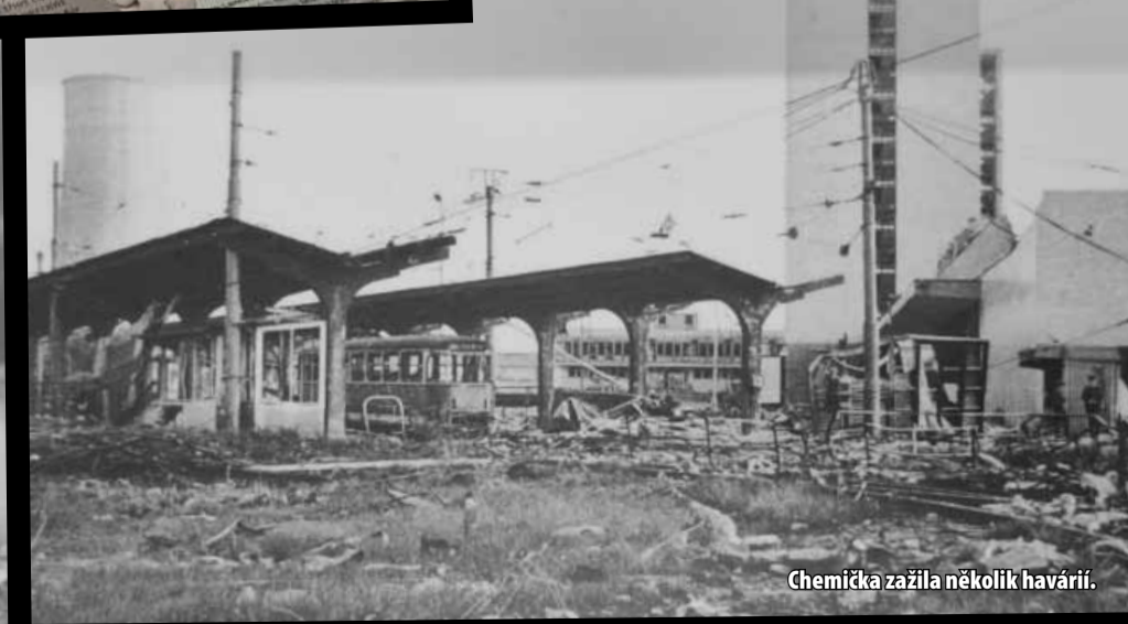
Chemička zažila několik havárií.

Slavnostní výkop k vybudování továrny proběhl 5. května 1939 Konrádem Henleinem.