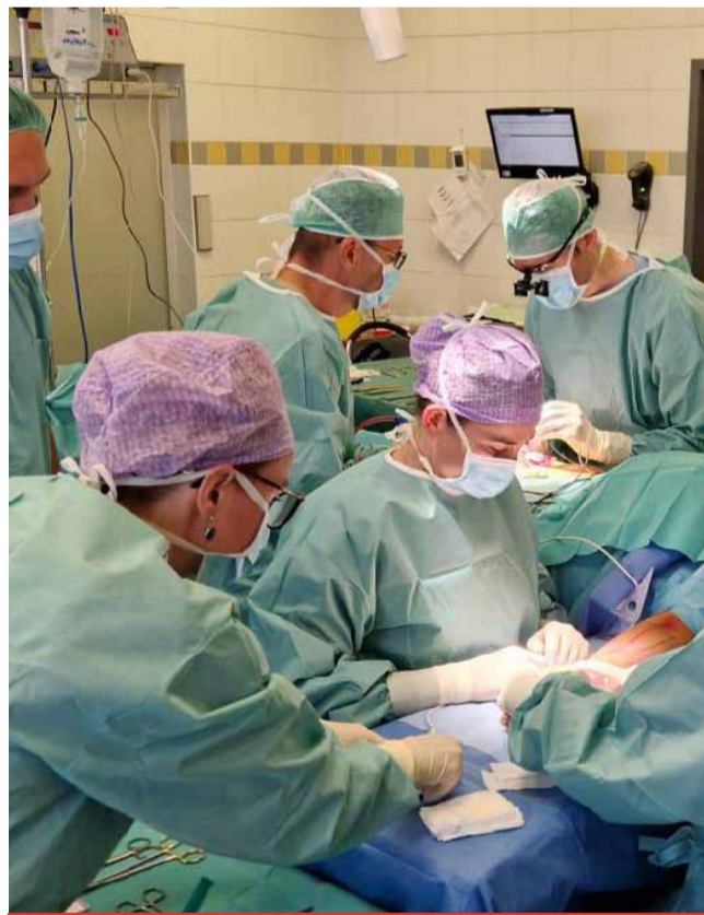
Na poskytování specializované zdravotní péče, nejen pro obyvatele Ústeckého kraje, vedle zdejšího vysoce odborného a zkušeného personálu se podílejí lékařští specialisté z celé republiky.