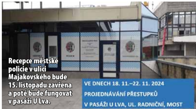
Recepce městské policie v ulici Majakovského bude 15. listopadu zavřena a poté bude fungovat v pasáži U Lva.