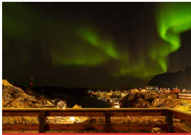
Grónsko, země kde stále ještě člověk nemá a snad nikdy ani nezíská moc nad přírodou.

Vstupenky za 120 Kč jsou zakoupeny v pokladně Citadely nebo v síti Ticketportal.cz, s možností rezervace on-line nebo na tel. čísle 476 111 487. (nov)