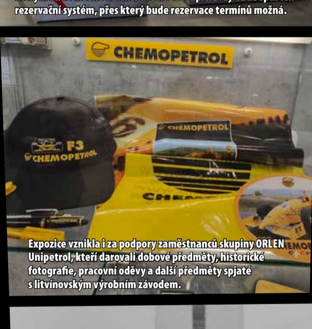
Expozice vznikla i za podpory zaměstnanců skupiny ORLEN Unipetrol, kteří darovali dobové předměty, historické fotografie, pracovní oděvy a další předměty spjaté s litvínovským výrobním závodem.