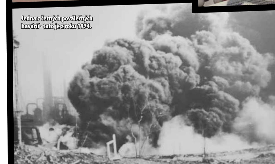
Jedna z četných poválečných havárií - tato je z roku 1974.