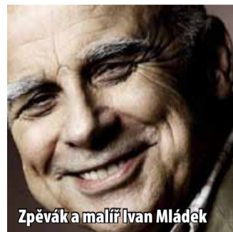
Zpěvák a malíř Ivan Mládek

MOST – Frontman známé kapely Banjo Band Ivan Mládek se v Mostě představí jako malíř. A ne ledajaký. Jeho díla totiž v aukcích trháji rekordy. Všeslovanskou epopej Ivana Mládku můžete vidět od 18. listopadu ve výstavní síni Zlatá trojka v mosteckém divadle.