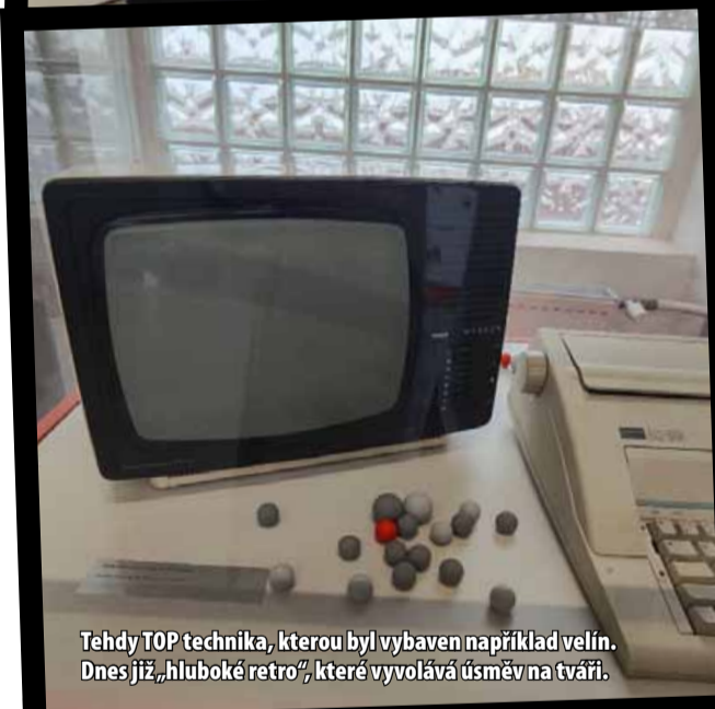
Tehdy TOP technika, kterou byl vybaven například velín. Dnes již „hluboké retro“, které vyvolává úsměv na tváři.