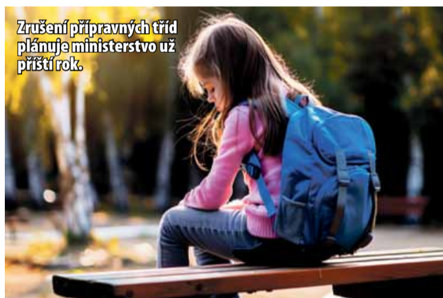
Zrušení přípravných tříd plánuje ministerstvo už příští rok.

Na další otázky, z jakých zdrojů budou asistenti pedagogů financováni a zda bude brát ministerstvo školství při rušení přípravných tříd zřetel na sociálně slabé regiony, jako je například Mostecko, potažmo Ústecký kraj, kde je velké množství dětí ze sociálně slabého prostředí bez základních návyků před vstupem do první třídy, ministerstvo neodpovědělo.