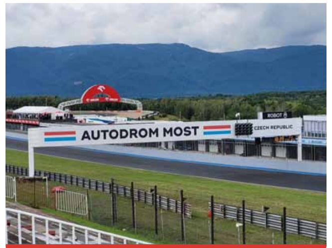
Mostecký závodní okruh čeká příští rok další vylepšení. Autodrom Most do dráhy investuje 25 mil. Kč.

Autodrom instaluje také nové generace LED panelů, včetně startovacího zařízení pro signalizaci jezdcům a informování v reálném čase, zmodernizuje software kamerového systému pro zpětné přehrávání záznamů sportovními komisáři a modernizací projde i technologie pro výběr parkovního pro rychlejší a pohodlnější odbavení. Nadále platí na mosteckém okruhu omezení provozní doby do 18 hodin, které podle Josefa Zajíčka pro Autodrom Most znamená ztrátu 15 mil. Kč. (nov)