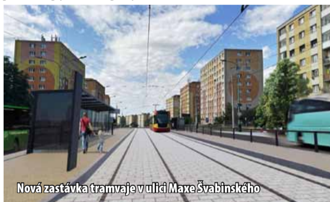
Nová zastávka tramvaje v ulici Maxe Švabinského

s ulicí V. Nejedlého, pod bývalou tržnicí,“ vyjmenoval primátor.