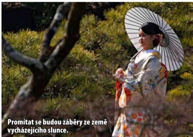
Promítat se budou záběry ze země vycházejícího slunce.

Vstupné je 280 Kč. Pokud je to možné, kupujte si vstupenky co nejdříve plátnu. Rozlišení při diashow je jiné než ve stan-