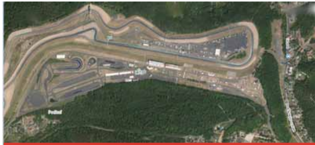
„Tím, že tu vznikl autodrom a postupem času se k němu přibližovaly i jednotlivé domy, tak vznikl problém.“ (Berenika Peštová)

Teprve až po roce 1989 začala platit ELA a zjišťovací řízení, které vyhodnocuje, jaké