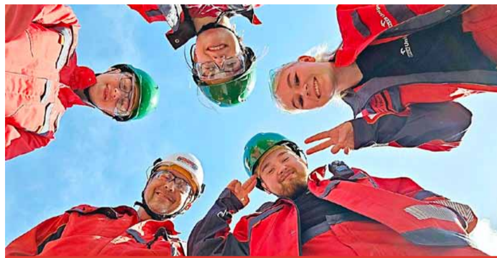
Skutečnost, že se část veřejné vysoké školy nachází přímo v komerčním výrobním areálu, je výjimečná nejen v České republice, ale i v Evropě.

Univerzitní centrum Litvínov VŠCHT – FS ČVUT – ORLEN Unipetrol v litvínovském Chemparku je jediným místem v Česku, kde je část veřejné vysoké školy situována přímo ve výrobním areálu. Od roku 2015 tu každý rok zhruba 50 studentů studuje v bakalářském, magisterském a doktorandském programu přímo v srdci největšího chemického závodu v republice. „Skutečnost, že se část veřejné vysoké školy nachází přímo v komerčním výrobním areálu, je výjimečná nejen v České republice, ale i v Evropě. Spojení je jedinečné i díky možnosti ověřit nabyté teoretické znalosti rovnou