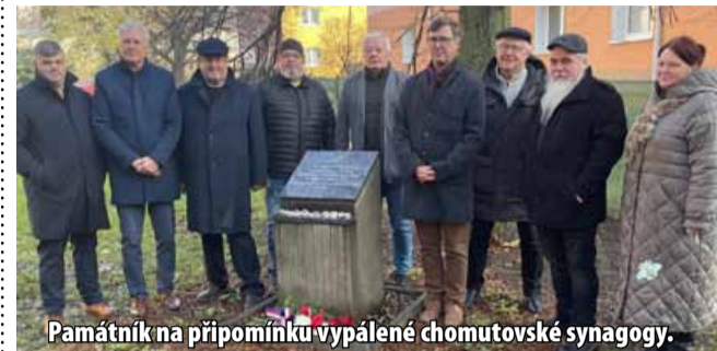
Památník na připomínku vypálené chomutovské synagogy.