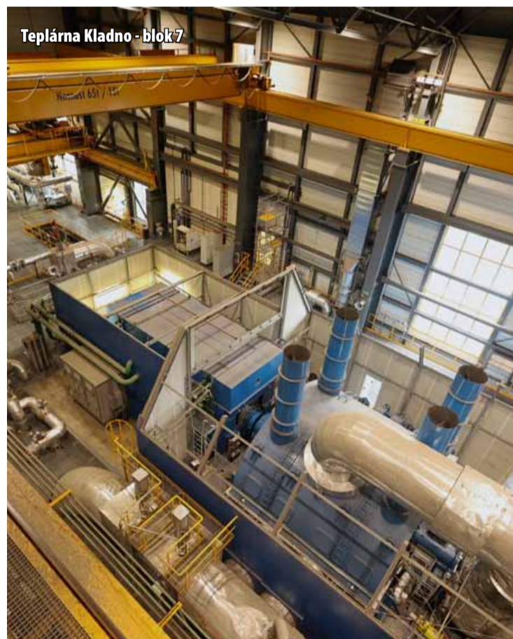
Teplárna Kladno - blok 7