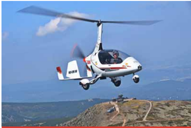
Létající automobil alias vírník v akci.

První vírník sestrojil roku 1923 Španěl Juan de la Cierva. Před druhou světovou válkou byly vírníky oblíbené jako pozorovací a spojovací letadla. Jejich předností byla zejména nízká minimální rychlost a velmi krátká startovací i přistávací dráha. Například během druhé světové války byly vírníky těženy německými po-