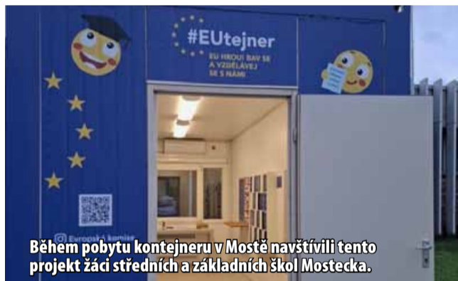
Během pobytu kontejneru v Mostě navštívili tento projekt žáci středních a základních škol Mostecké.